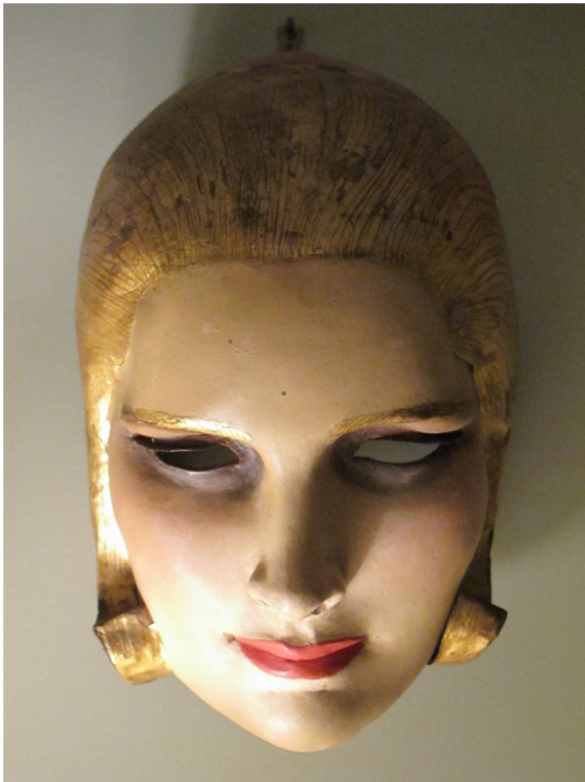
W. T. Benda, niezidentyfikowana maska, zbiory Ann Taylor, fot. ARS.