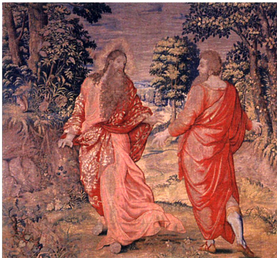
Rozmowa Boga Ojca z Noem. Seria Dzieje Noego. pracownia Jana de Kempeneera, projekt Michiel Coxie, ok. 1550 r., (w:) J. Szablowski, Arrasy flamandzkie w Zamku Królewskim na Wawelu, wyd. Arkady, Warszawa 1975