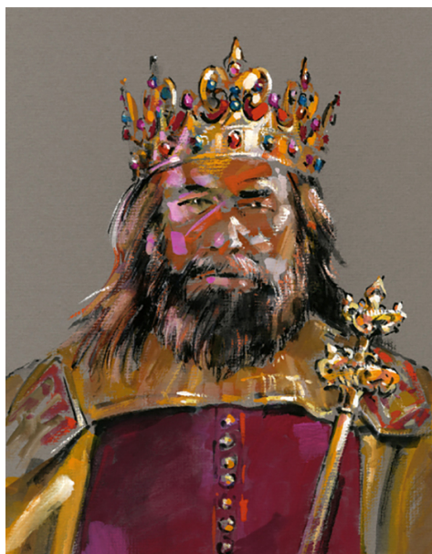
Kazimierz Wielki, autor: Waldemar Świerzy

ich wizerunki miały ukazywać dawną świetność i chwałę Rzeczypospolitej. Nawet Jadwiga, która została królową licząc sobie jedenaście lat, a jako trzynastoletnią wydano ją za mąż za Władysława Jagiełłę, przedstawiona jest przez Matejkę jako bardzo dostojna matrona, prawie jak Jagienka z sienkiewiczowskich „Krzyżaków”, co to miała siadając rozgniatać orzechy.