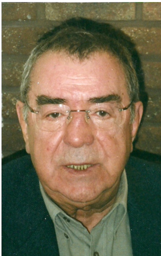
Prof. Waldemar Świerzy

swych plakatów w Sopocie, z drabiny i złamał bark. To złamanie mogło oznaczać zakończenie jego artystycznej kariery. Profesor jednak się nie poddał i po kilkumiesięcznej intensywnej rehabilitacji okazało się, że nie tylko powrócił do dawnej formy ale też – jak stwierdzili znawcy – kolejne portrety, poczynając od królowej Jadwigi, były jeszcze lepsze. Malował je szybciej, odważniej i z większą pasją. Gdy pozostali do namalowania już tylko dwaj ostatni władcy dopadła Profesora nieuleczalna choroba i miał udać się do szpitala. Ale jak przystało na solidnego człowieka, zdołał przed tym dokończyć dzieło życia i dopiero potem zgłosił się do szpitala, w którym zmarł w kilka dni później 27 listopada 2013 r., już po namalowaniu ostatniego 49 władcy Polski króla Stanisława Augusta Poniatowskiego.