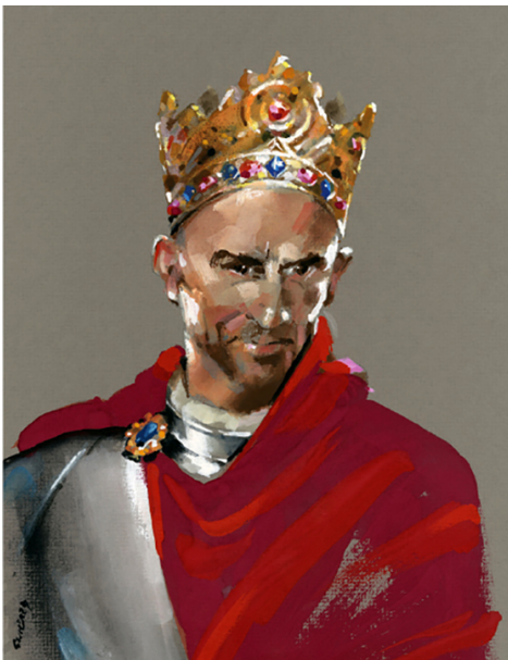
Władysław Jagiełło, autor: Waldemar Świerzy

Do tego poczet Jana Matejki jest niekompletny. Artysta pominął siedmiu nie bardzo wygodnych władców, dodał zaś żony Mieszka I i Mieszka II. W sumie poczet ten liczy 44 jednobarwnych, potem pokolorowanych, ołówkowych rysunków namalowanych przez artystę dla podreperowania domowej kasy, na zamówienie