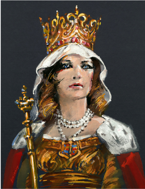
Królowa Jadwiga, autor: Waldemar Świerzy, copyright: Kreacja Pro.