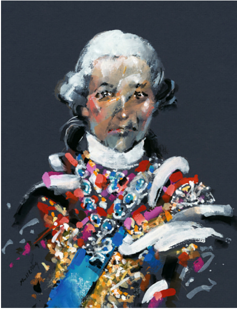
Stanisław August Poniatowski, autor: Waldemar Świerzy

Początkowo malowanie szło dobrze, po namalowaniu dwudziestu czterech postaci wydano nawet kalendarz ścienny z dwunastoma na 2008 rok. Potem jednak nastąpiła kilkuletnia przerwa w realizowaniu tego wielkiego przedsięwzięcia. Zbliżający się do osiemdziesiątki Waldemar Świerzy zaczął się obawiać, czy danym mu będzie ukończyć rozpoczęte dzieło. W końcu jednak udało się pokonać kłopoty i Profesor mógł kontynuować pracę, lecz wówczas spadł, w czasie przygotowania wystawy swych plakatów w Sopocie, z drabiny i złamał bark. To złamanie mogło oznaczać zakończenie jego artystycznej kariery. Profesor jednak się nie poddał i po kilkumiesięcznej intensywnej rehabilitacji okazało się, że nie tylko powrócił do dawnej formy ale też – jak stwierdzili znawcy – kolejne portrety, poczynając od królowej Jadwigi, były jeszcze lepsze. Malował je szybciej, odważniej i z większą pasją. Gdy pozostali do namalowania już tylko dwaj