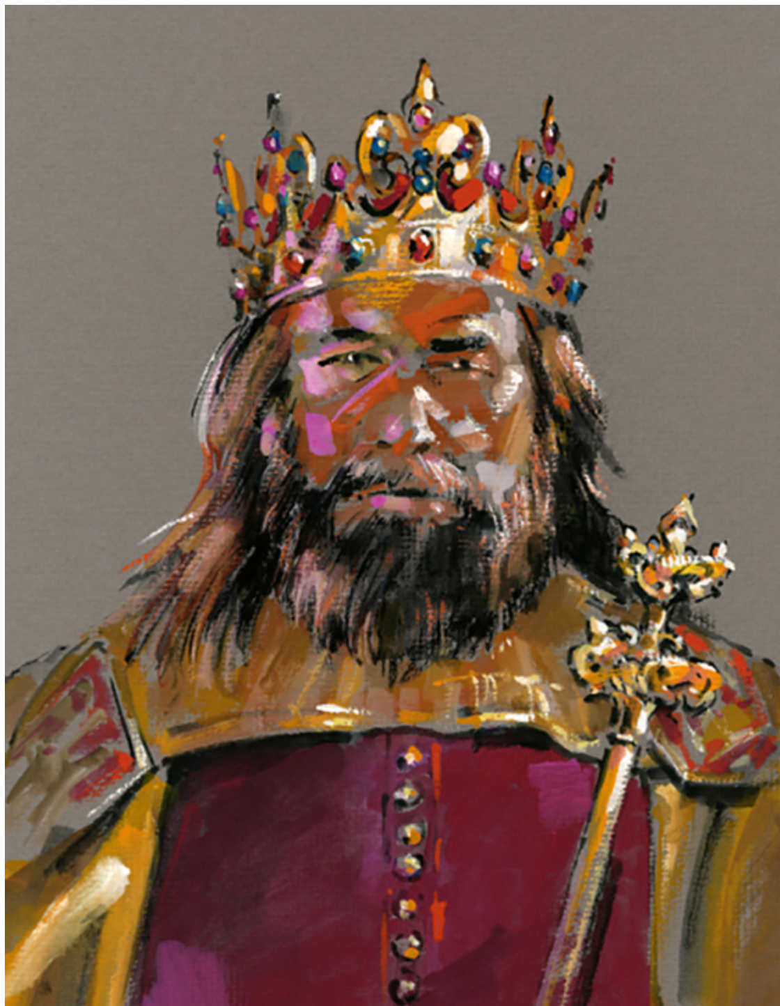
Kazimierz Wielki