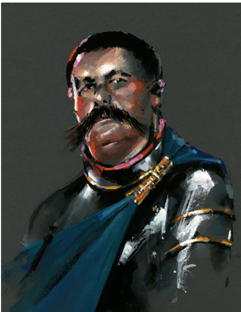
Jan III Sobieski