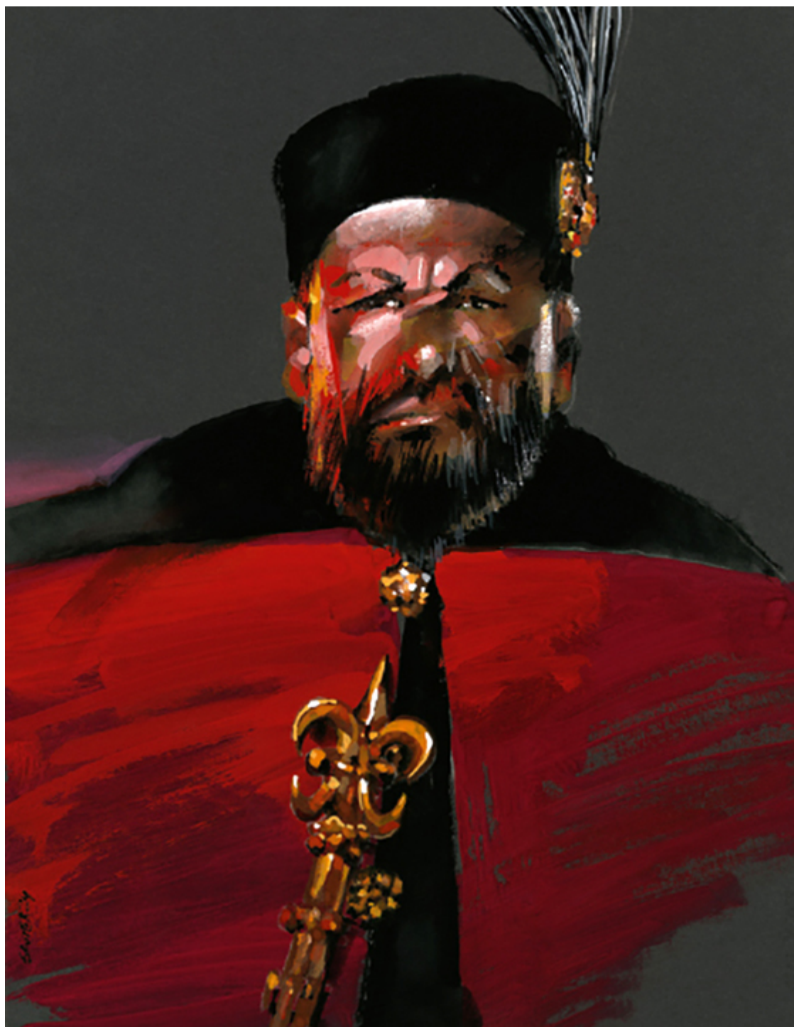
Stefan Batory