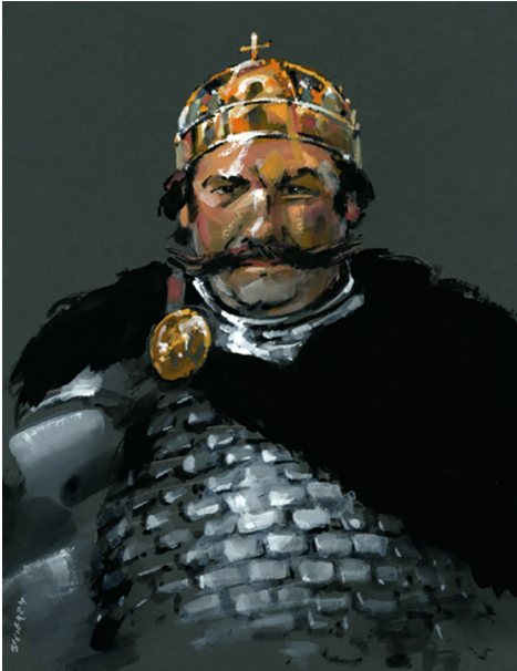
Bolesław Chrobry, autor: Waldemar Świerzy, copyright: Kreacja Pro.