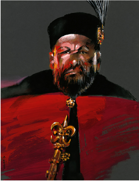
Stefan Batory, autor: Waldemar Świerzy