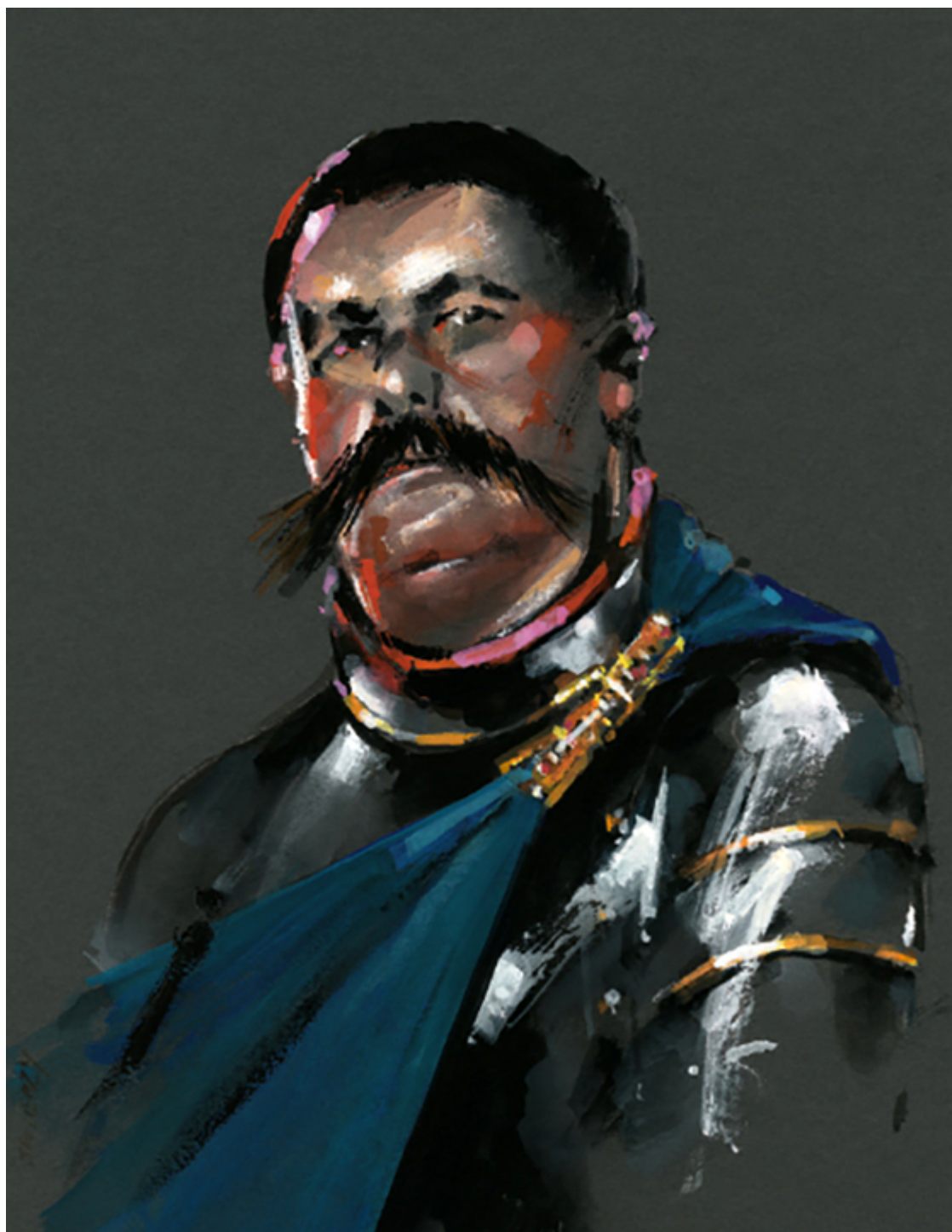
Jan III Sobieski, autor: Waldemar Świerzy