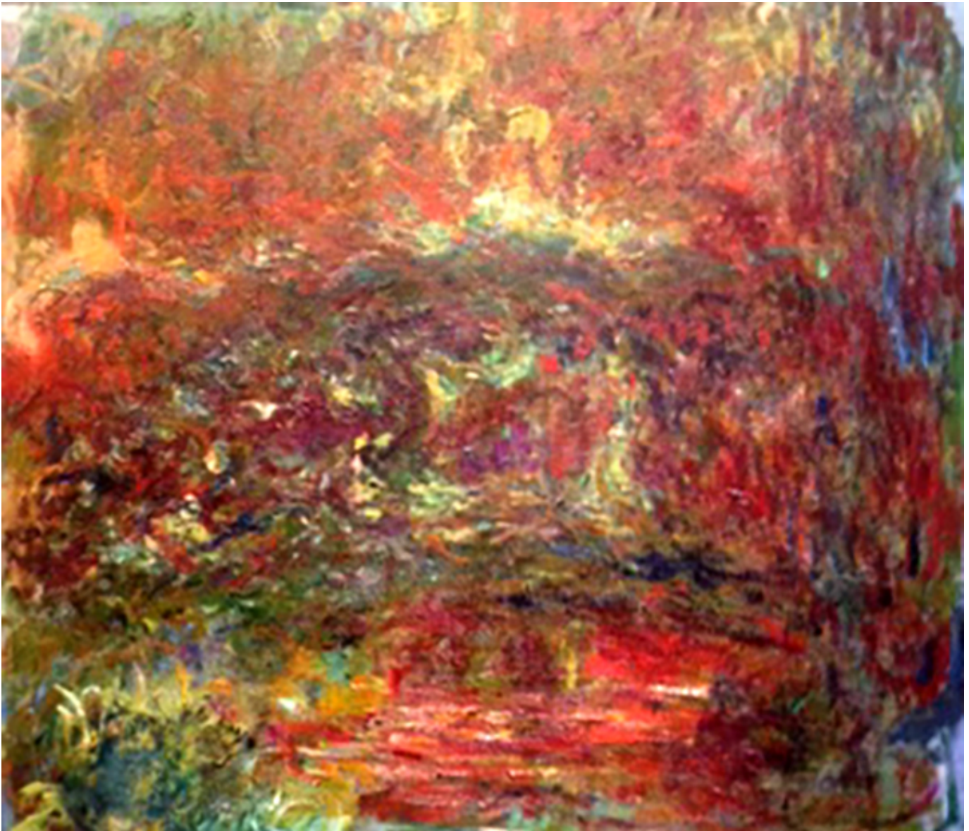
Claude Monet w wiedeńskim Albertina Museum

„Monet w Vetheuil 1878-1881” to czas kłopotów finansowych malarza, gdy musiał zamieszkać w małej miejscowości Vetheuil. Pracował bardzo dużo - utrwalił miasteczko, jego architekturę i pejzaże okolic. Malował wtedy dużymi pociągnięciami pędzla, grubo kładł farbę, co przywodzi na myśl styl Van Gogha.