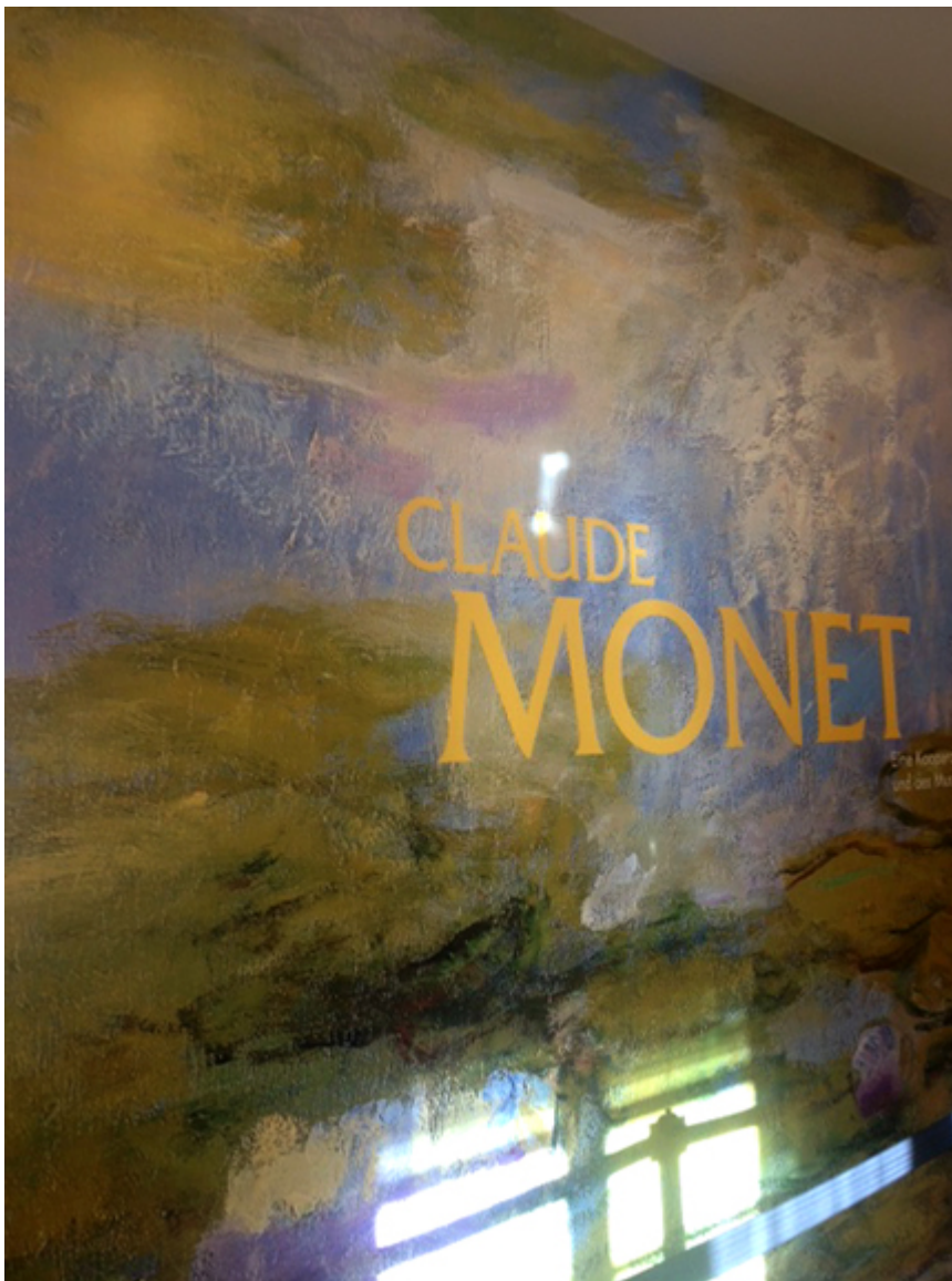
Claude Monet w wiedeńskim Albertina Museum, fot. Katarzyna Szrodt.

Wystawa w wiedeńskiej Albertinie pokazuje całe życie Claude'a Moneta poprzez jego obrazy. Z różnorodności tematów i technik układa się twórcza droga artysty, który wytrwale wprowadzał malarstwo na nową drogę postrzegania rzeczywistości i utrwalania jej na płótnie. Uchwycenie zjawisk natury: wschodu i zachodu słońca, słonecznego blasku mieszającego się z kolorami roślinności, ślizgającego się po fakturze sukni czy po murze katedry, ruch fal i odbicia na wodzie – chwile, momenty, impresje.