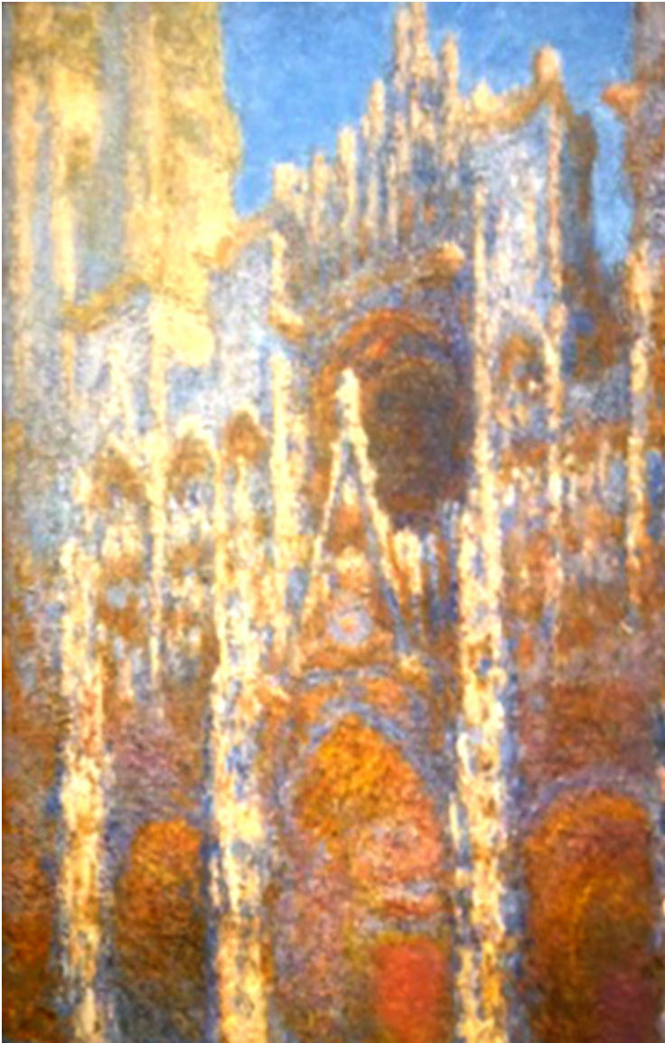
Claude Monet, Katedra w Rouen, 1894 r., Museum of Fine Arts w Bostonie

Tak samo jak słoneczne światło, artystę fascynuje mgła. Maluje katedrę Rouen, parlament londyński i Wenecję we mgle. Mieniący się odcieniami bieli obraz „Vetheuil we mgle” nie został zakupiony przez kolekcjonera, „gdyż zbyt mało było na nim widać”. Dziś wszystkie opowieści o trudnych losach malarzy impresjonistów brzmią jak anegdoty, gdy tymczasem zarówno Paul Cezanne, Auguste Renoir, Eduard Manet, Alfred Sisley, Frederic Bazille i Claude Monet doświadczyli odrzucenia, wzgardy i nierzadko biedy, starając się wprowadzić w malarstwie końca XIX wieku tematykę związaną z życiem codziennym, malowanie w plenerze, szkicowość, skrótową, nietypową kompozycję, paletę czystych, jasnych barw i kontrastowy światłocień. Faktura obrazu, sposób kładzenia farby stał się równie ważny jak temat- malarstwo poszukiwało nowych przestrzeni i impresjoniści