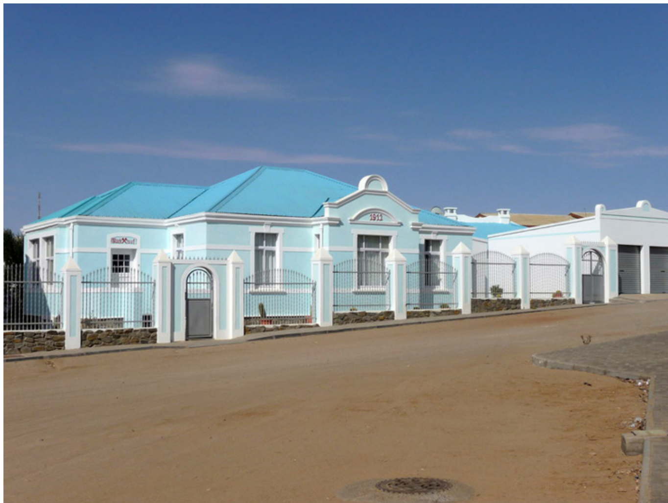
Zabytkowe domy w Luderlitz, fot. Wojciech Rogala.