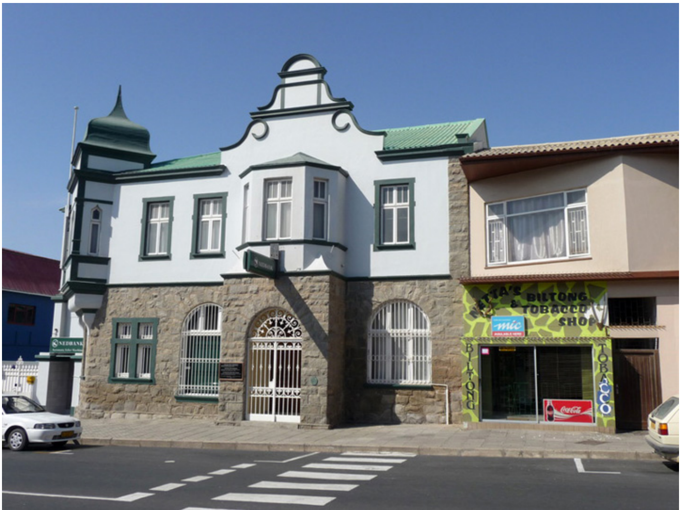
Lüderitz, małe Niemcy w Afryce, fot. W. Rogala.

Czułem się – pisze – jakbym stąpał po obcej planecie. Pustka obejmowała mnie zewsząd, byłem sam na sam z nicością. Nie chciałem wracać, pustynia mnie wciągała. Czułem wielki spokój, było mi tak dobrze. Nie ma nic i to jest piękne.