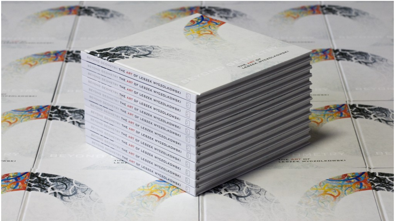
Album „The art of Leszek Wyczolkowski”