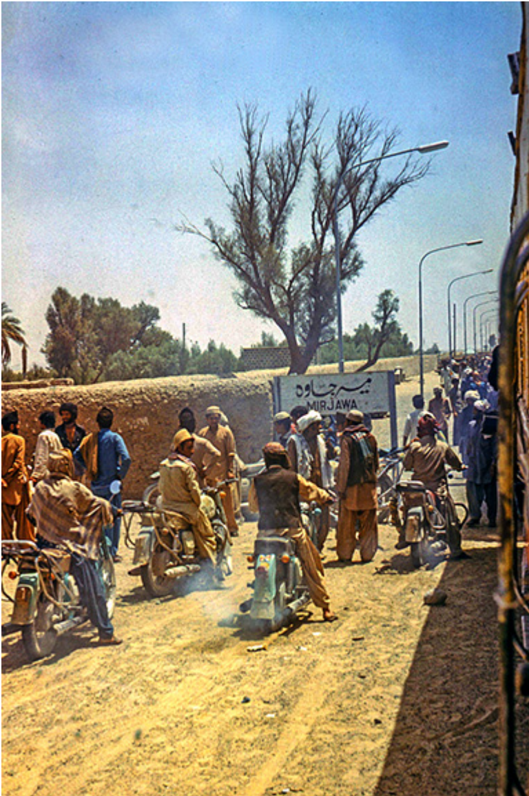
Bodyguards, Pakistan, Zahedan, Quetta, sierpień 1978 r.

[Redacted text block consisting of multiple horizontal black bars]