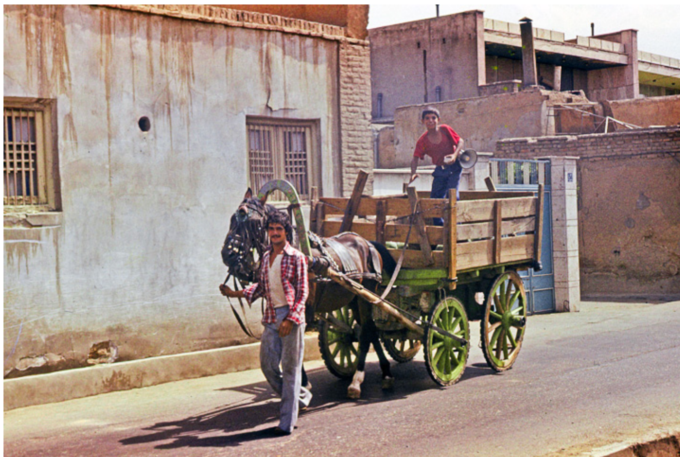
Iran, Teheran, sierpień 1978 r.