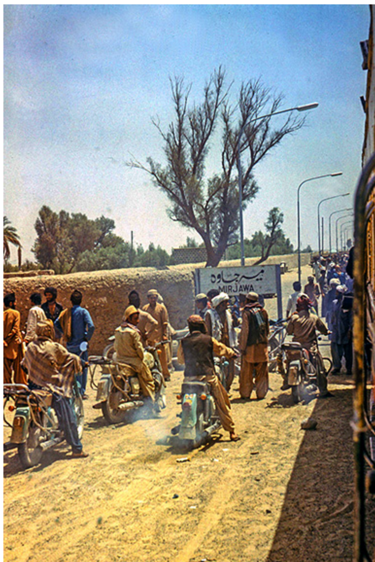
Bodyguards, Pakistan, Zahedan, Quetta, sierpień 1978 r.