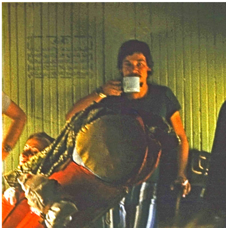
Iran, Zahedan, sierpień 1978 r.