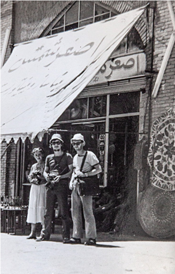
Iran, Isfahan, sierpień 1978 r.