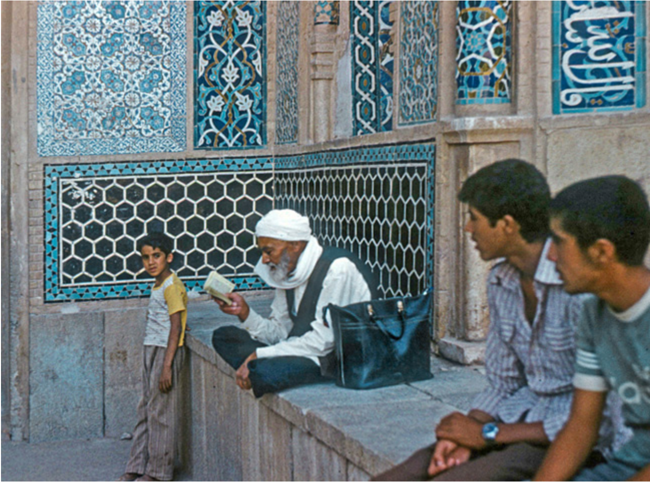
Iran, Isfahan, sierpień 1978 r.