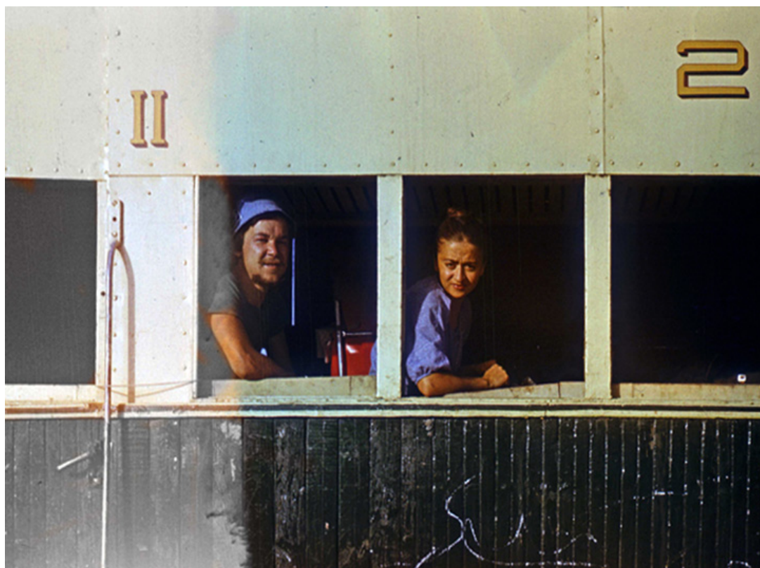
Pociąg przemytników, Iran, Zahedan, sierpień 1978 r.