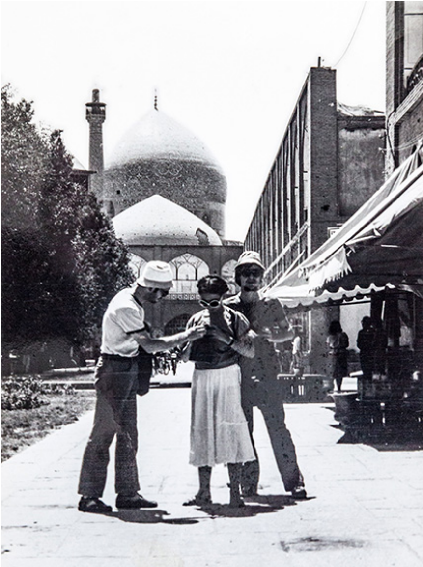
Iran, Isfahan, sierpień 1978 r.