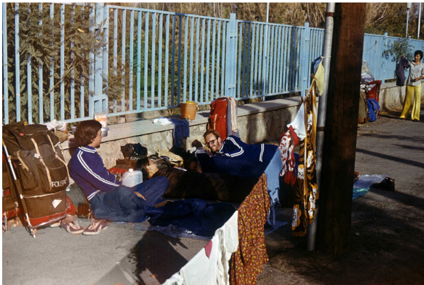
Łódzcy studenci z klubu „W Siną Dal” na wyprawie do Iranu, Zahedan, sierpień 1978 r.