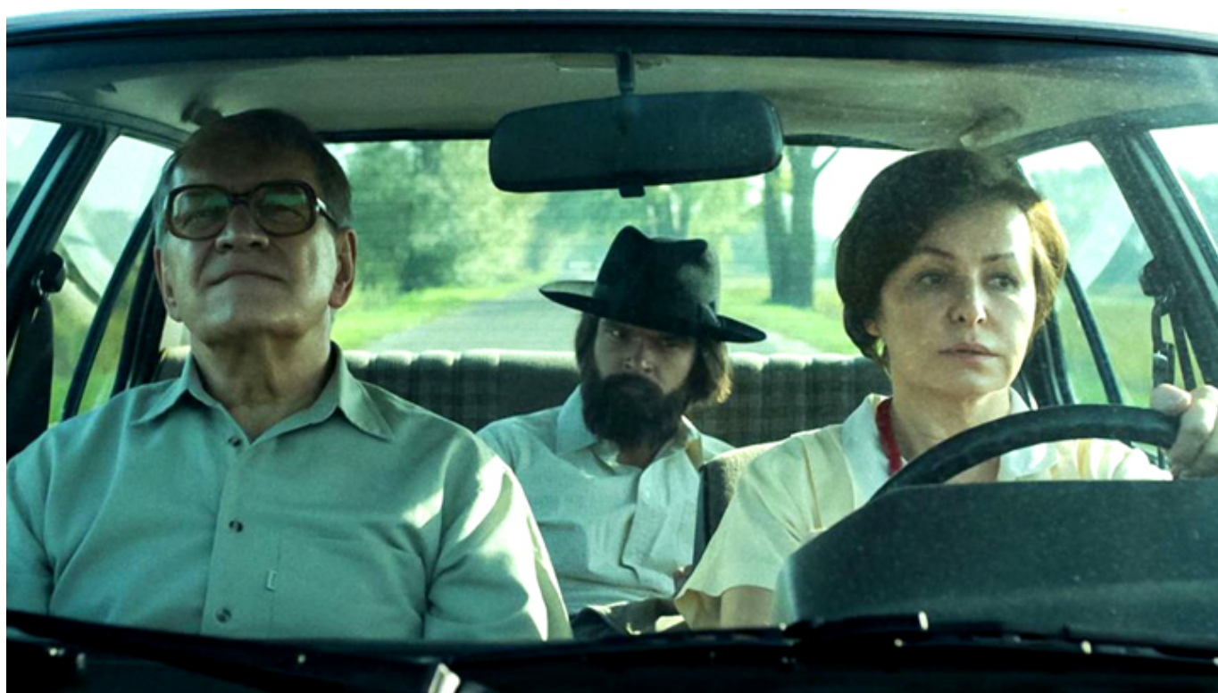
Kadr z filmu „Ostatnia rodzina”.