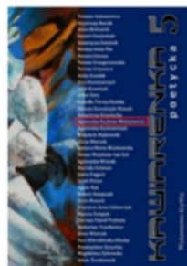
Kawiarenka Poetycka 5 Agnieszka Kuchnia - Wołosiewicz