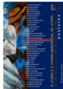
Kawiarenka Poetycka 5 Agnieszka Kuchnia - Wołosiewicz