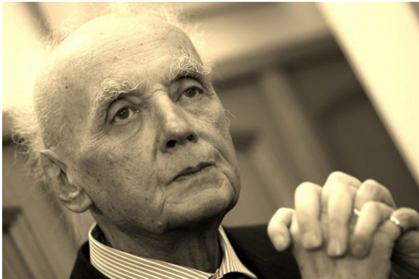
Wojciech Kilar, fot. Andrzej Grygiel, PAP.