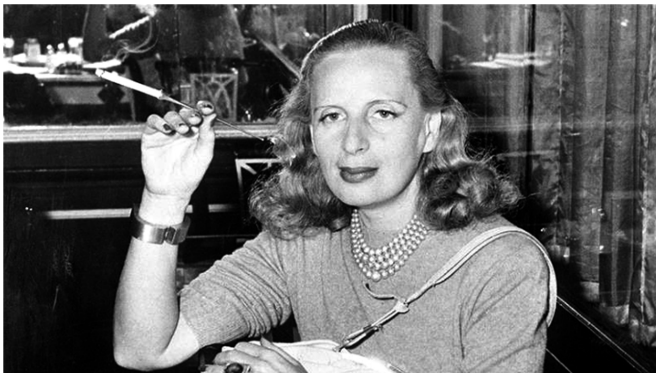
Tamara Łempicka