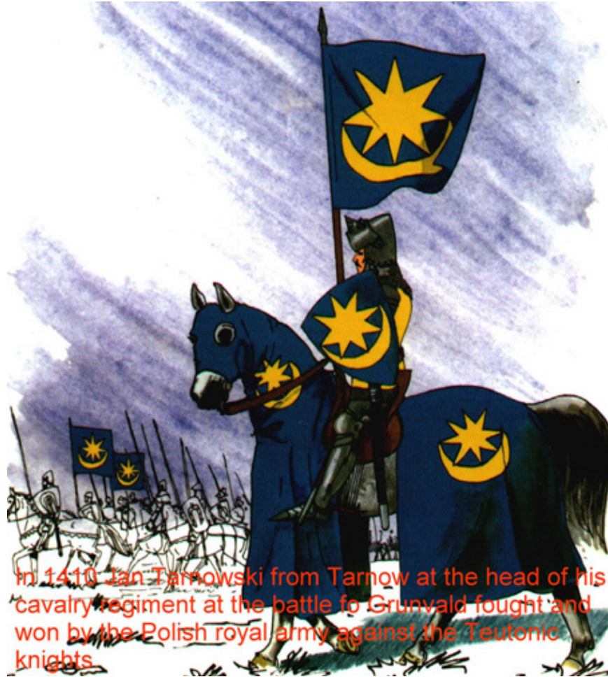
Chorągwie Jana i Spytka Tarnowskich pod Grundwaldem w 1410 r.