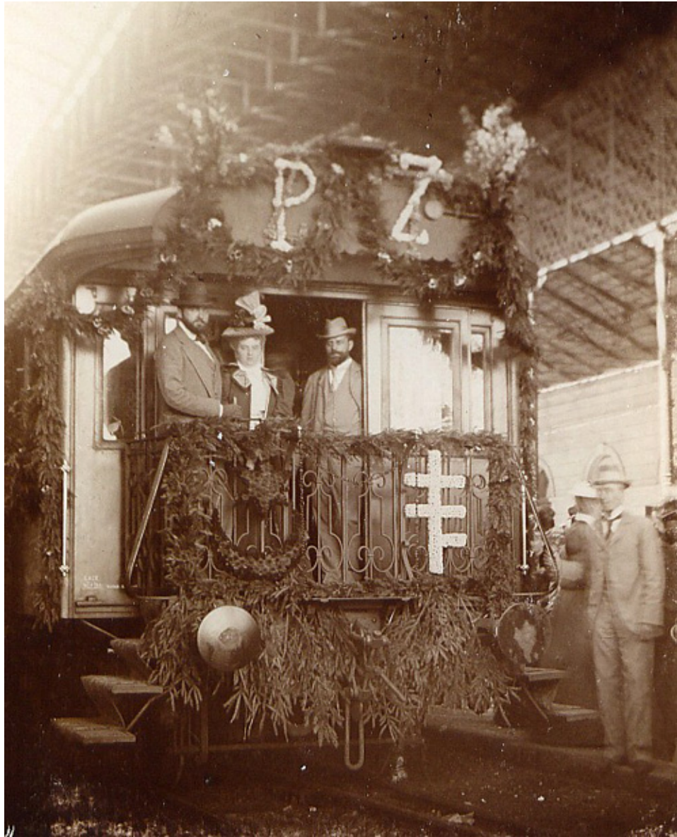
Wjazd pociągiem do Dzikowa, fot. arch. Marcina Tarnowskiego.

Za czasów Zdzisława Tarnowskiego i jego żony Zofii z Potockich (rodziców Artura hr Tarnowskiego) cenne zbiory dzikowskie, nadal się powiększały.