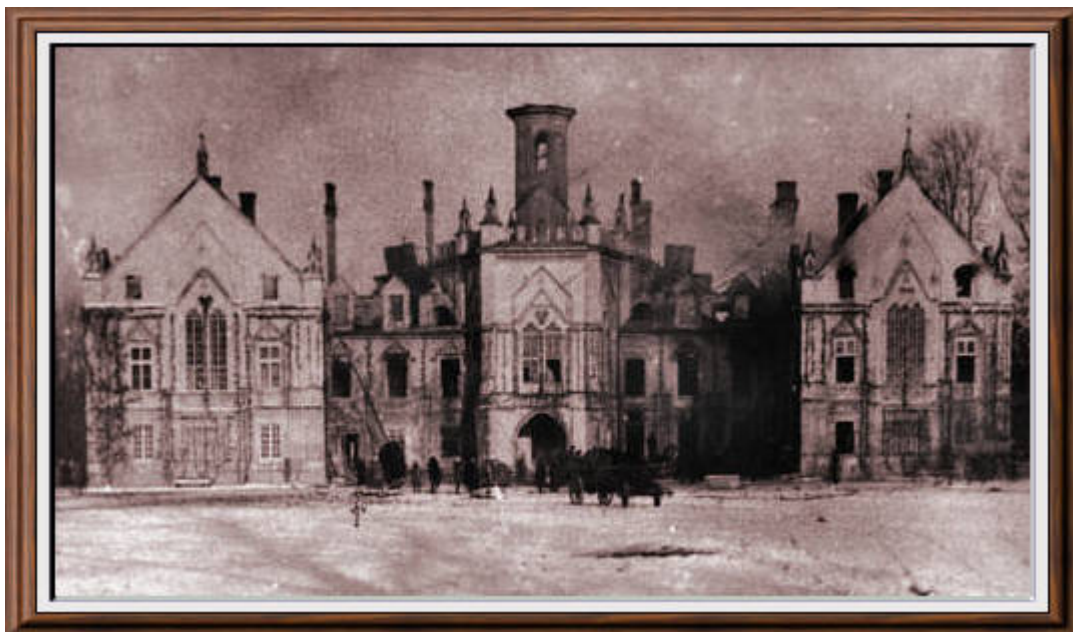
Rezydencja Tarnowskich w Dzikowie. Zamek w 1927 r. po wybuchu pożaru.