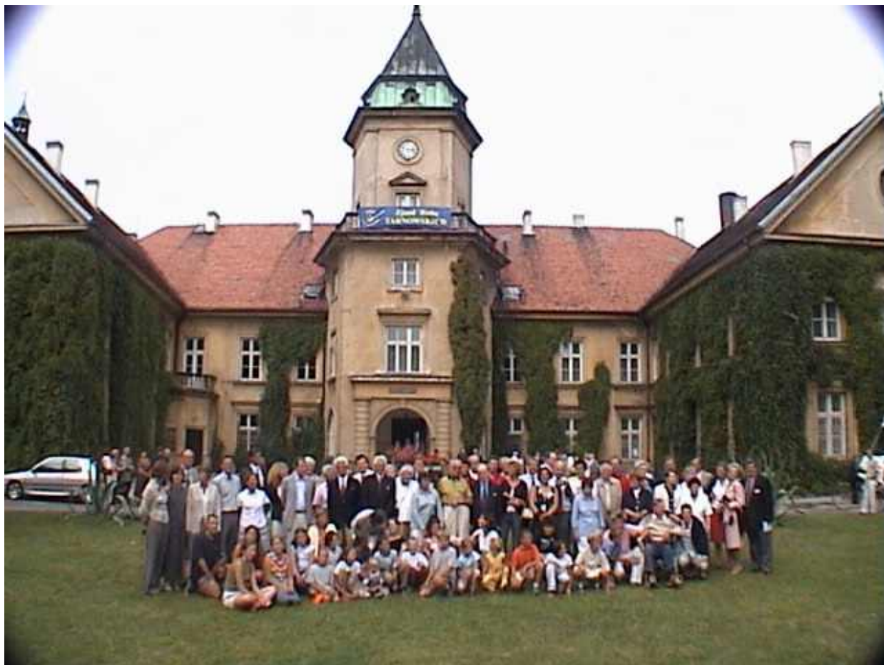
Zjazd rodu Tarnowskich w Dzikowie w 2003 roku.