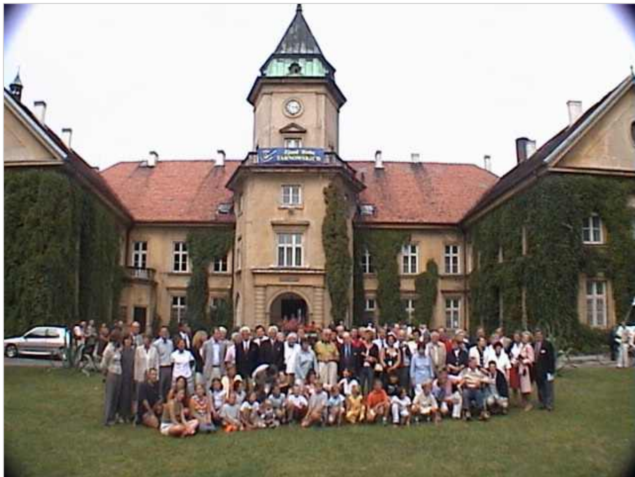
Zjazd rodu Tarnowskich w Dzikowie w 2003 roku.