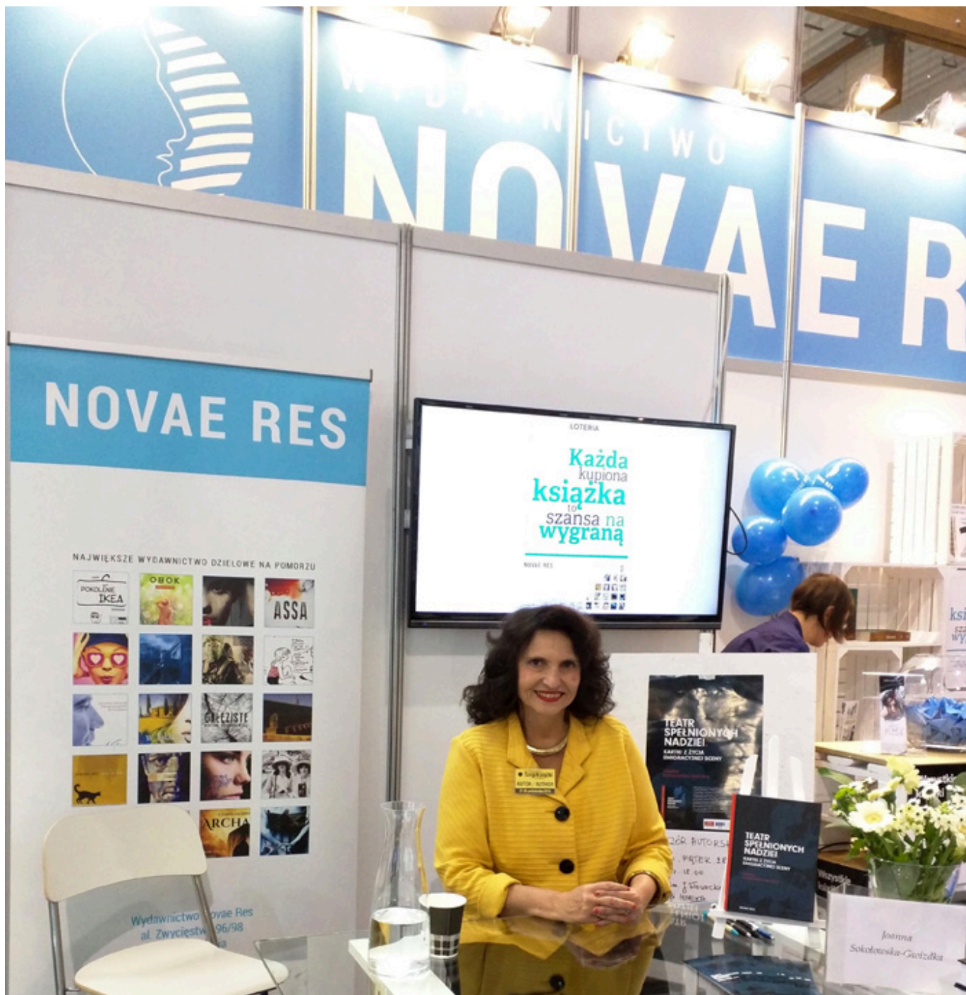
Podpisywanie książki na stoisku wydawnictwa Novae Res