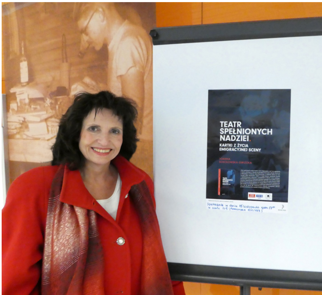
Na Wydziale Filologicznym Uniwersytetu Łódzkiego. Plakaty wisiały w głównym holu.