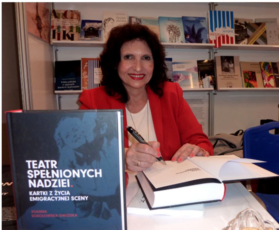
Na stoisku Związku Pisarzy Polskich na Obczyźnie z Londynu