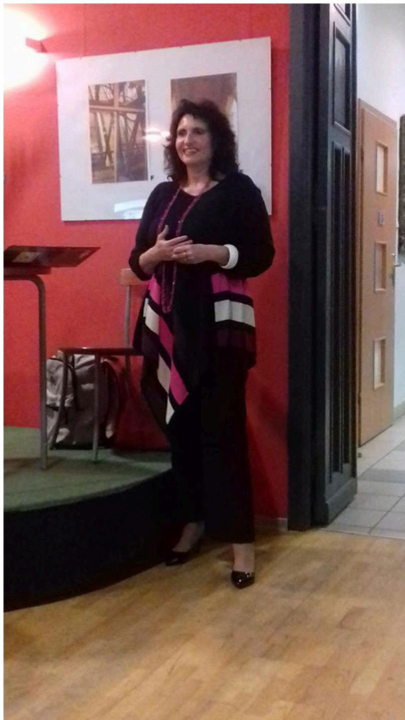
Miejska Biblioteka Publiczna w Łąncucie