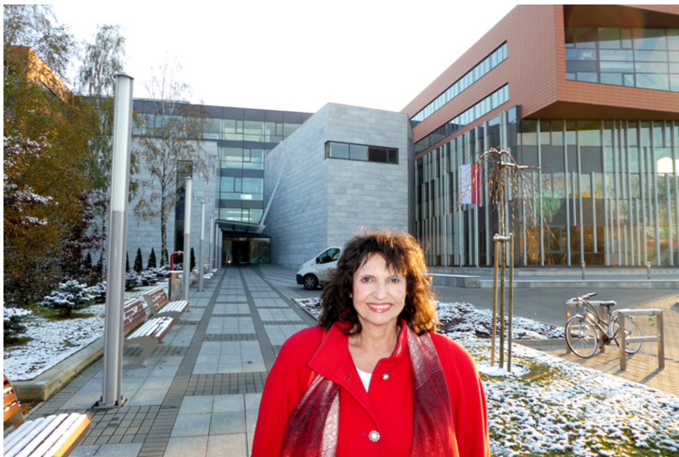
Przed wejściem na Wydział Filologiczny Uniwersytetu Łódzkiego, gdzie miała miejsce prelekcja.