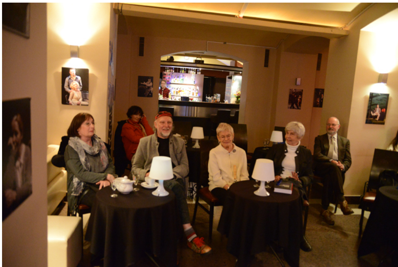
Stowarzyszenie Pisarzy Polskich w Krakowie