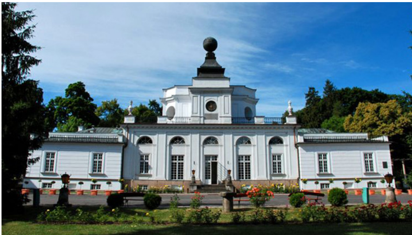
Pałac w Jabłonie