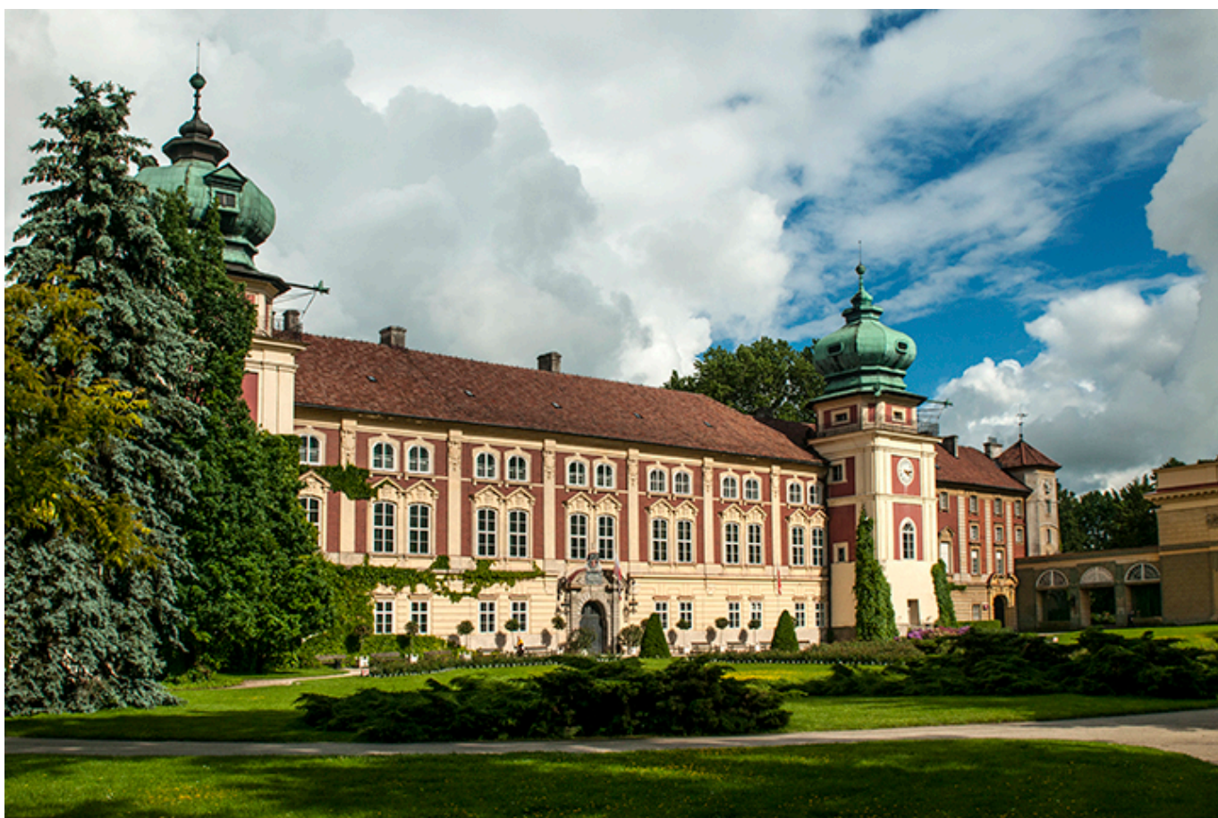
Zamek w Łańcutcie

Bujne życie towarzyskie Łańcuta, urozmaicone przedstawieniami teatralnymi i imprezami muzycznymi, prawie zupełnie zanikło po 1830 roku, w związku z żałobą narodową i represjami po upadku powstania listopadowego. Nastąpił też gwałtowny spadek zakupów dla Biblioteki Zamkowej, a w Inwentarzach nie widnieją wydatki związane z utrzymywaniem muzyków, czy organizacją przedstawień.