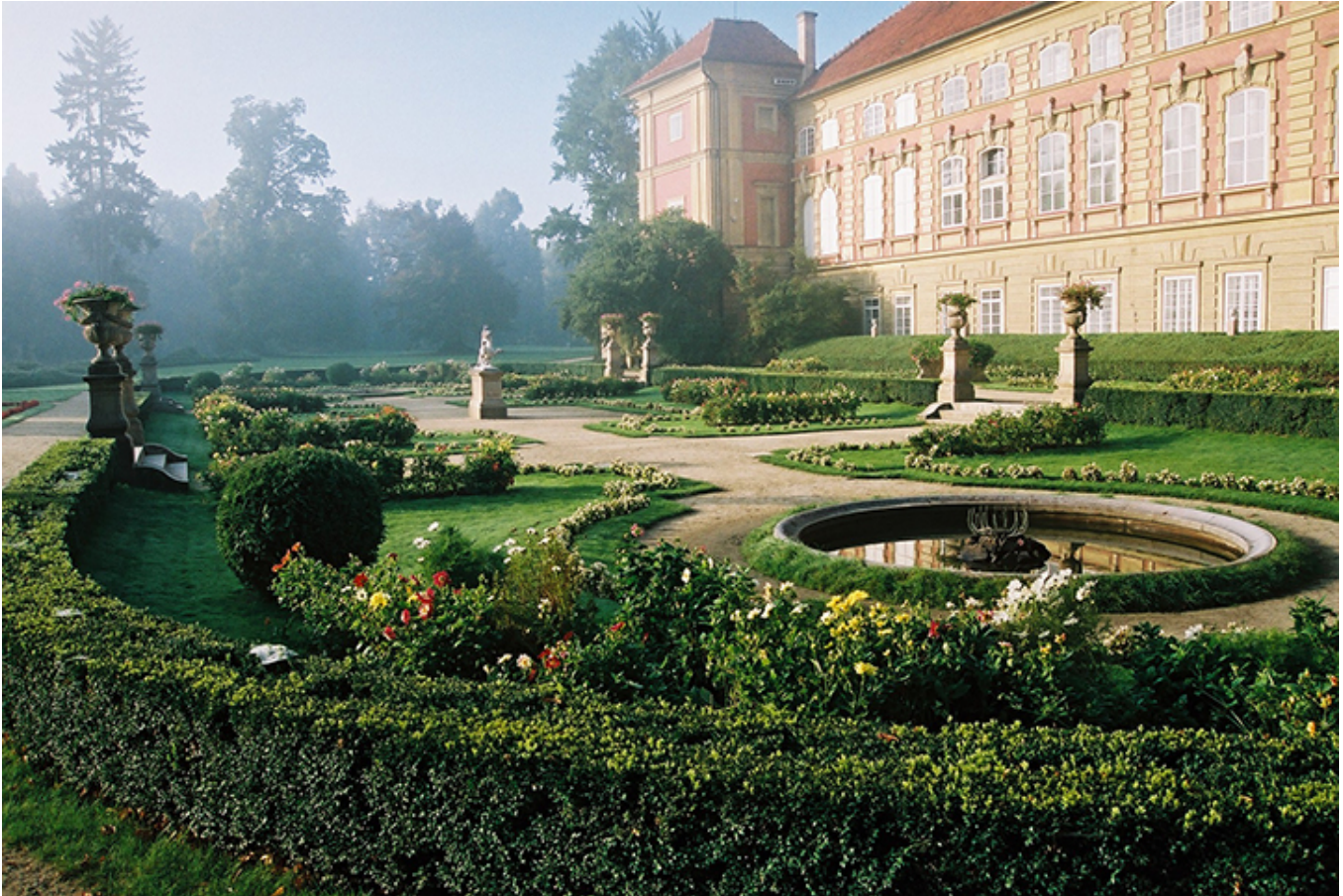
Zamek w Łańcucie

Staraniem Alfreda Potockiego w 1830 roku powstała ordynacja łańcucka, z zasadą niepodzielności, niezbywalności i nieobciążalności dóbr. Ich dziedzicem mógł być wyłącznie najstarszy syn ordynata. W przypadku wygaśnięcia rodu połowa majątku miała być przeznaczona na wsparcie uczącej się młodzieży, a druga dla wojskowych w stanie spoczynku. Alfred Potocki – pierwszy ordynat Łańcuta, zajął się odtąd głównie gospodarowaniem w ogromnym majątku. Stał się jednym z pionierów nowoczesnego rolnictwa galicyjskiego. Sprowadzał maszyny rolnicze, niektóre sam projektował. W Łańcucie miał gorzelnie, młyny, browar, rafinerię spirytusu, garbarnie itd.