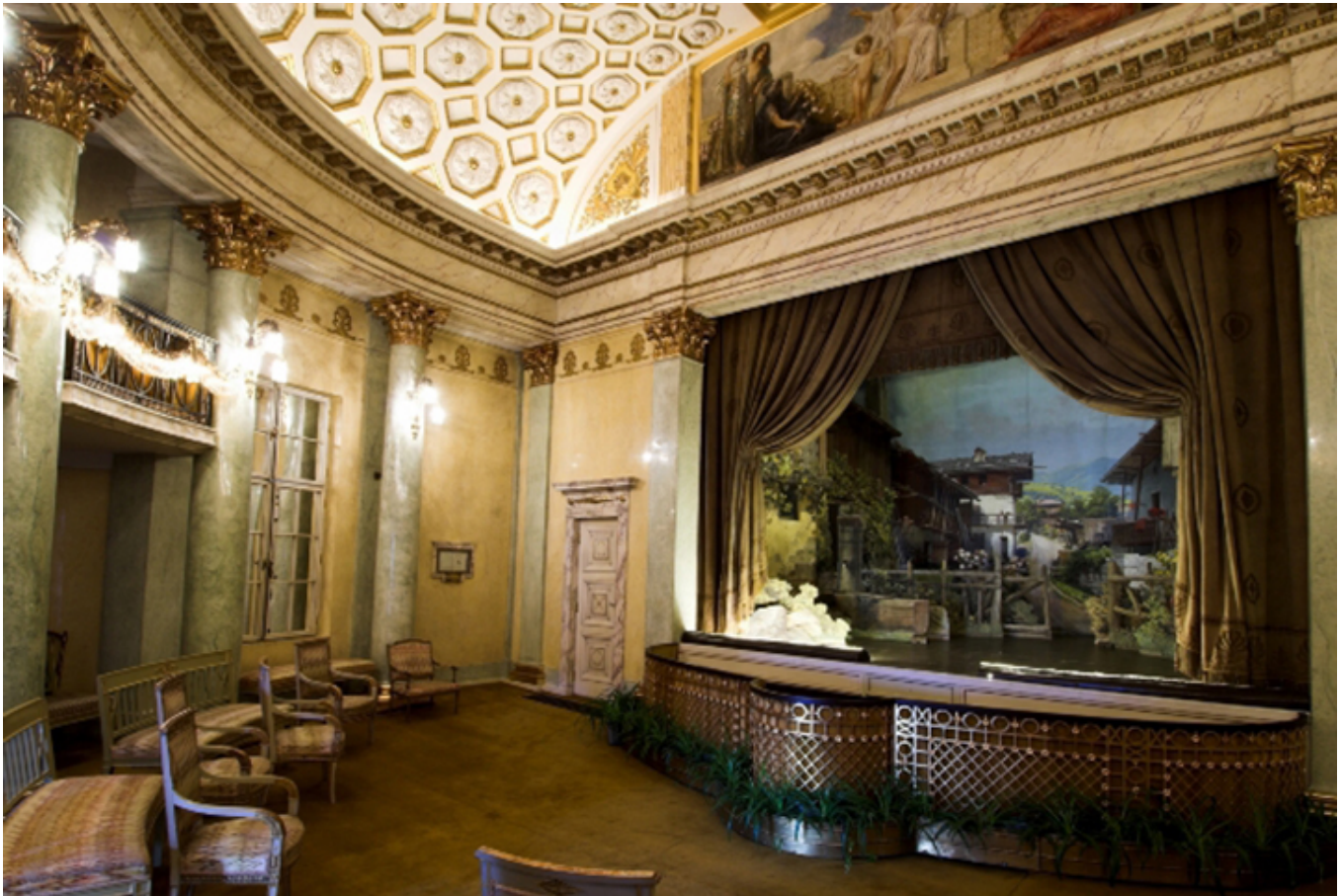
Teatr zamkowy w Łańcucie. Dokracja sceny zamknięta prospektem