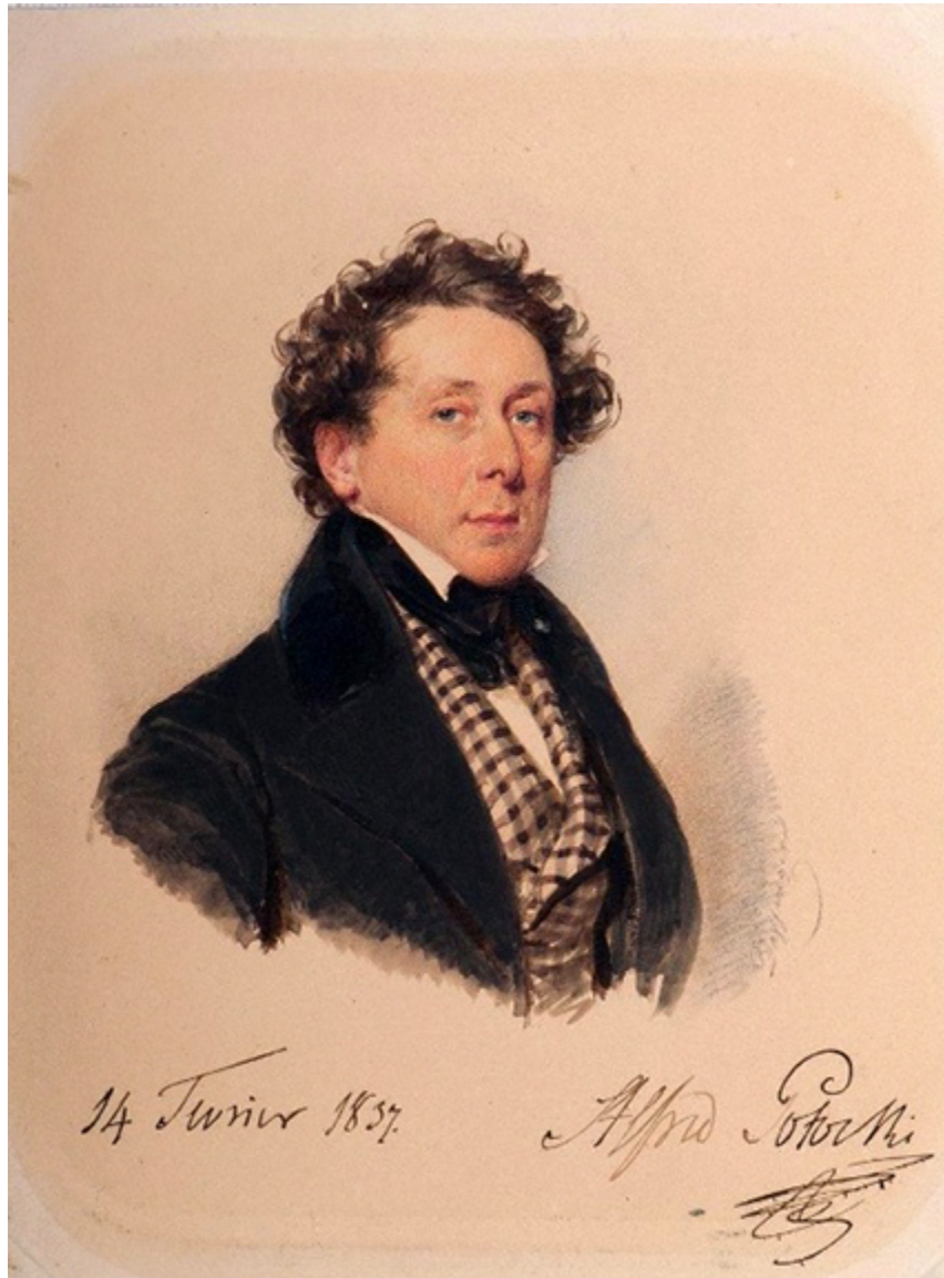
Alfred Potocki (1786-1862), pierwszy ordynat łańcucki, minatura Moritza Michaela Daffingera, zbiory Muzeum Albertina w Wiedniu.