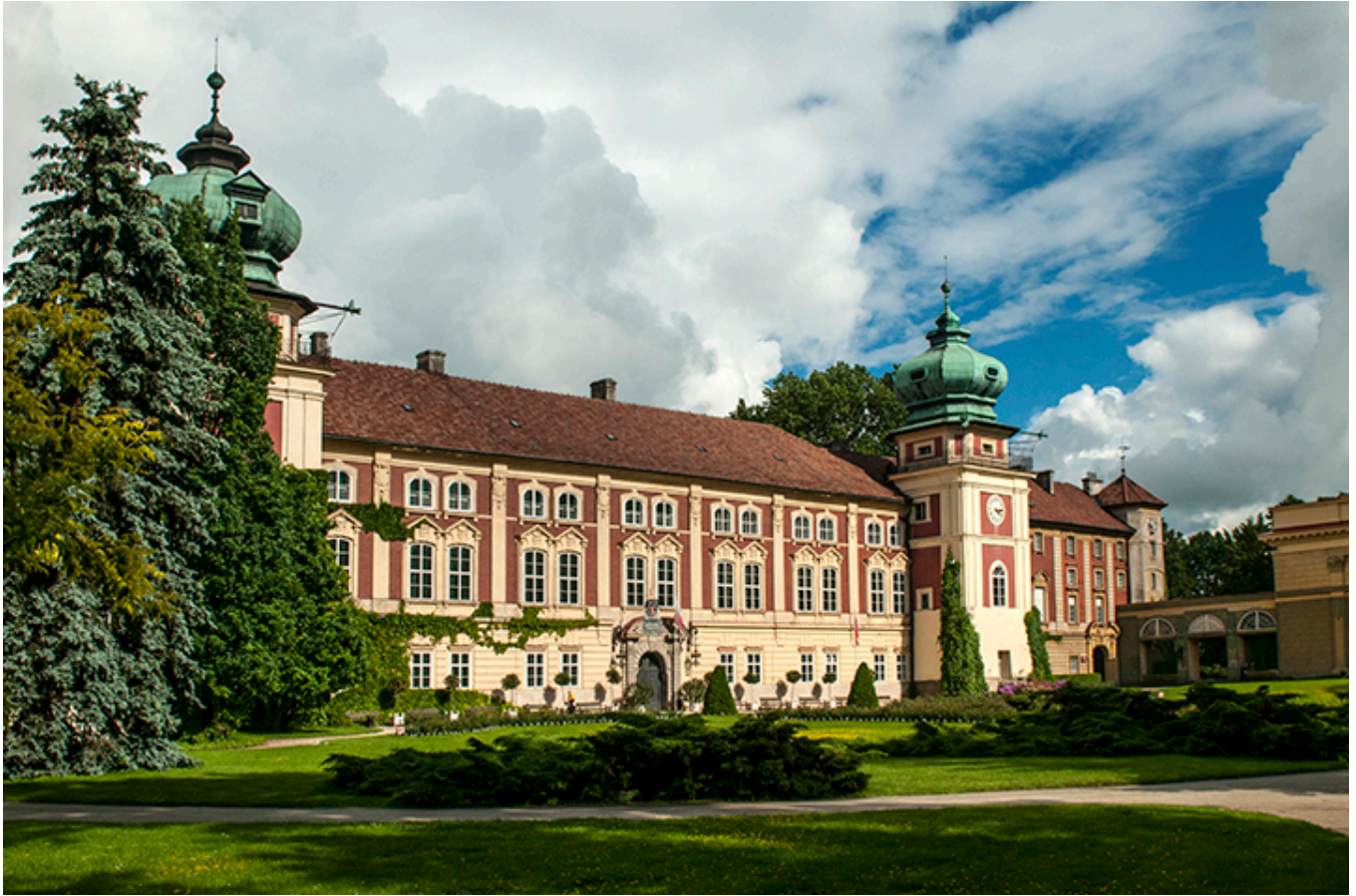
Zamek w Łańcutie