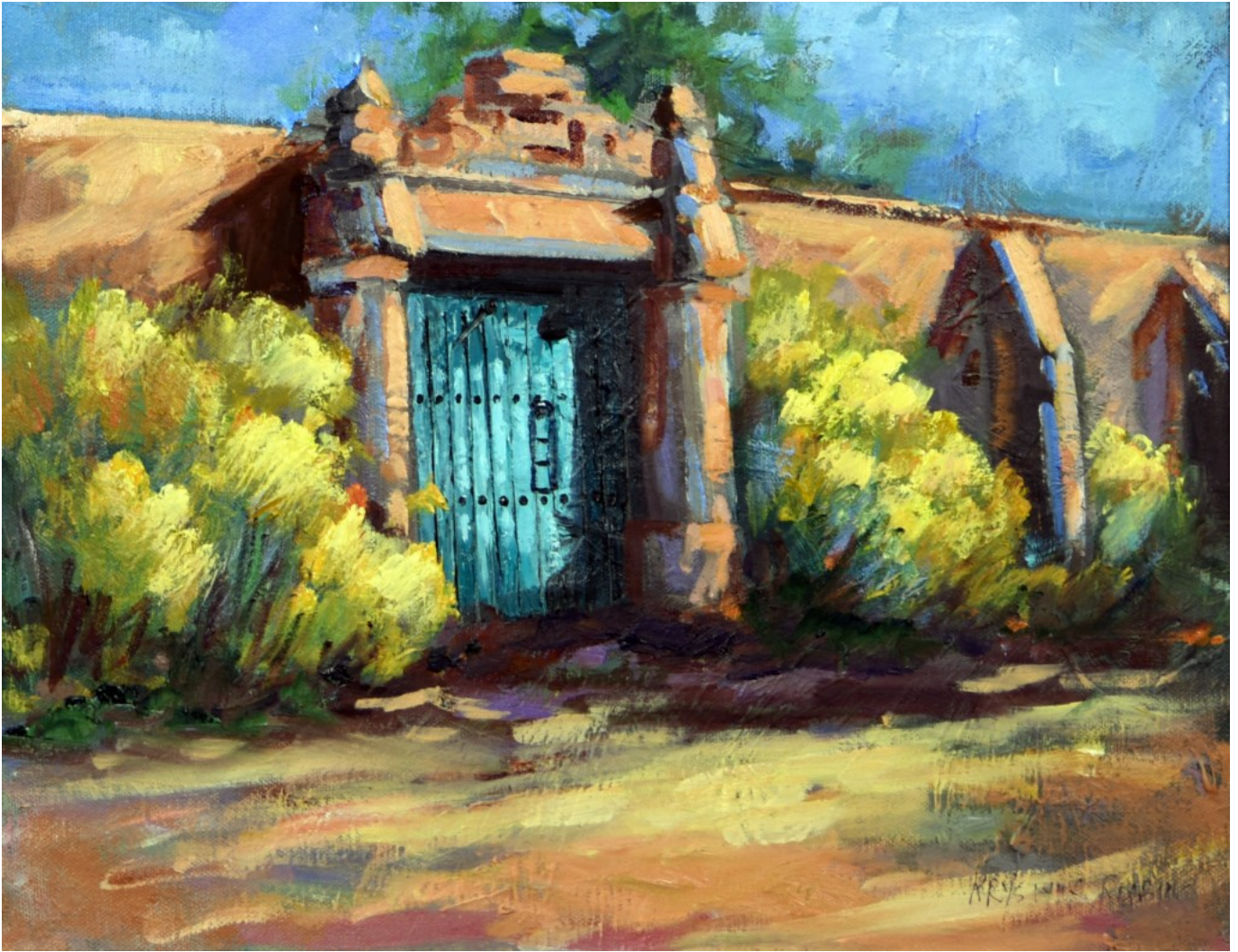
Up Canyon Road