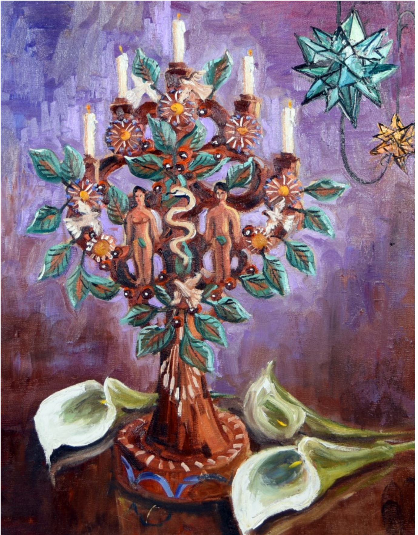
Tree of Life