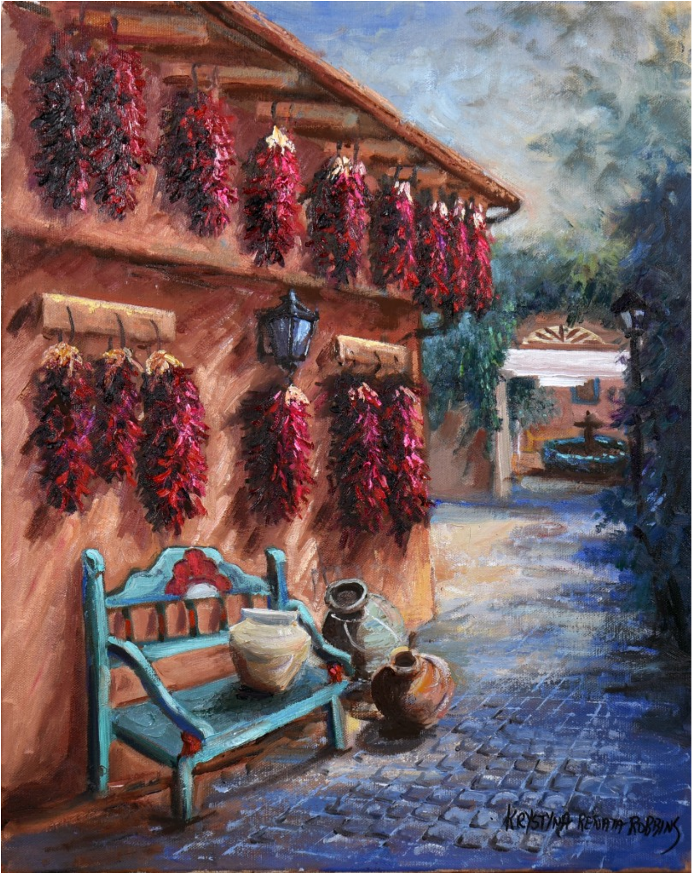
Old Town Chiles-Stare Miasto w Chiles