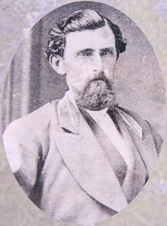
Sam Ealy Johnson Sr.