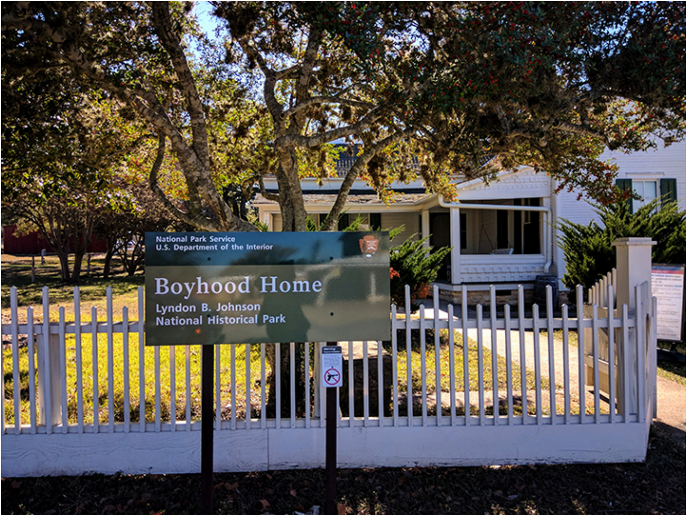
Dom Johnsonów w Johnson City