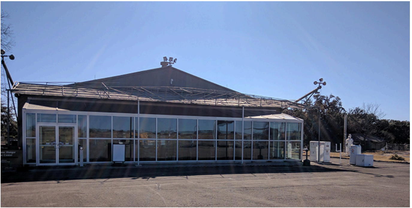
Miejsce garażowania samochodów Lady Bird Johnson