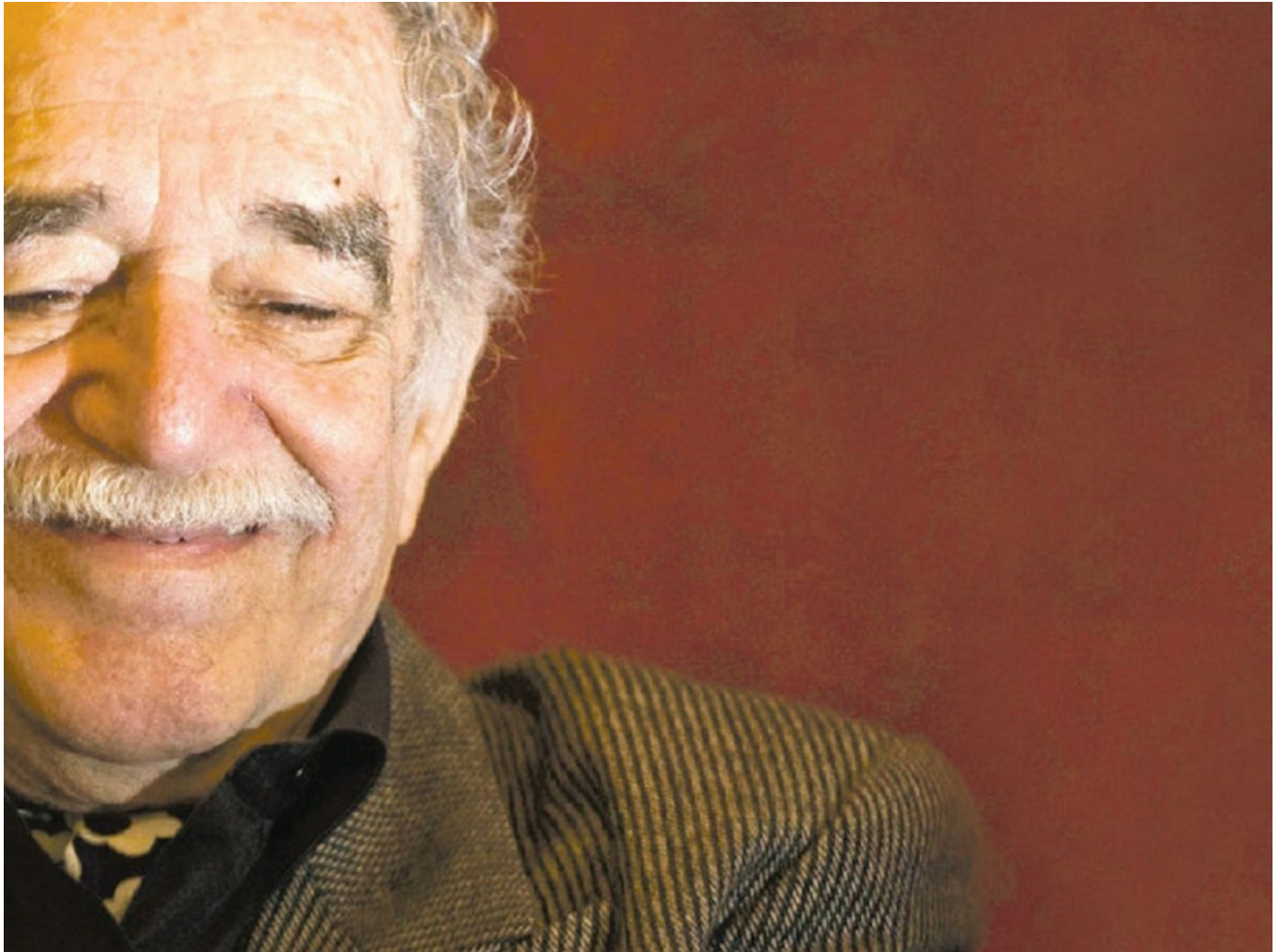
Gabriel García Márquez.