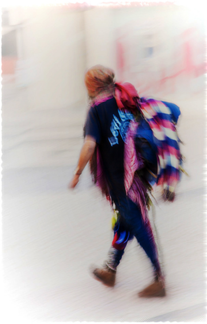
Portugalia 2019 r.