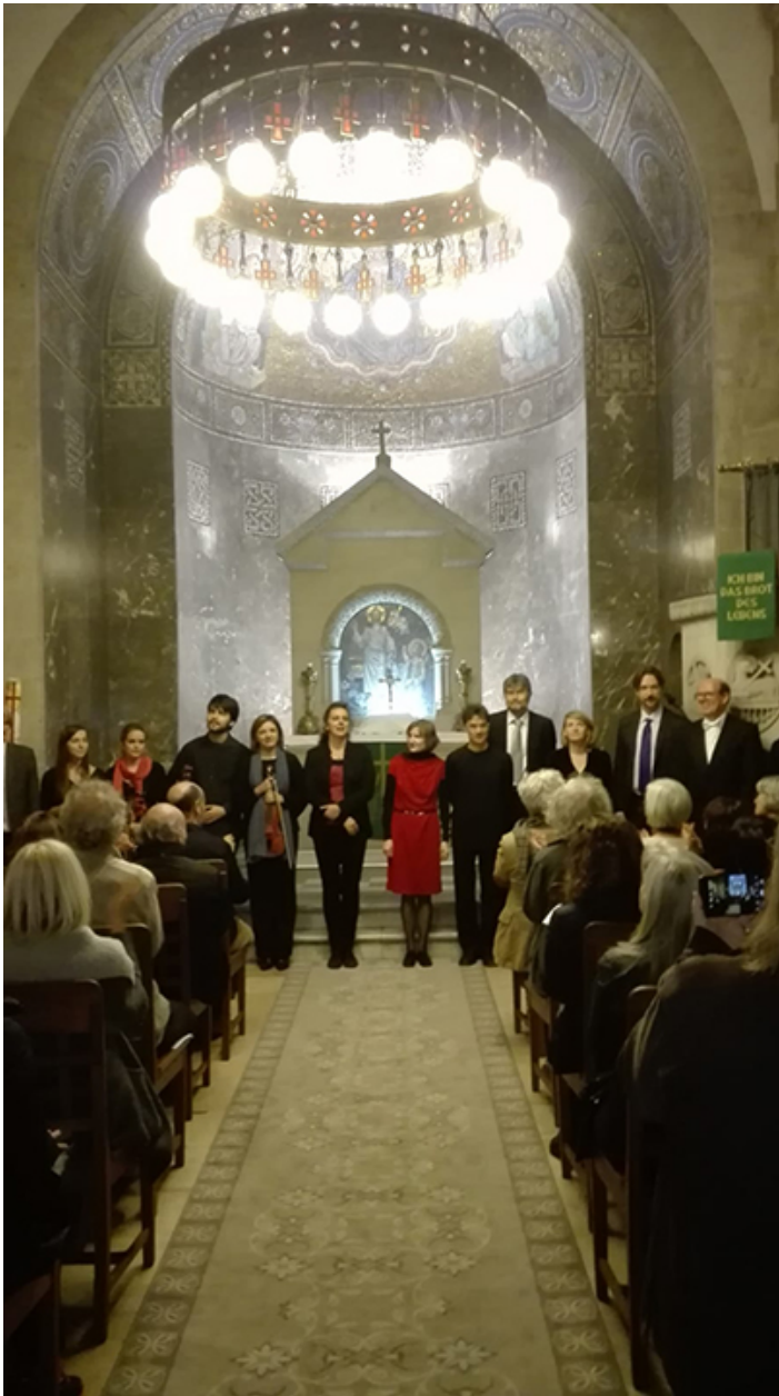
Wykonanie kantaty upamiętniającej 500-lecie Reformy Luterańskiej, skomponowanej na zamówienie Parafii Ewangelickiej w Madrycie.