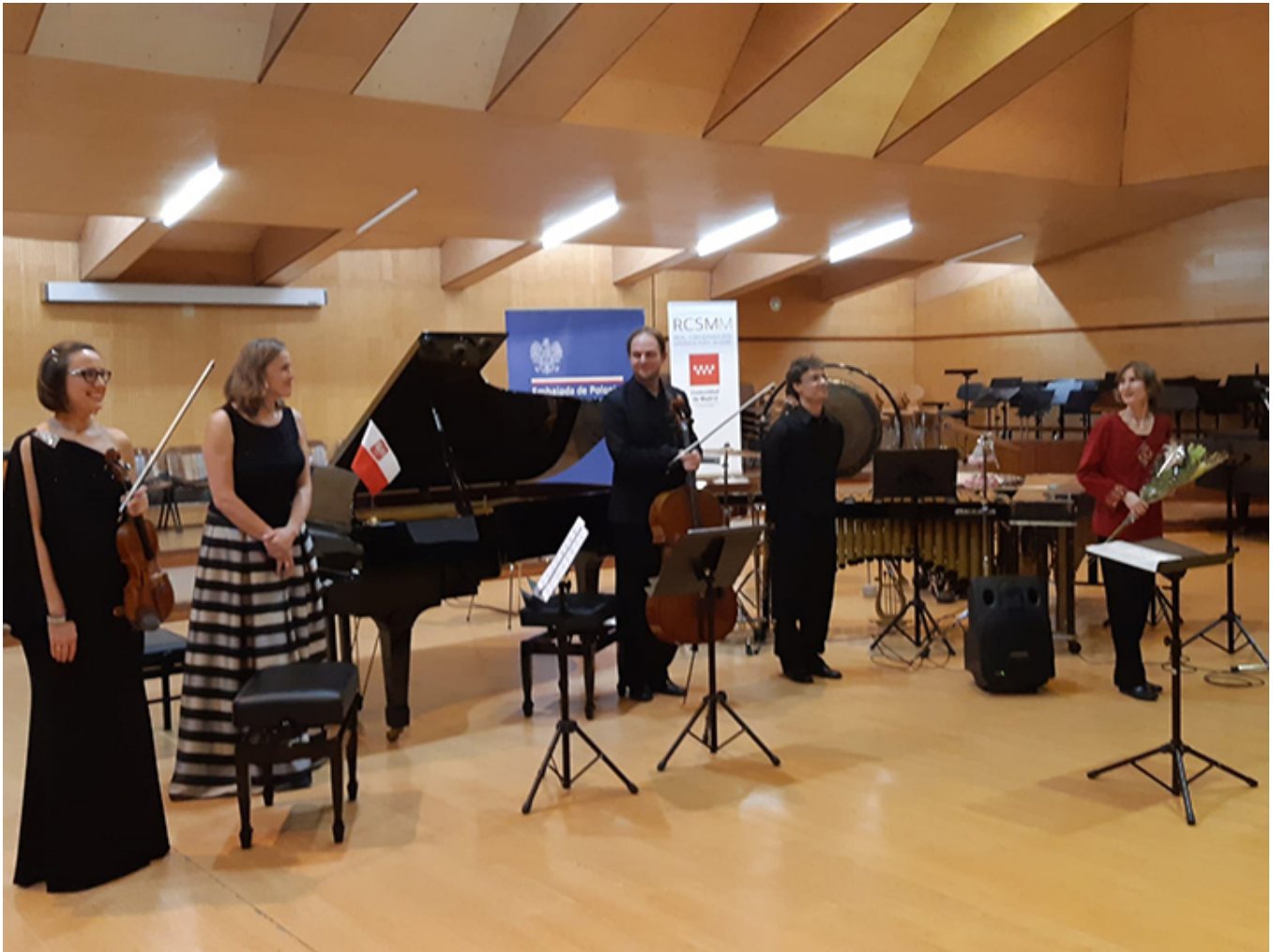
Koncert z okazji 100-lecia odzyskania przez Polskę niepodległości w Madrycie.