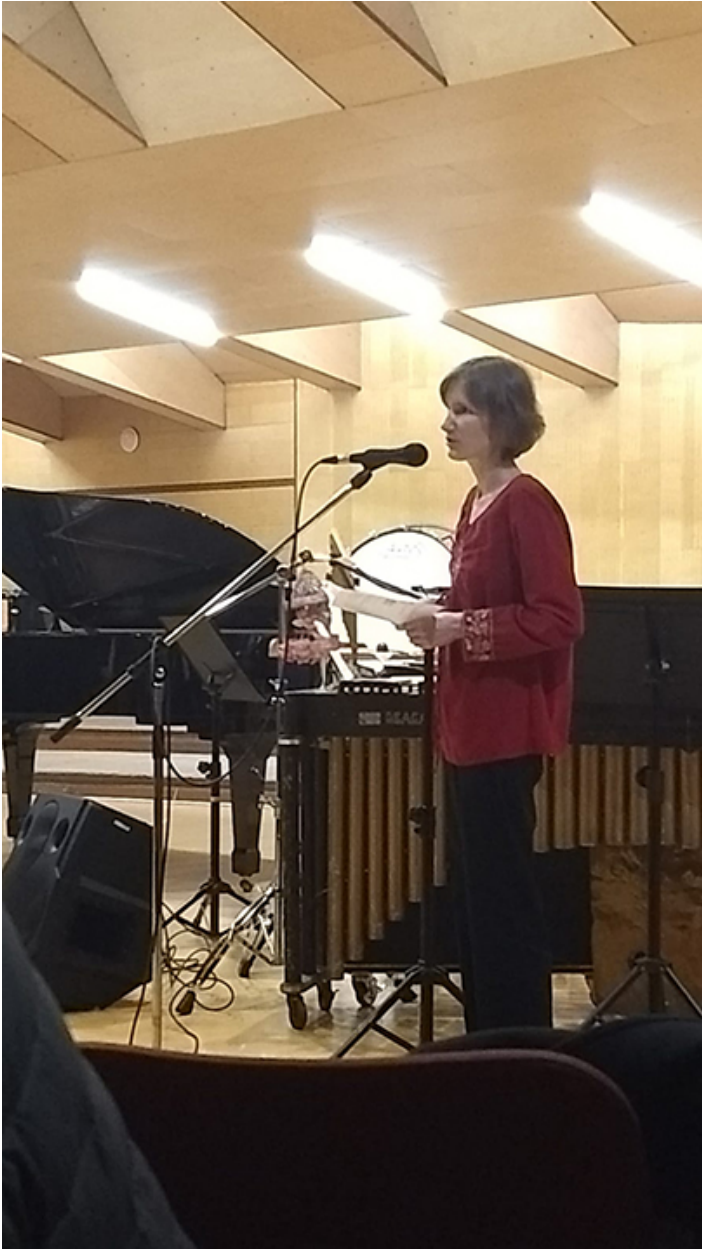
Koncert z okazji 100-lecia odzyskania przez Polskę niepodległości w Madrycie.

Ostatnim sukcesem kompozytorki był udział w finale I Concurso Internacional de Composición "María de Pablos" w Segowii, gdzie została laureatką I nagrody ex aequo oraz nagrody publiczności za utwór „Noche oscura” ( Noc ciemna ) na mezzosopran i wiolonczelę.