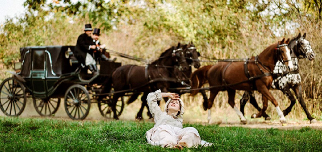
„Nędzary i Madame”, reż. Witold Ludwig