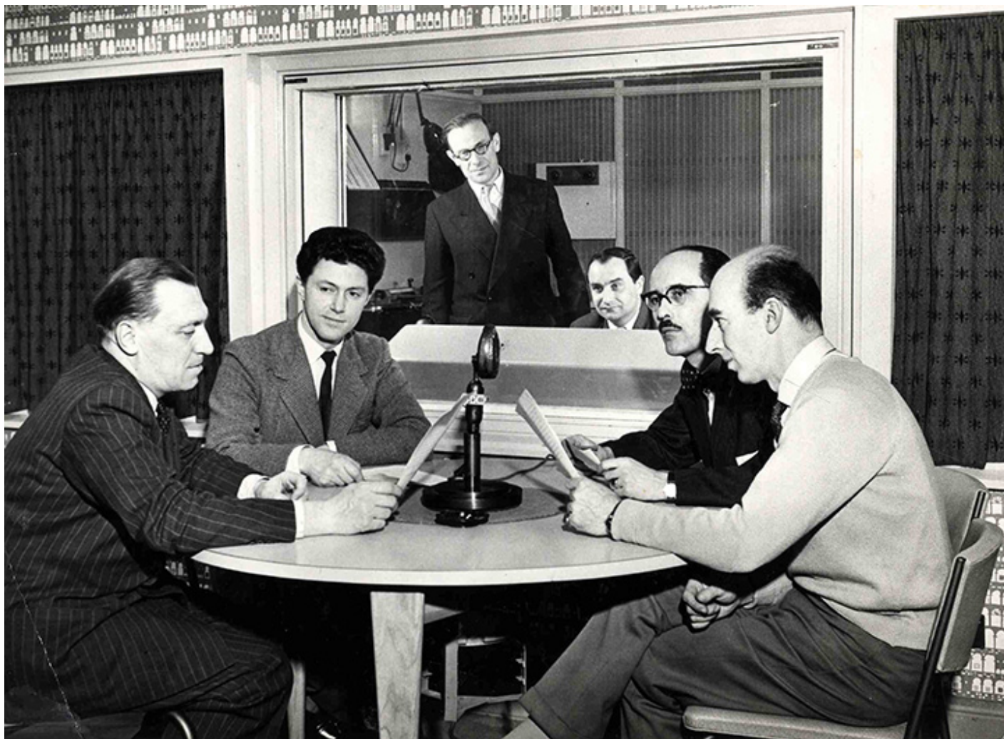
Bolesław Taborski (drugi z lewej) z kolegami w Polskiej Sekcji Radia BBC

Był człowiekiem nadzwyczaj pracowitym – po godzinach pracy radiowej w Polskiej Sekcji BBC siadał do biurka i słuchając klasycznej muzyki pisał przez większość nocy. Pisał przez całe życie, dopóki nie powaliła go śmiertelna choroba. Zostawił po sobie bogatą spuściznę literacką – 25 tomików poezji, książki o teatrze, o Powstaniu Warszawskim, setki przekładów, artykułów i rozpraw. Był też wykładowcą akademickim na uniwersytetach polskich, amerykańskich i na Polskim Uniwersytecie na Obczyźnie PUNO, w Londynie, od którego otrzymał doktorat