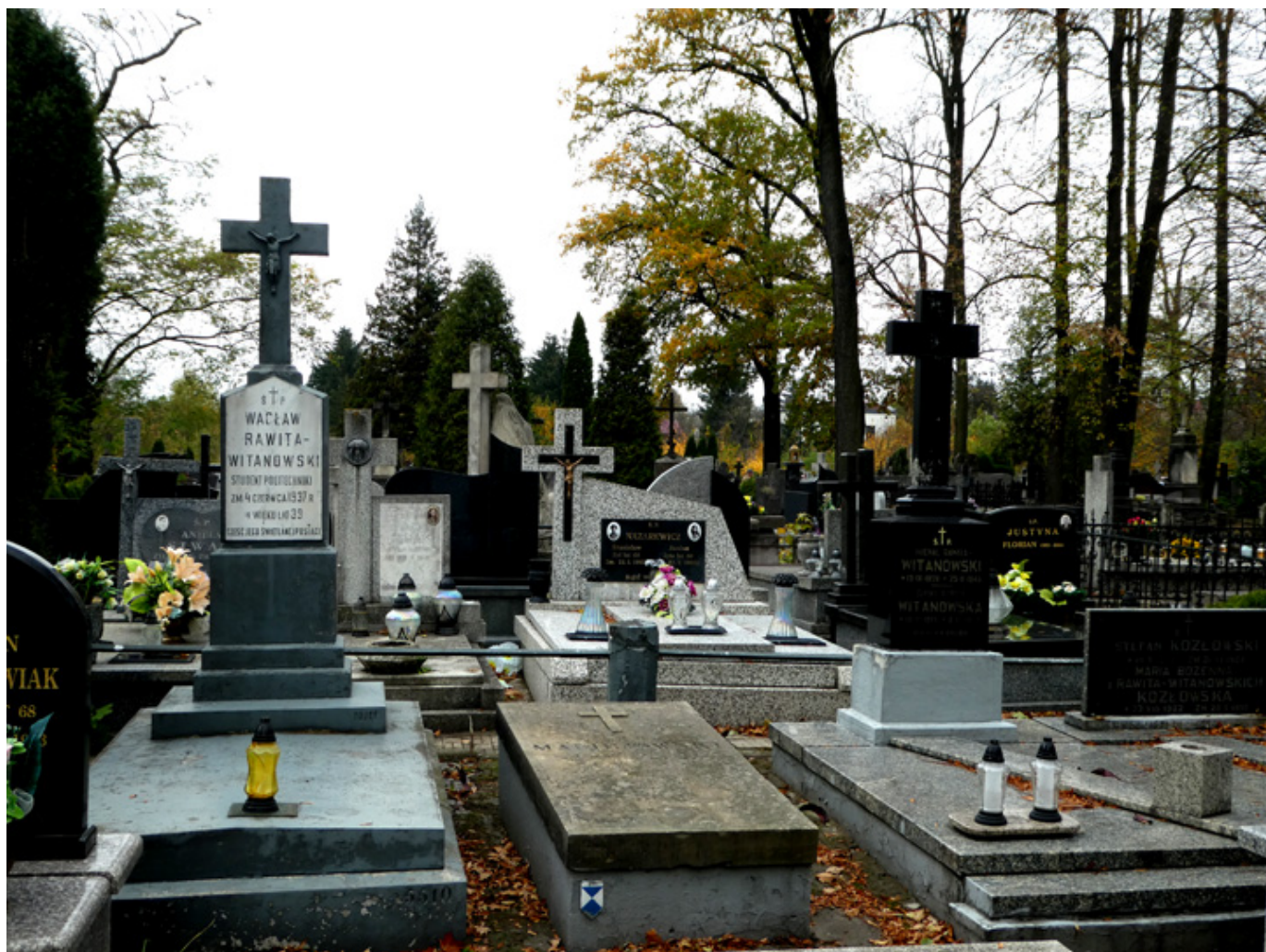
Groby rodziny Witanowskich