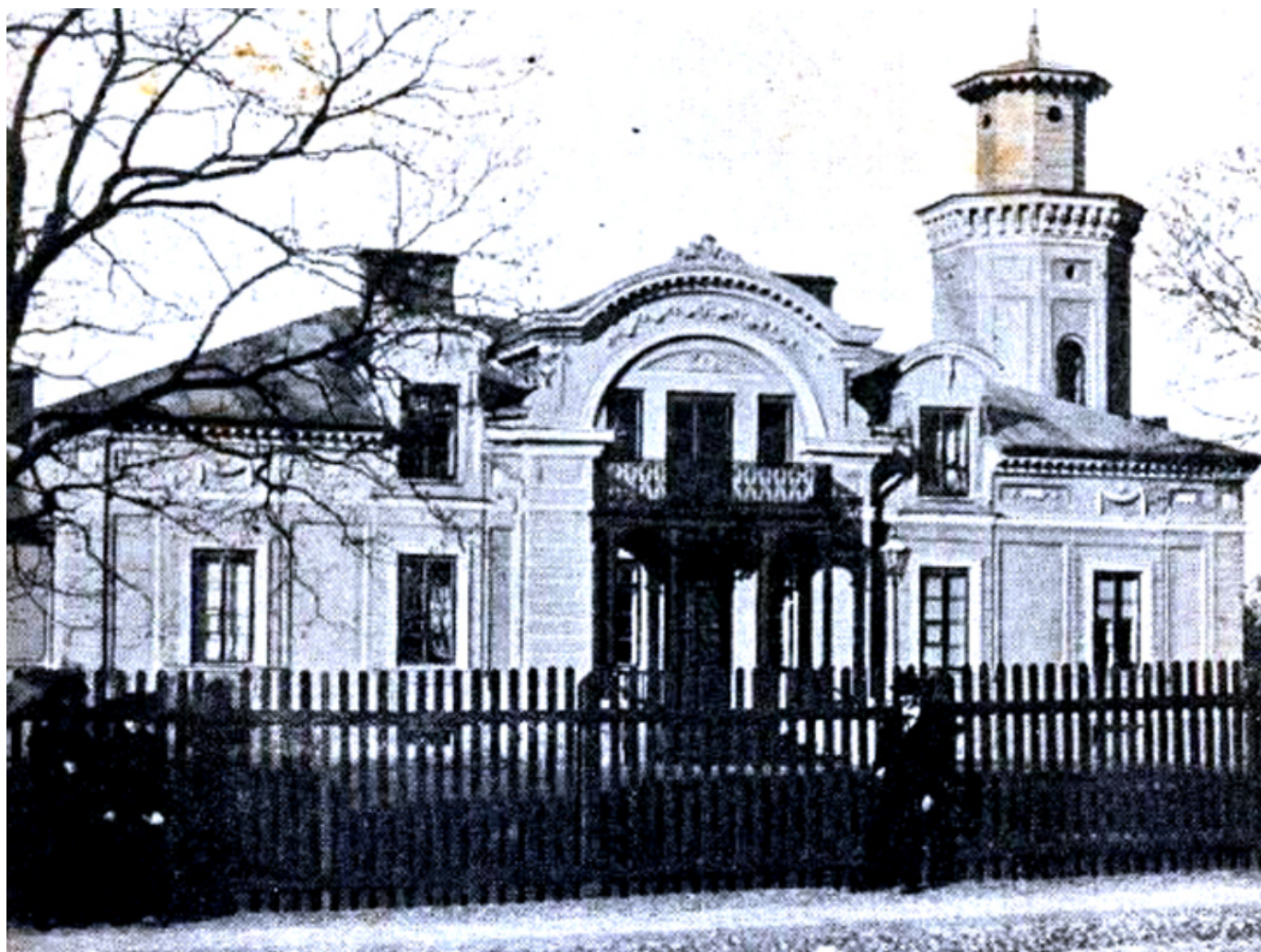
Pałac Psarskich 1914-1916, ul. Śląska i Kopernika, fot. dawna pocztówka.