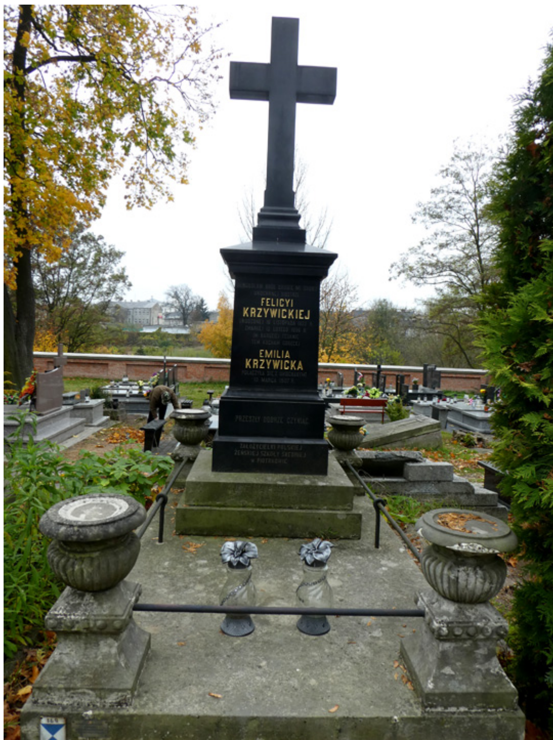
Siostry Krzywickie, założycielki szkoły średniej w Piotrkowie