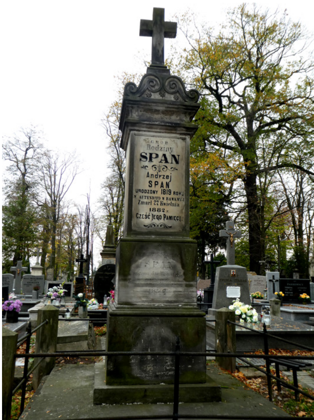
Grób rodziny Spanów