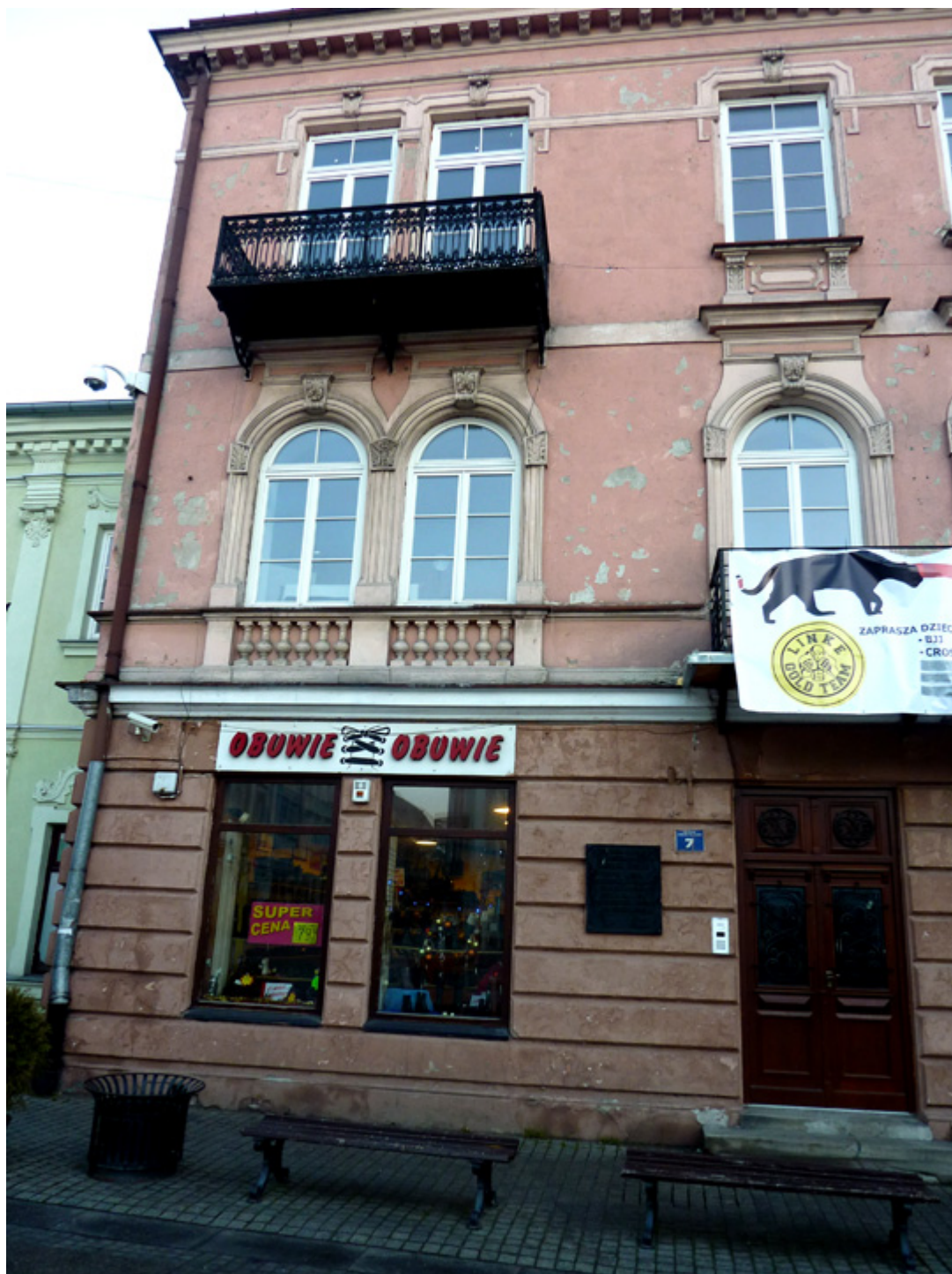
Kamienica w Rynku Trybunalskim, należąca kiedyś do Żarskich z tablicą pamiątkową poświęconą Tadeuszowi Żarskiemu