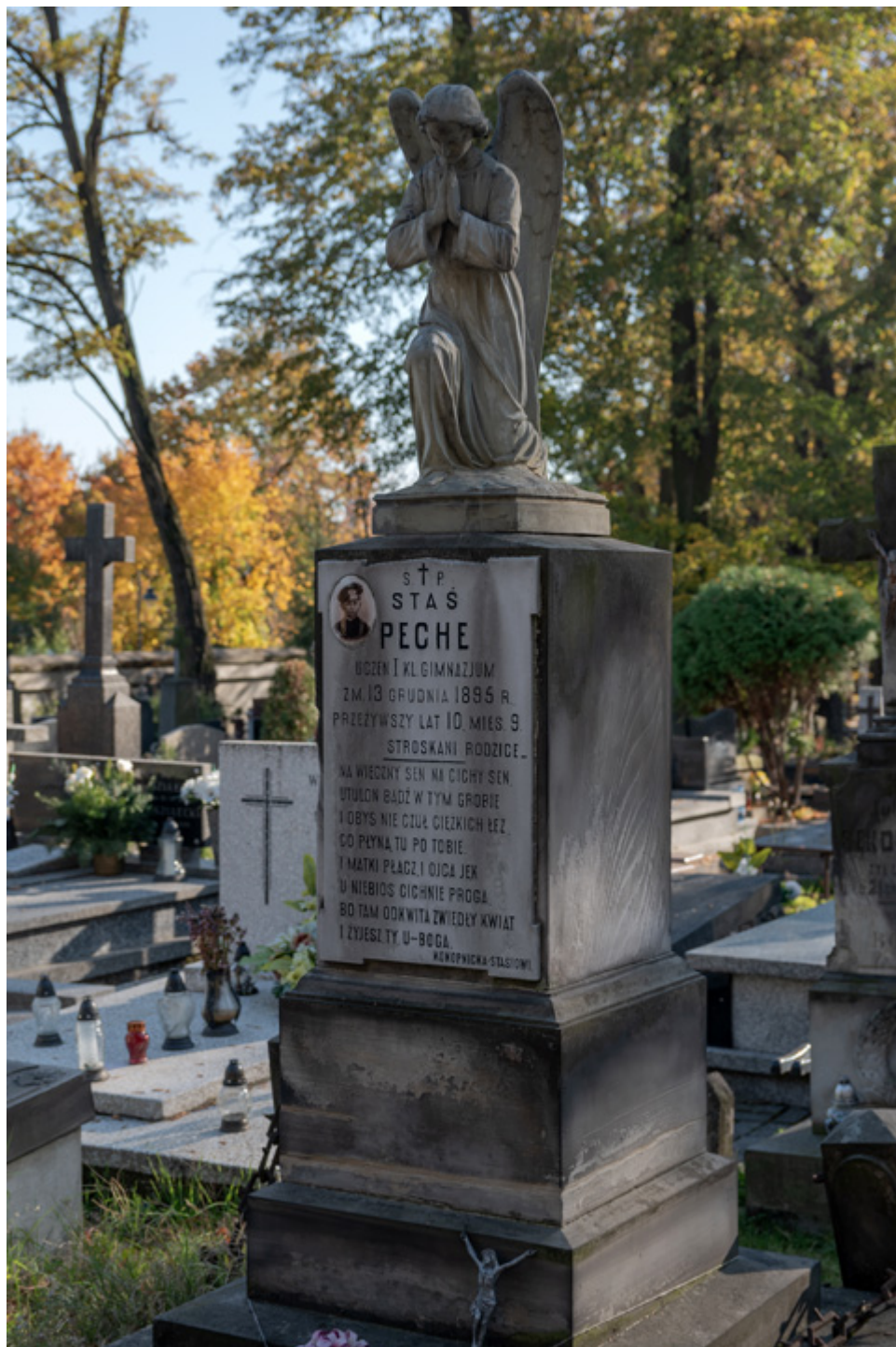
Grób Stasia Peche