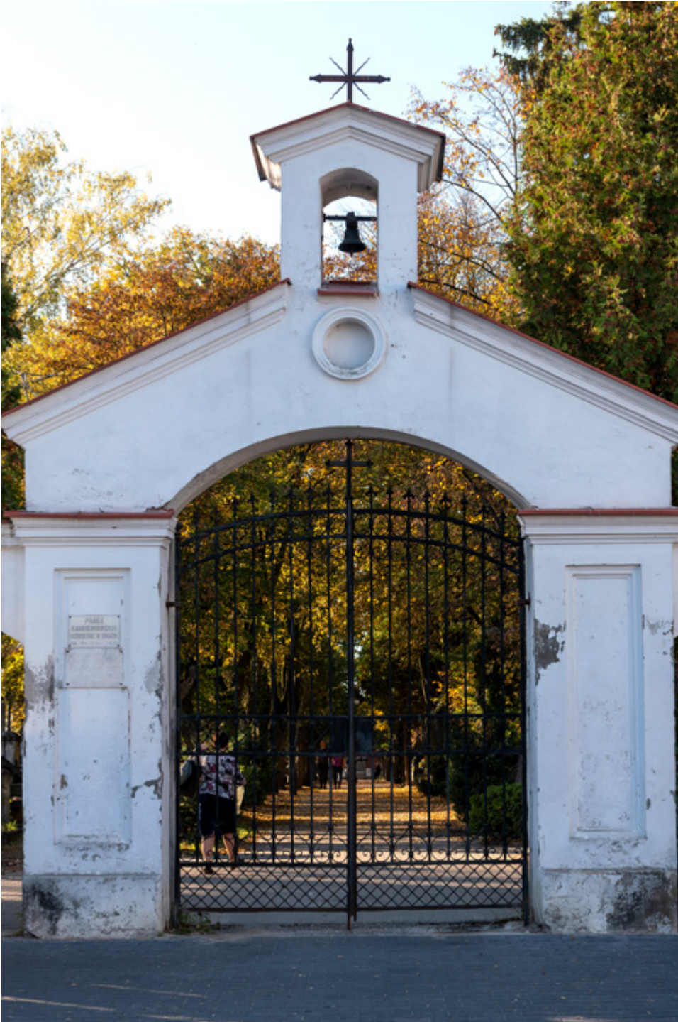
Brama główna starego cmentarza w Piotrkowie Trybunalskim, zwanego piotrkowskimi Powązkami.