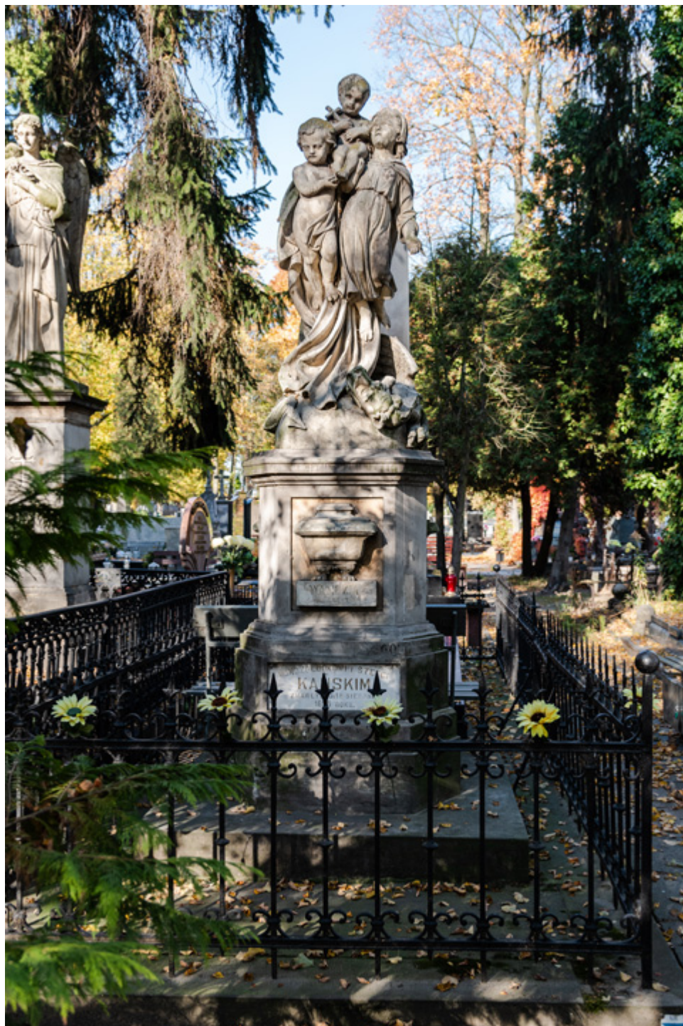
Grób dzieci Kańskich