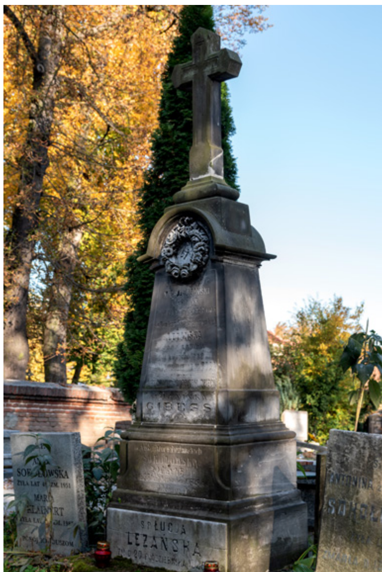
Grobowiec rodziny Sokołowskich z poł XIX w.