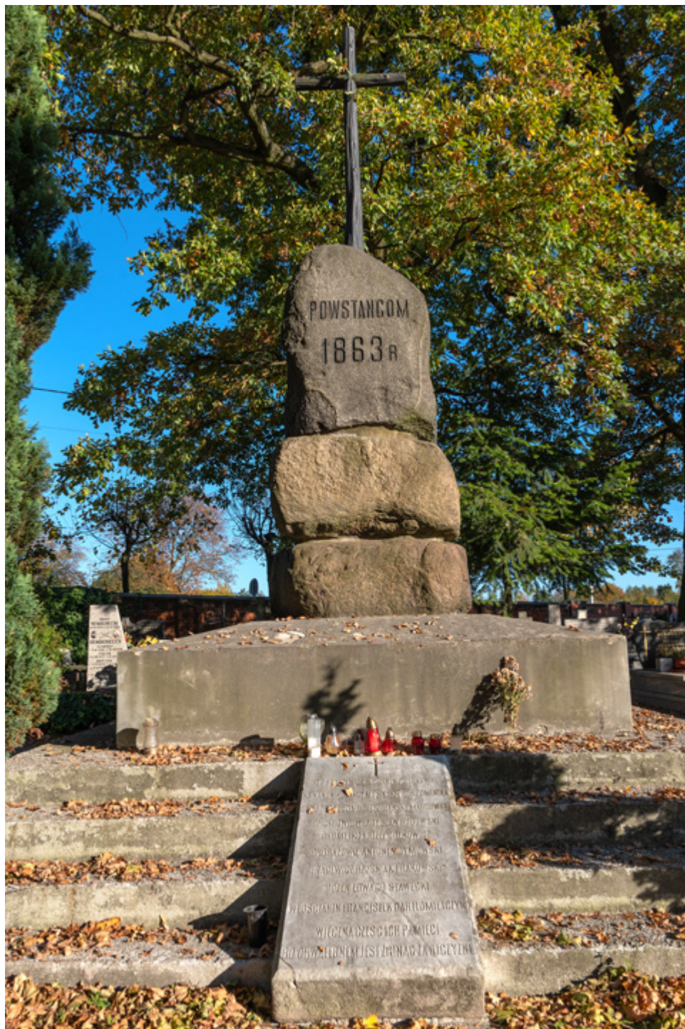
Pomnik Powstańców Styczniowych.