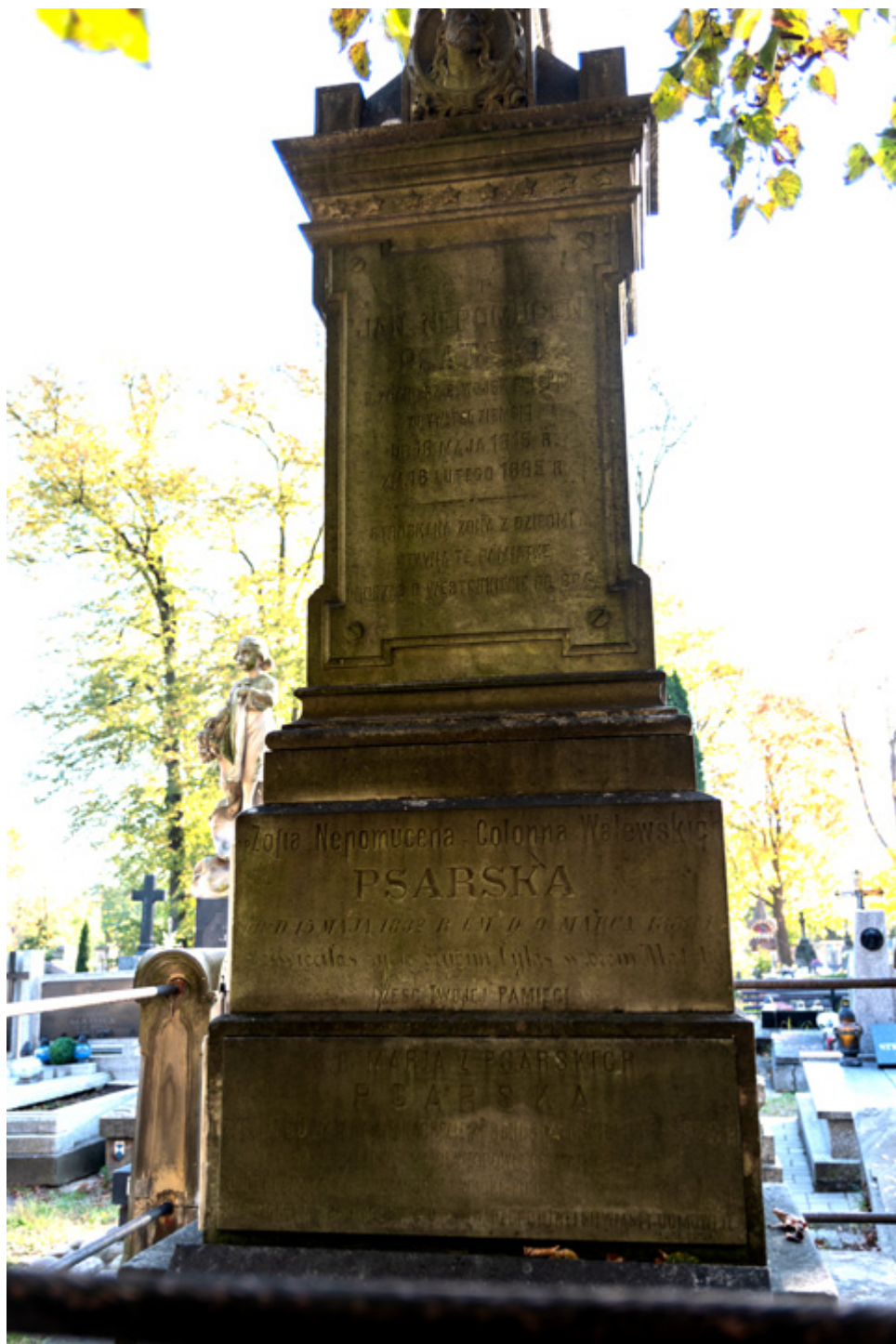
Grób rodziny Psarskich