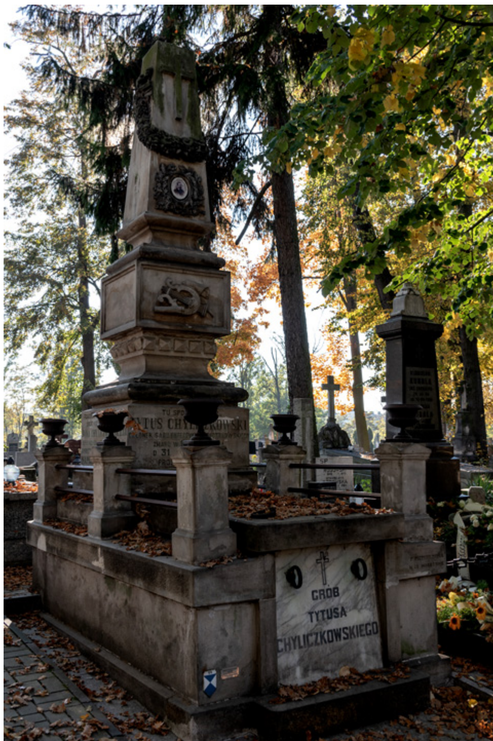
Grób Tytusa Chyliczkowskiego