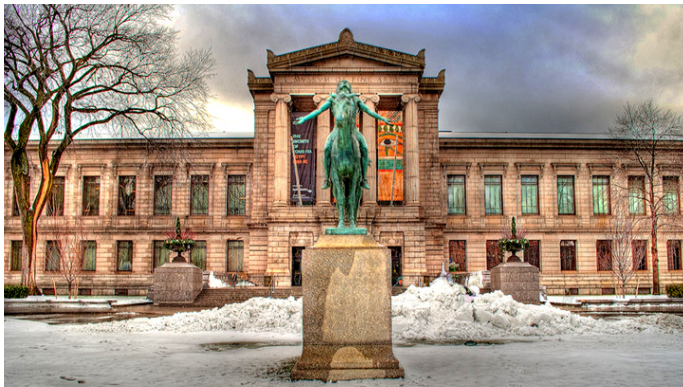
Museum of Fine Arts w Bostonie