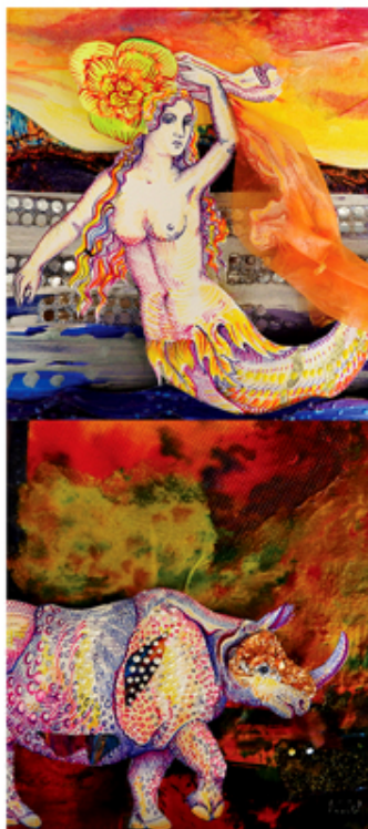
The Hudson Valley Mermaid and Dali's Rhinoceros. Size: 25x25 cm and 25x25cm. Date: 2017.