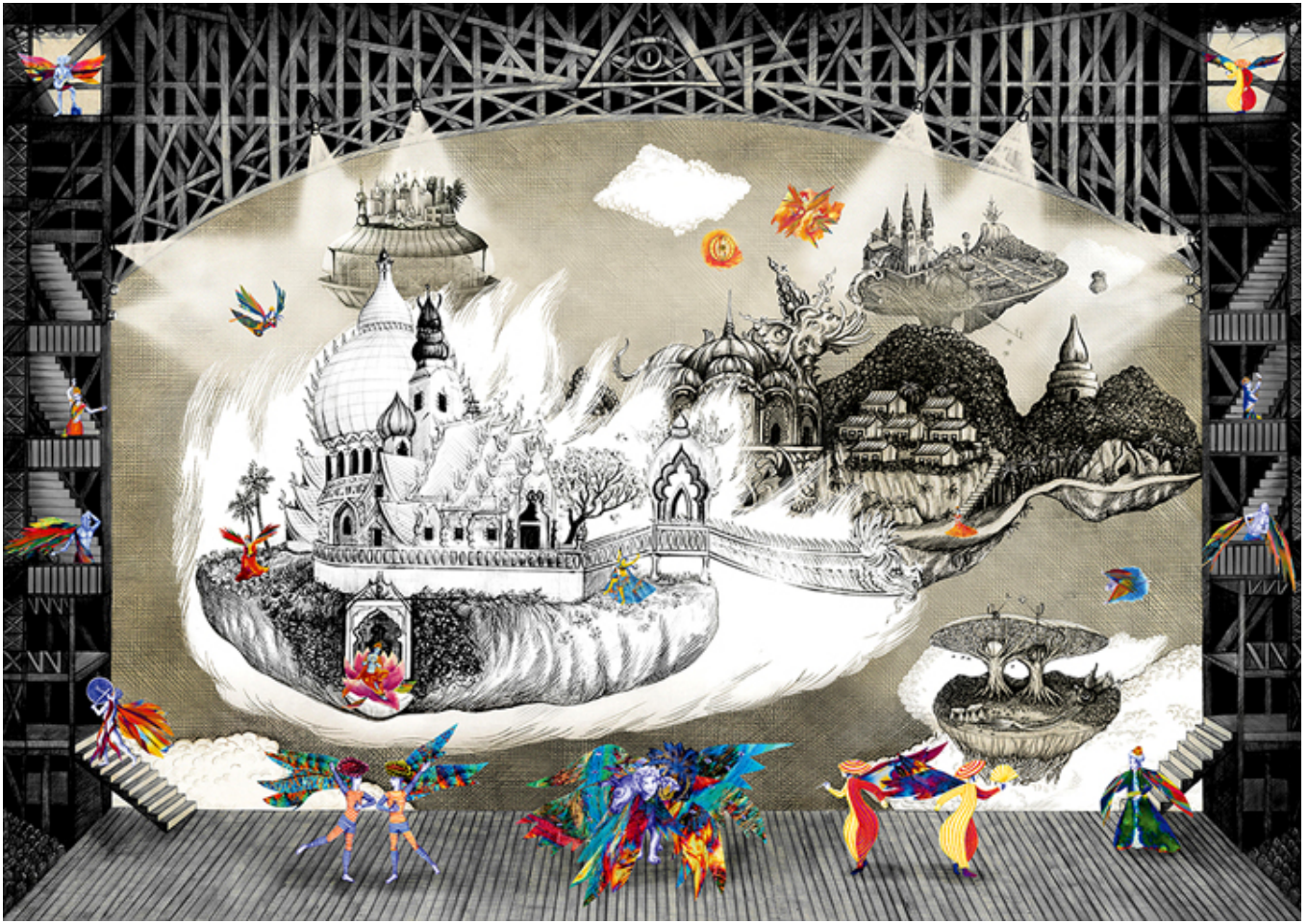
Paradise Setting I, 84×59,4cm, 2015, graphic print on Hahnemuehle German etching paper.