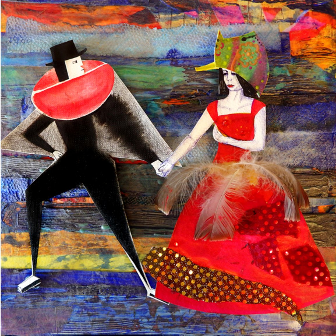
Spanish Dancers, 25x25cm, 2017, acrylic, drawing and mixed media in a shadowbox.