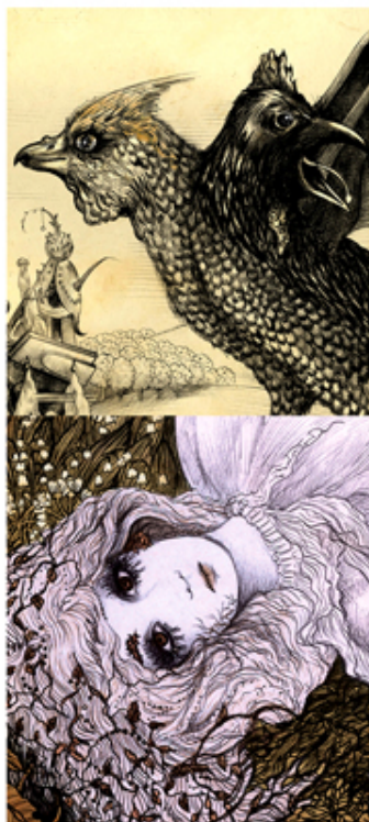
The Basilisk and Rusalka, the Forest Nymph. Size: 32x32 and 32x32cm. Date: 2015 and 2017.