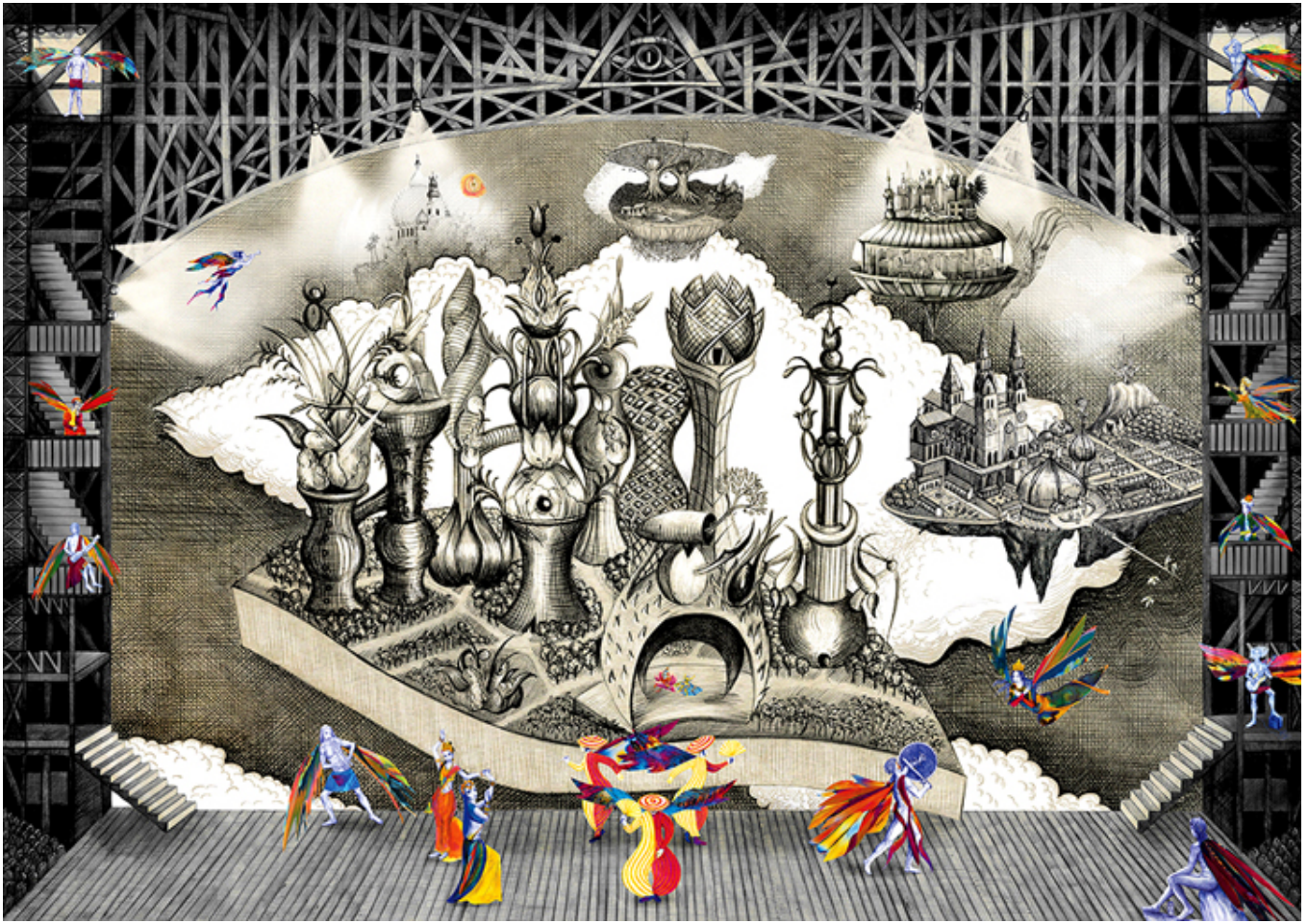
Paradise Setting II, 84×59,4cm, 2015, graphic print on Hahnemuehle German etching paper.