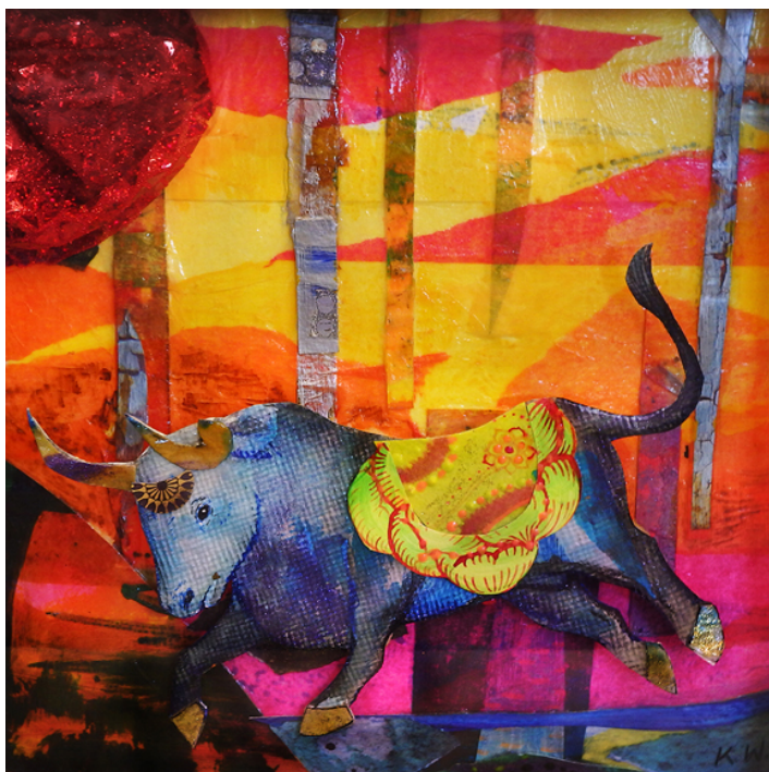
El Toro, 25x25cm, 2017, acrylic, drawing and mixed media in a shadowbox.