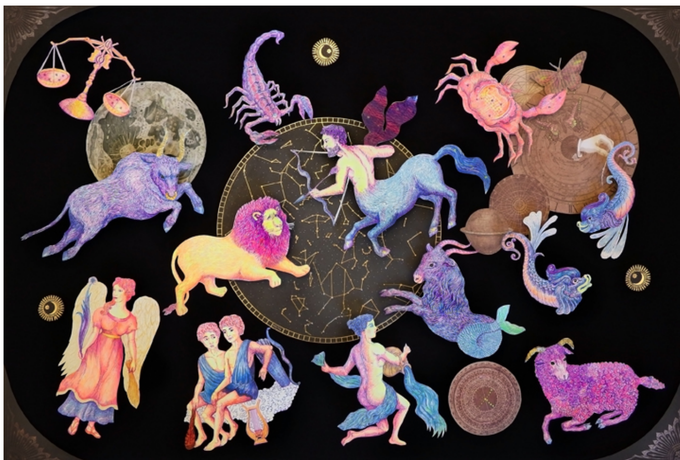
Celestial Signs, 100x70cm, 2017, acrylic, drawing and mixed media in a shadowbox.

Kamila Wojciechowicz - artystka urodzona w Australii, wykształcona w Warszawie i w Londynie, wielokrotnie nagradzana na międzynarodowych konkursach. Jest m.in.