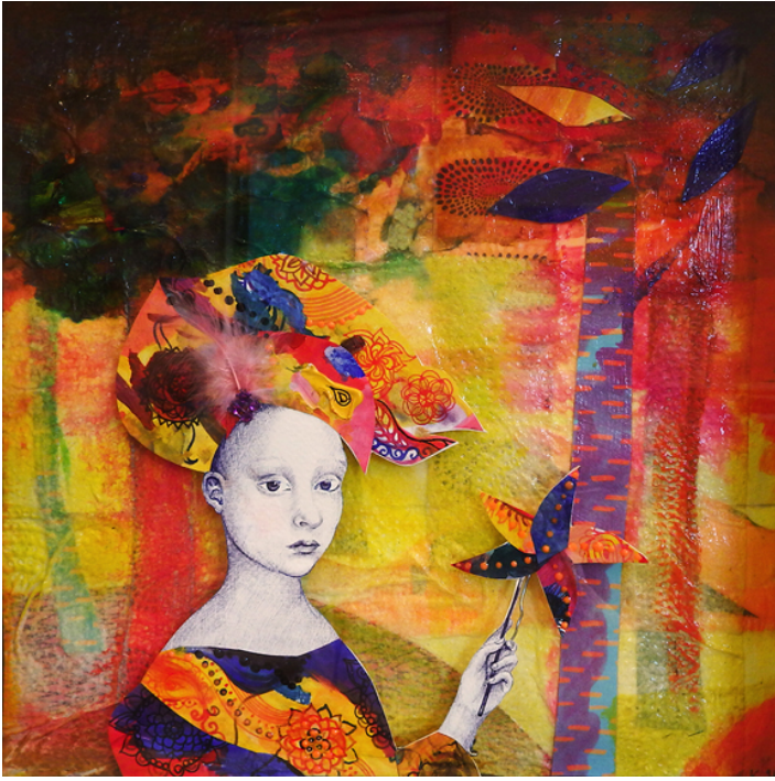
Girl with a Turban, 25x25cm, 2017, acrylic, drawing and mixed media in a shadowbox.