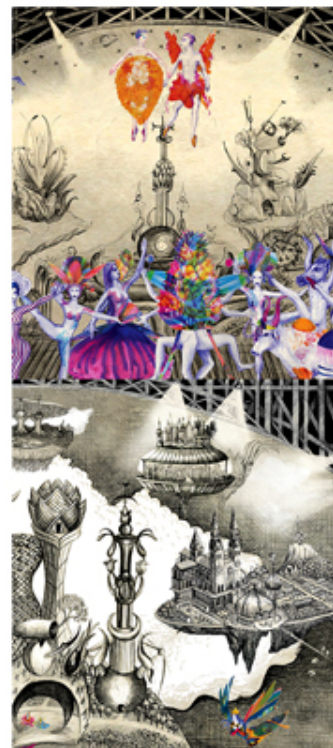
Garden of Earthly Delights and Paradise Setting II. Size: 59,4x42cm and 84x59,4cm. Date: 2015.

Tworząc moje prace inspirowałam się wielkimi mistrzami takimi jak Albrecht Dürer, Hieronim Bosch, Diego Velázquez, Peter Breugel Starszy, Petrus Christus i innymi. Zdecydowałam się połączyć w mojej sztuce pewne elementy klasyczne, takie jak rysunek inspirowany miedziorytem wiktoriańskim oraz elementy tworzone w szerokiej gamie barwnej z użyciem jaskrawych kolorów. Oczywiście, nie oznacza to, że całkowicie skopiowałam prace mistrzów. Zamiast tego, chciałam się nauczyć, ich już legendarnych umiejętności i wykorzystać je w moich pracach. Moje grafiki dotyczą głównie mojego zainteresowania baletem, operą