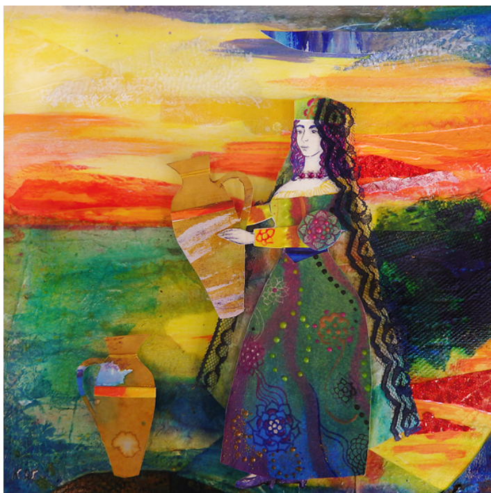
La Duquesa de Alba, 25x25cm, 2017, acrylic, drawing and mixed media in a shadowbox.