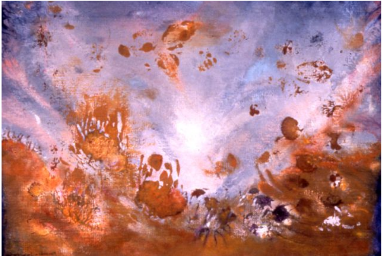
Vers Libre II