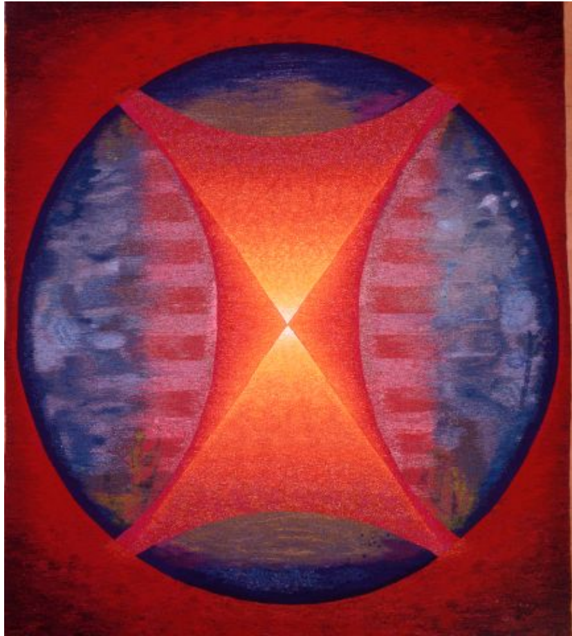
Squaring the circle