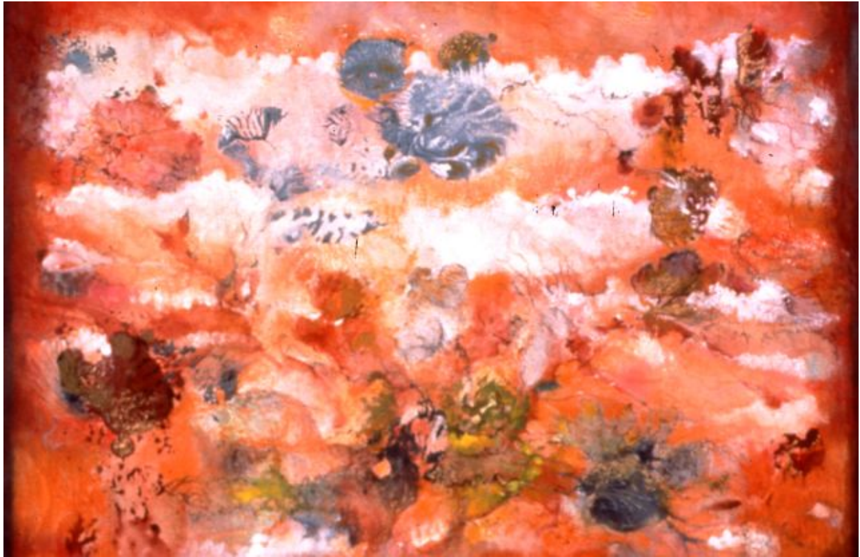
Vers Libre VI