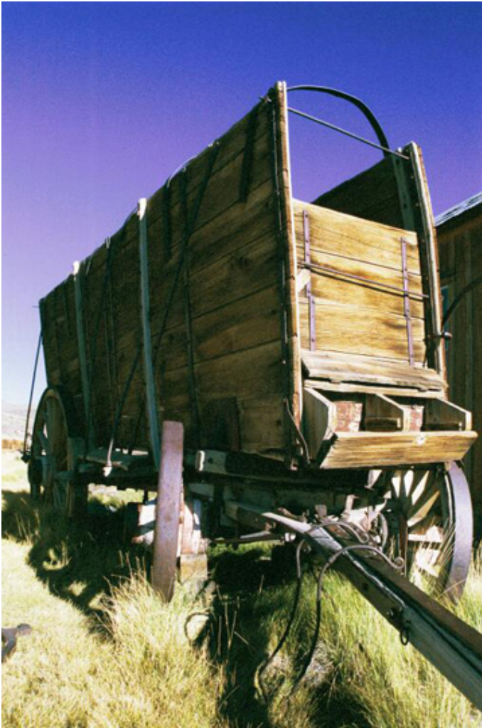
Body, wóz którym osadnicy przybywali po swoje marzenia, fot. Jacek Gwizdka.

Ta wypracowana przez lata doświadczeń i zmagañ z wysiłkiem, kalifornijska dewiza jest ciągle żywa. Kalifornia nadal przyciąga marzycieli, ryzykantów, ludzi odważnych nie wahających się postawić wszystkiego na jedną kartę. To nie przypadek, że właśnie w Krzemowej Dolinie niedaleko San Fransico ciągle powstają setki nowych, małych i wielkich firm komputerowych. To tu w błyskawicznym tempie rozwija się Internet, którego sieć oplótła już całą kulę ziemską. Tak jak ponad sto lat temu Kalifornia była głównym dostawcą złota dla mennic i banków w całych Stanach Zjednoczonych, tak teraz dostarcza całemu światu komputerową myśl twórczą.