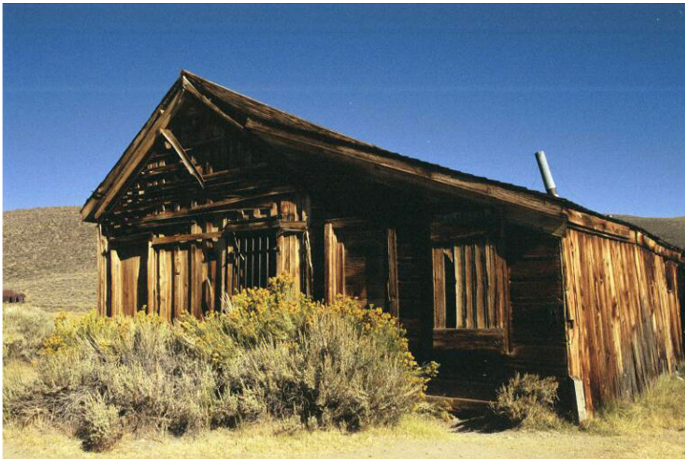
Bodie, fot. Jacek Gwizdka

temperatur, ostre mrozy i brak wody. Przetrzymywali samotność i zabójczo ciężką pracę. Każdego dnia walczyli o przetrwanie, ginęli przy przeprawie przez niezwykle trudne do pokonania przełęcz Sierra Nevada, żyli na pustkowiu. Poddający się prawom natury, oddaleni wielokilometrową przestrzenią od najbliższej osady, trwali, opanowani szaleńczą pogonią za pieniądzem.