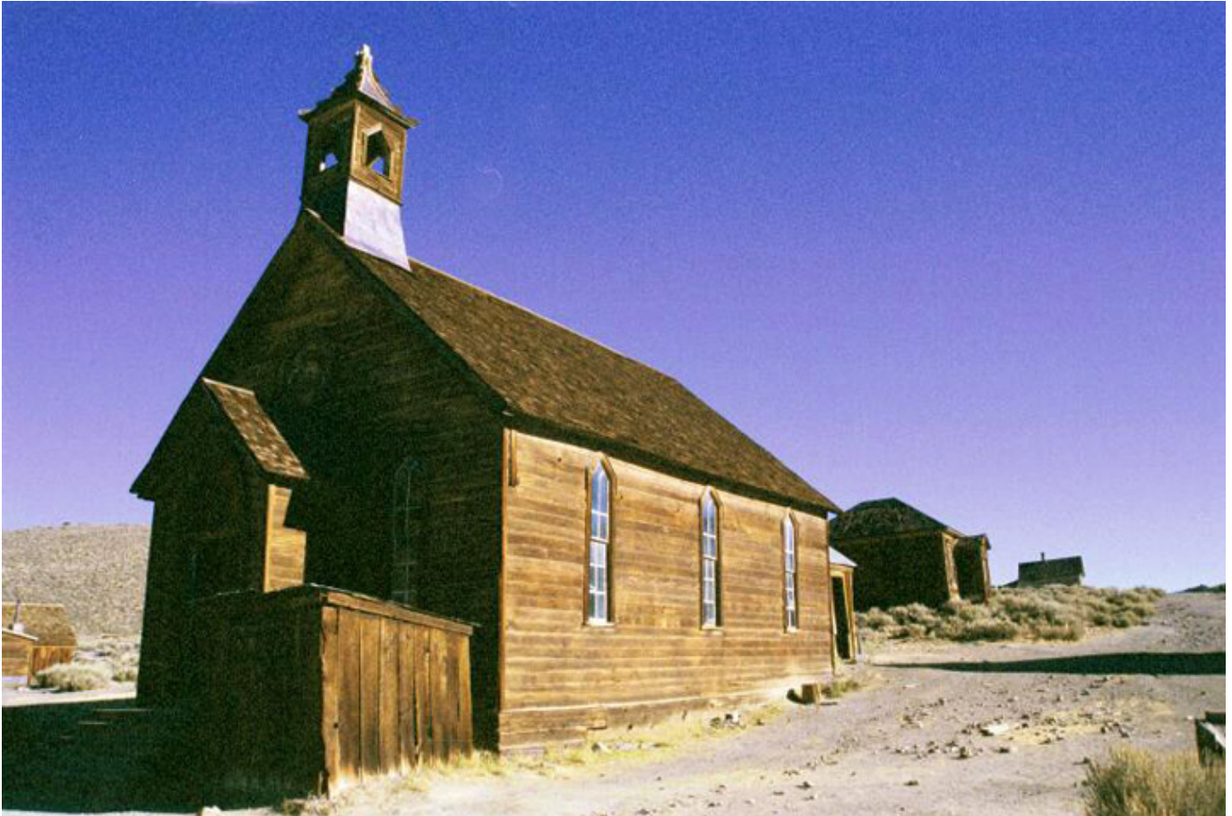
Bodie, kościół ewangelicki, fot. Jacek Gwizdka.

W gablocie album z fotografiami. Twarze, sprawy, codzienne zajęcia i ważne wydarzenia, marzenia i nadzieje.