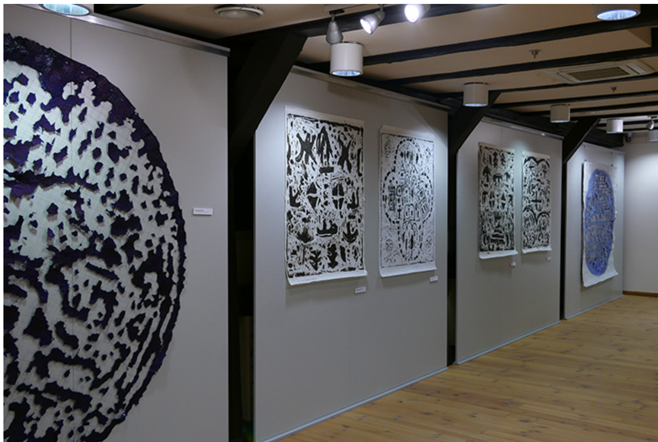
Wystawa prac Edwarda Barana w Muzeum Papiernictwa w Dusznikach Zdroju

pokazano prace graficzne - estampaże (gipsoryty), wykonane na papierze ryżowym.