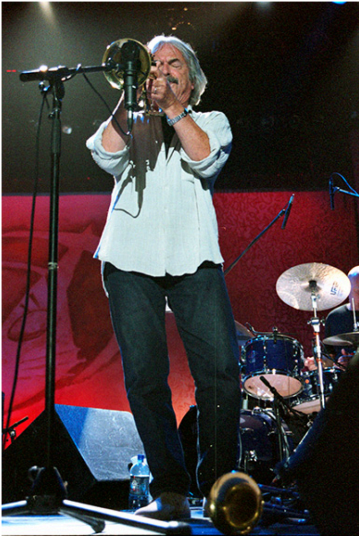
Enrico Rava, Montreal. 2001.