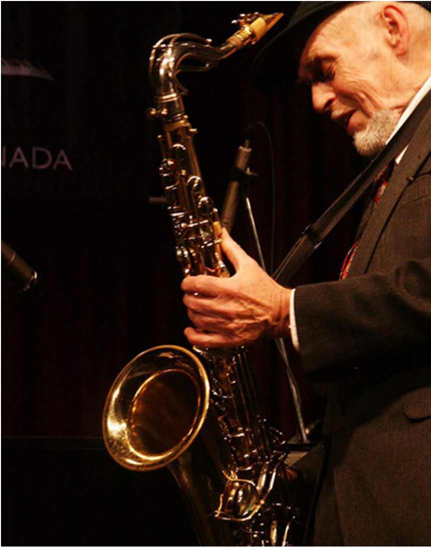
Jan Ptaszyn Wróblewski, Toronto, 2004.