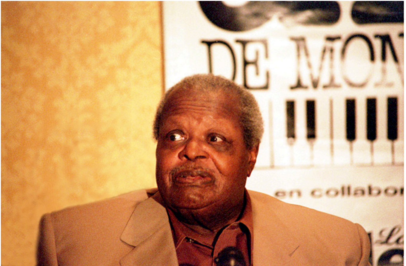
Oscar Peterson, Montreal, 2001.