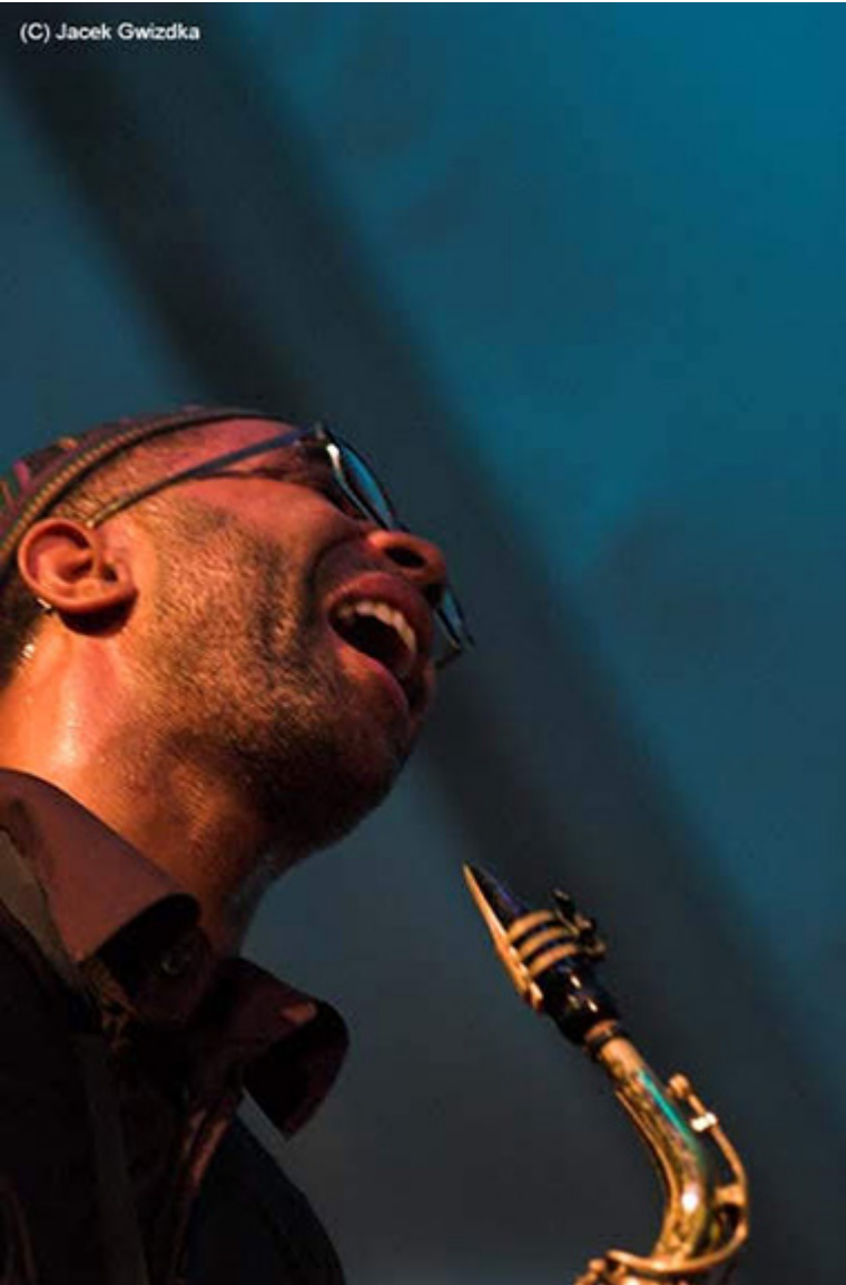
Kenny Garrett, Toronto, 2005.