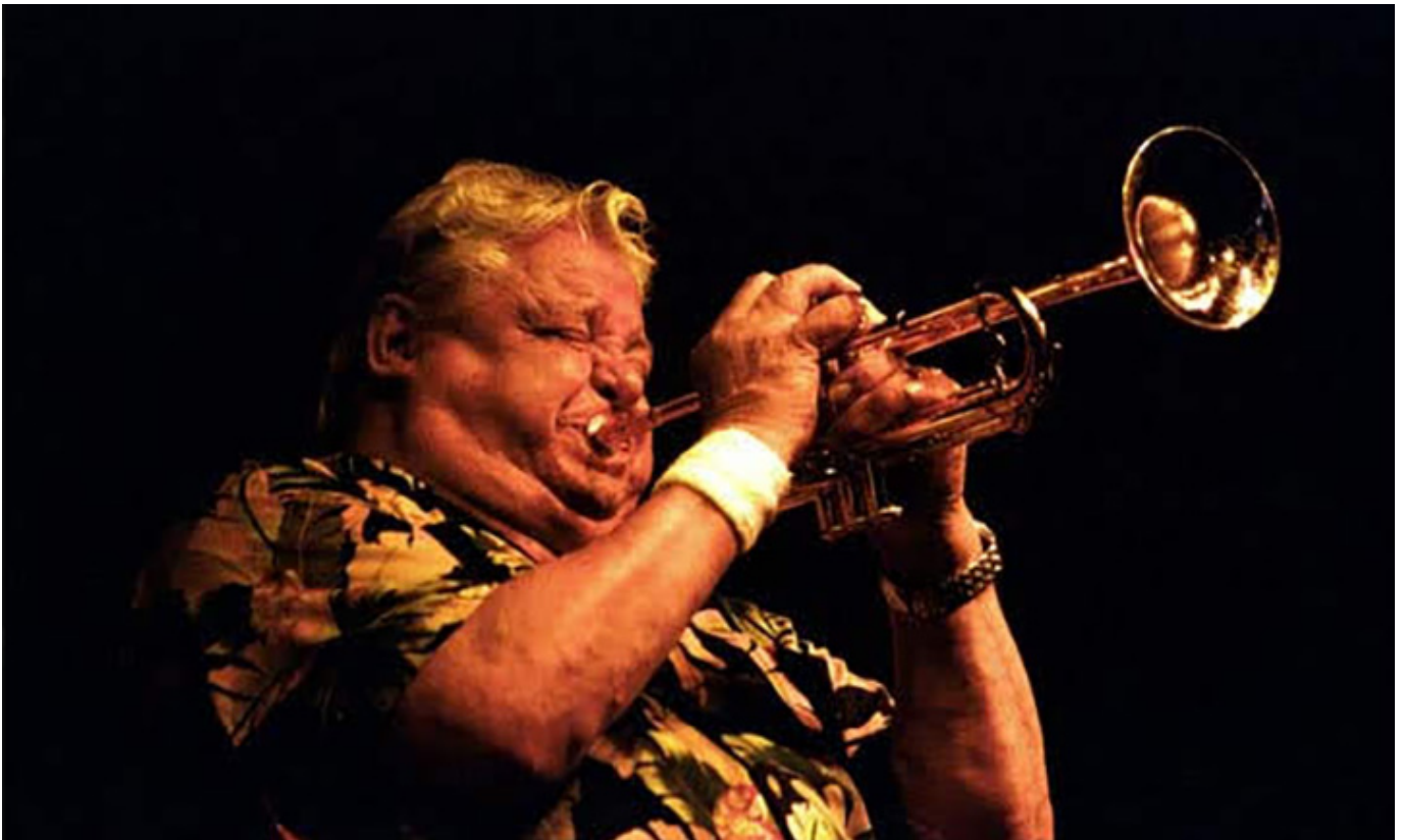
Maynard Ferguson, Toronto, 2002.