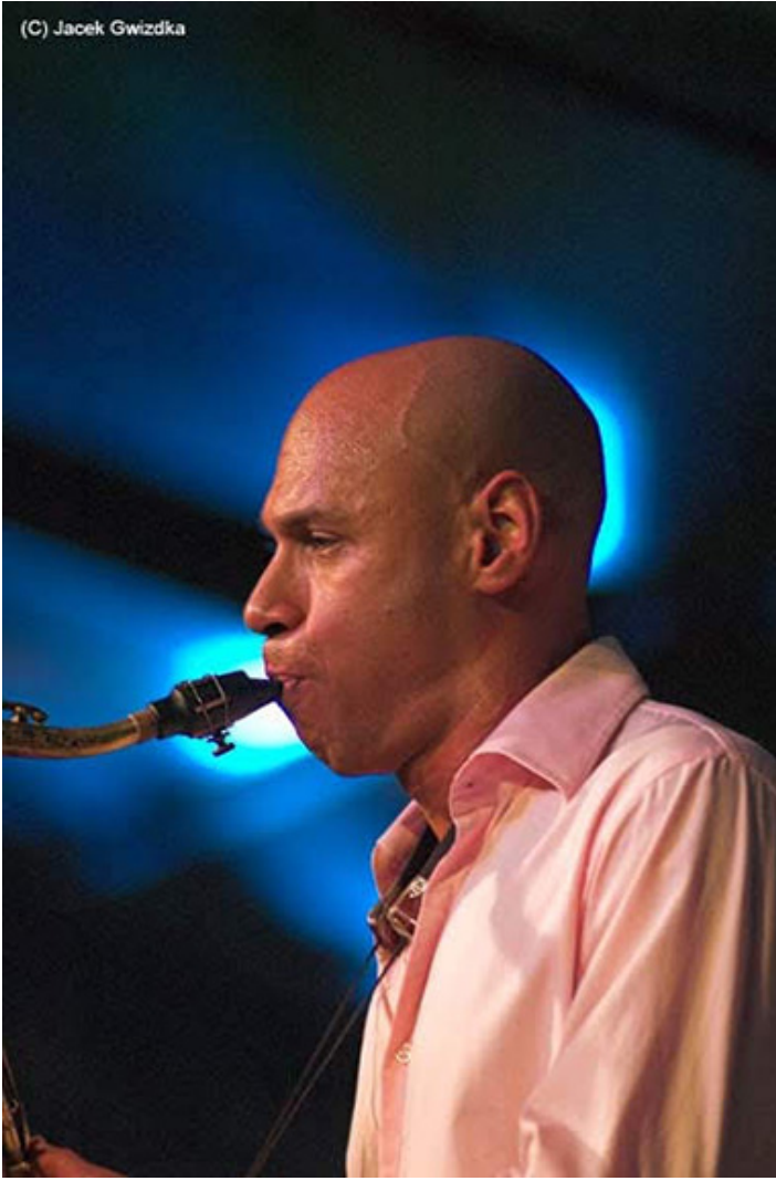
Joshua Redman, Toronto, 2005.