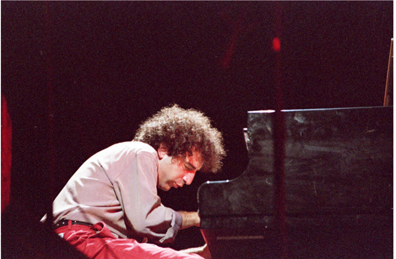
Stefano Bollani, Montreal, 2001.