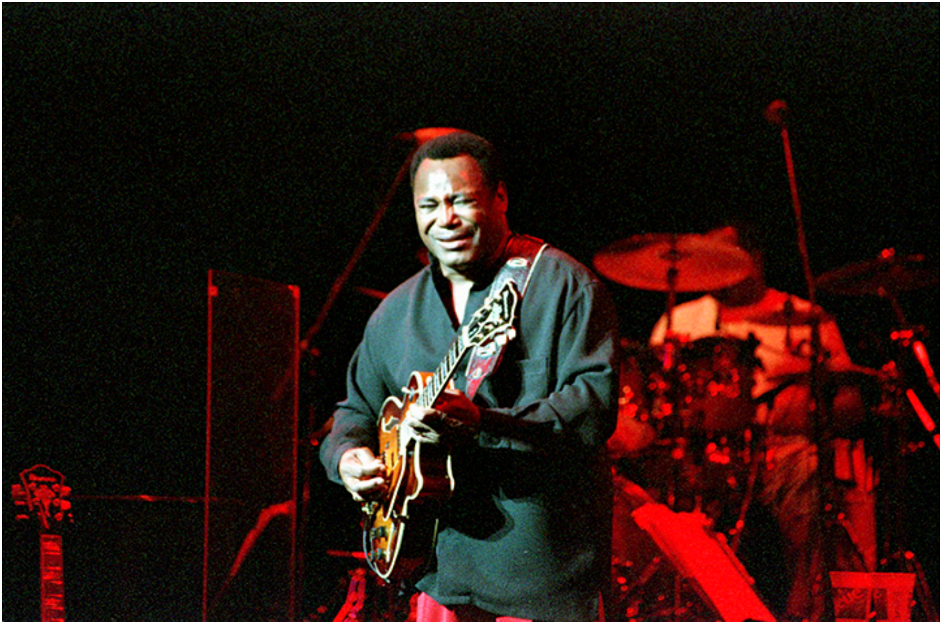
George Benson, Montreal, 2001