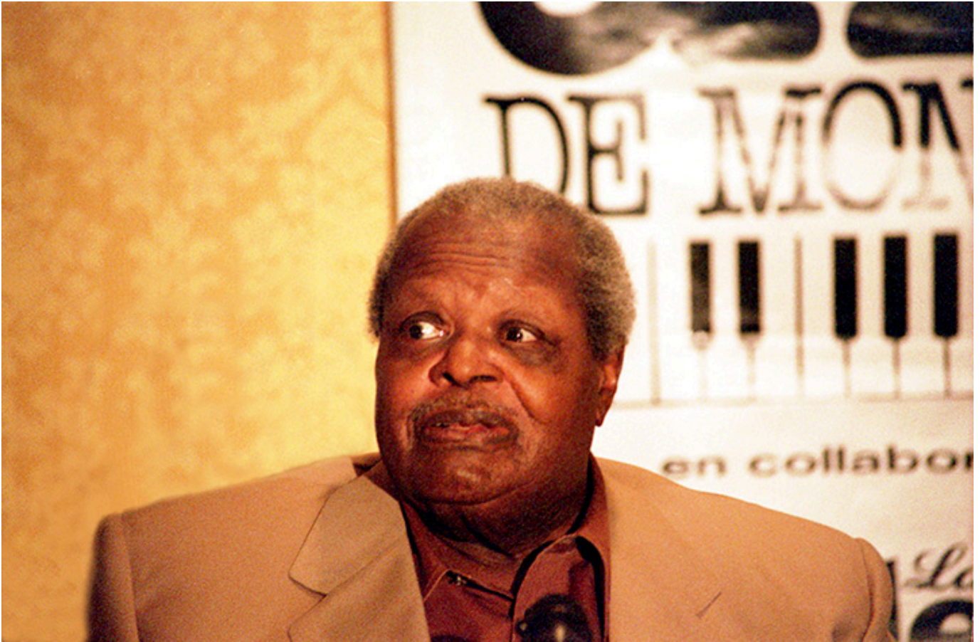
Oscar Peterson, Montreal, 2001.