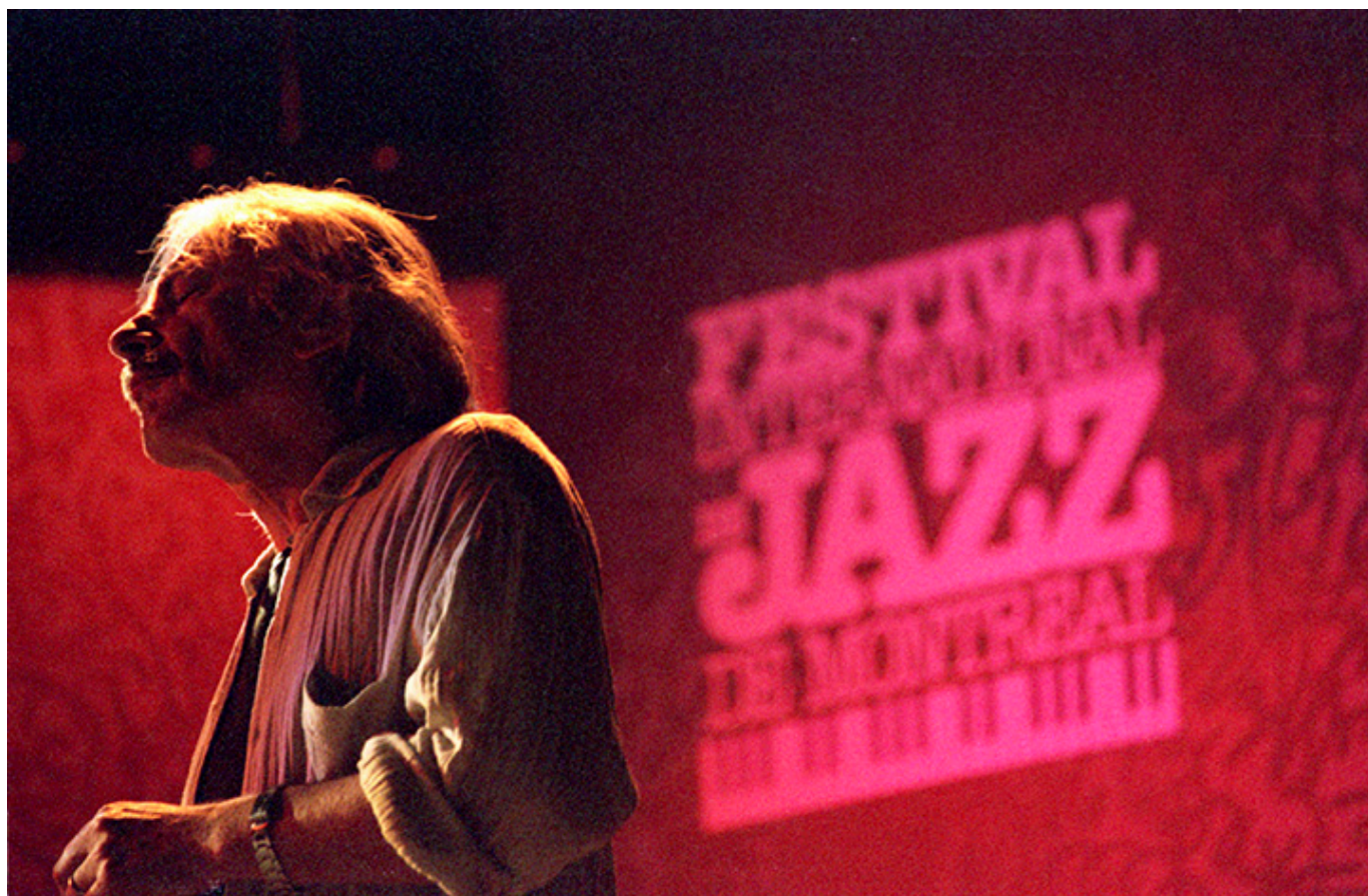
Enrico Rava, Montreal, 2001.