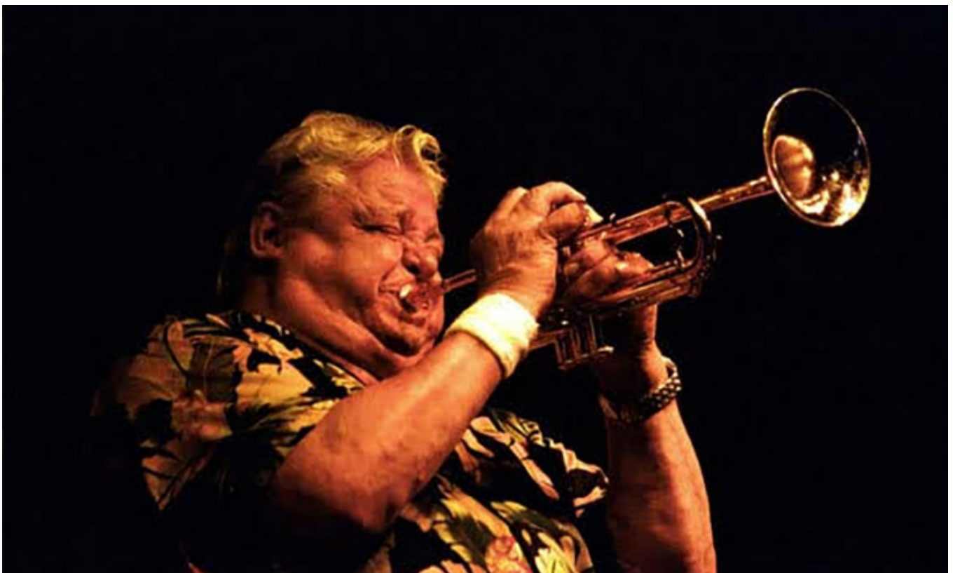
Maynard Ferguson, Toronto, 2002.