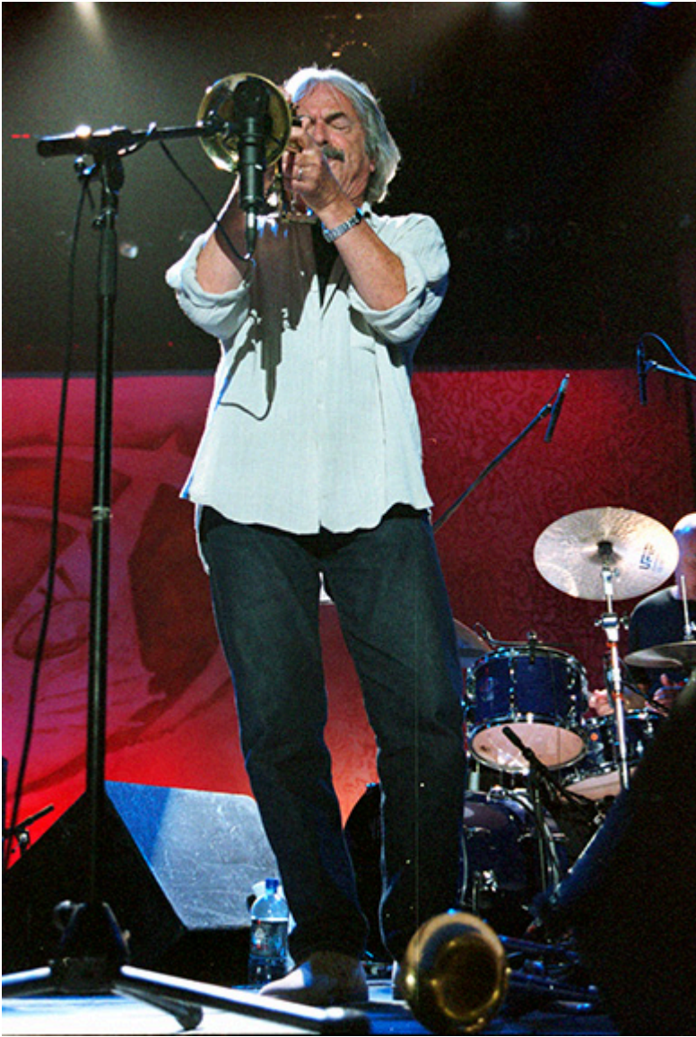
Enrico Rava, Montreal. 2001.