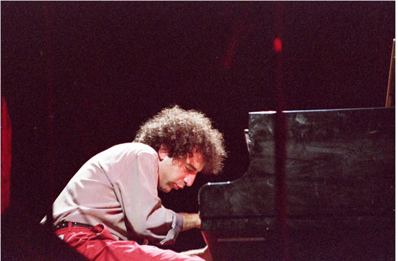
Stefano Bollani, Montreal, 2001.