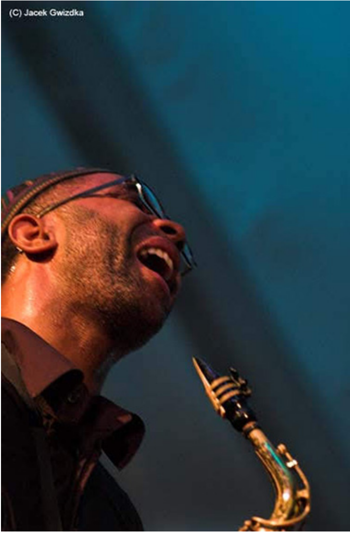
Kenny Garrett, Toronto, 2005.