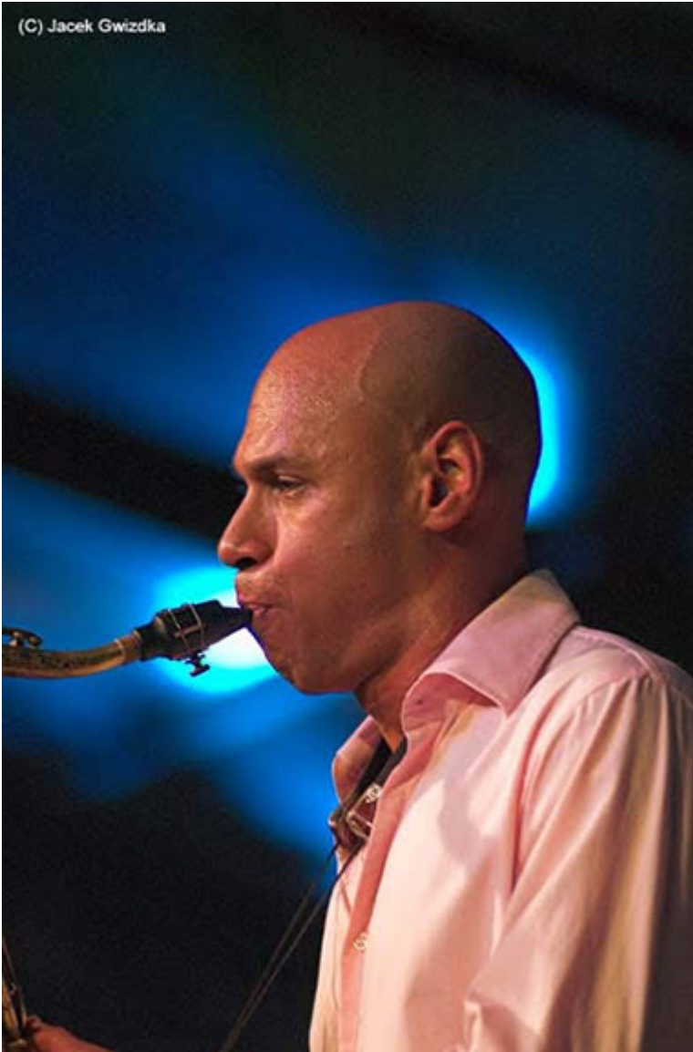
Joshua Redman, Toronto, 2005.