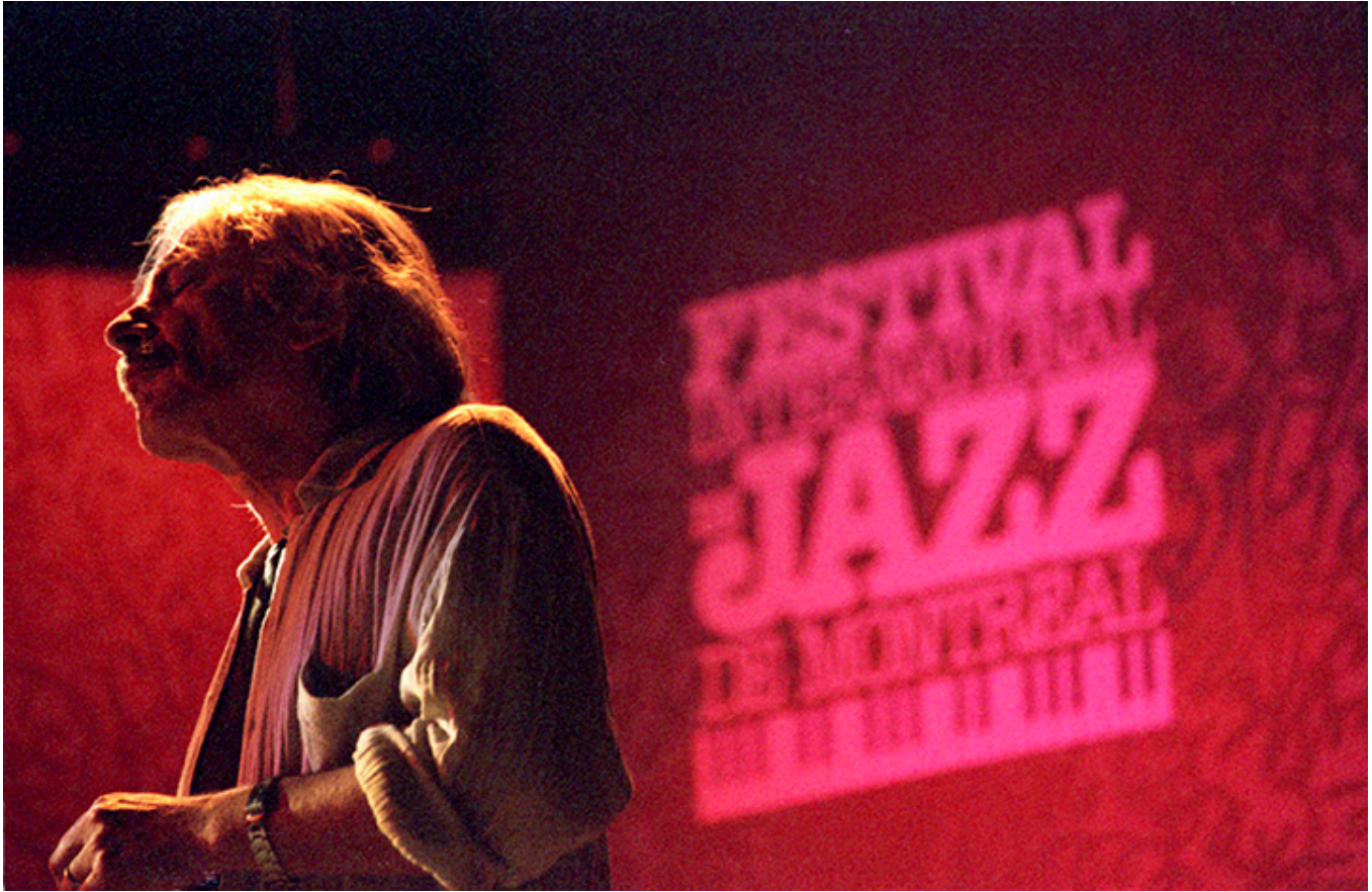
Enrico Rava, Montreal, 2001.