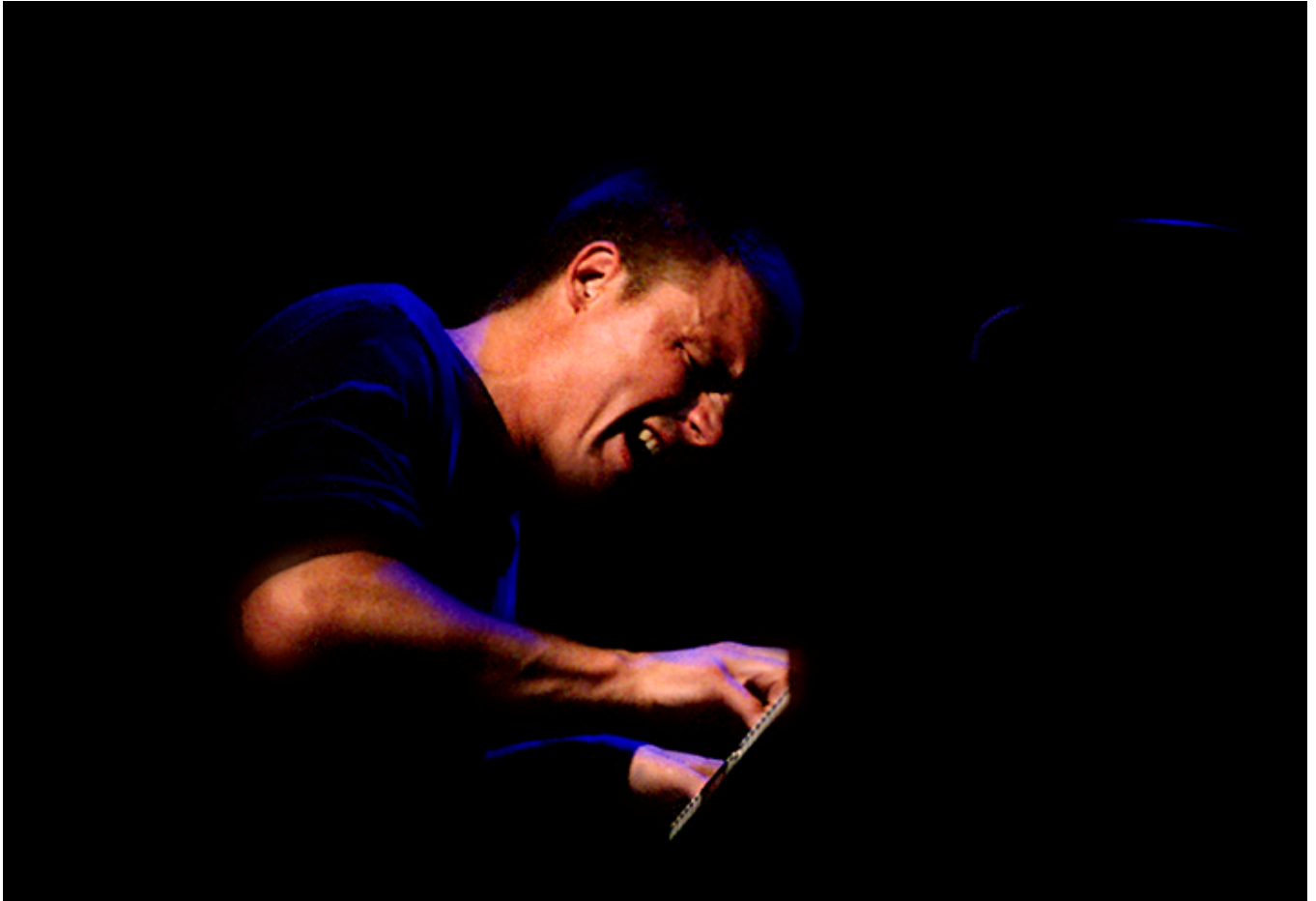
Esbjörn Svensson, Montreal, 2002.