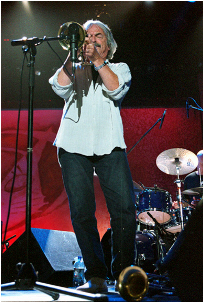
Enrico Rava, Montreal. 2001.