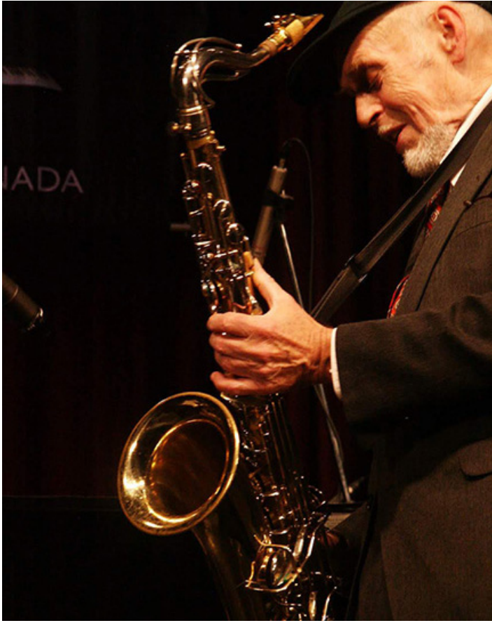
Jan Ptaszyn Wróblewski, Toronto, 2004.