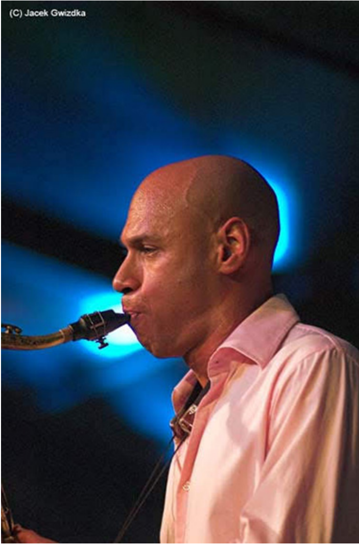
Joshua Redman, Toronto, 2005.