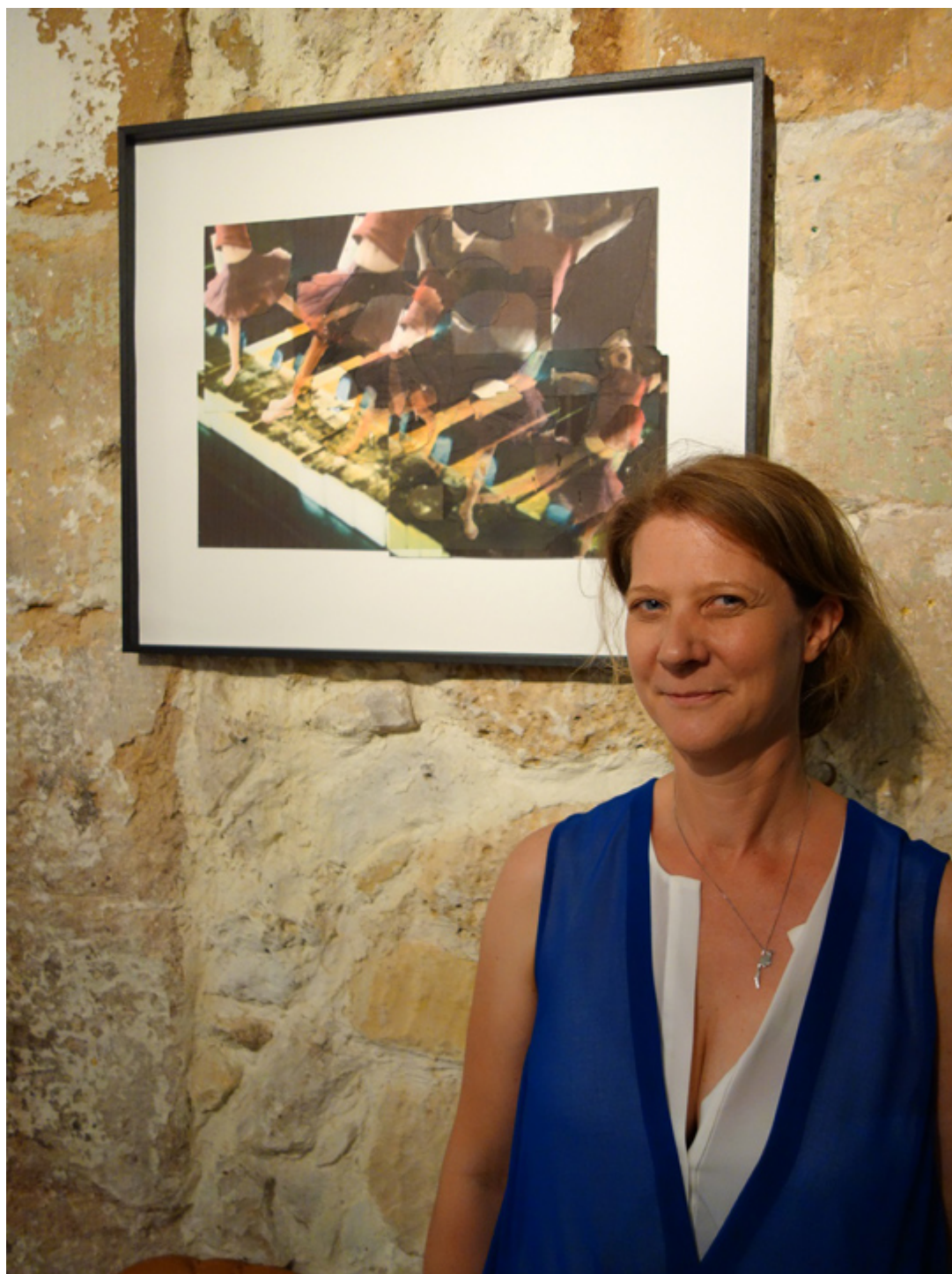
Wernisaż wystawy finalistów Konkursu im. Paderewskiego. Michele Landel, koncert fortepianowy a-moll, kolaż z haftowanych fotografii, 2018, 50 x 67 cm.