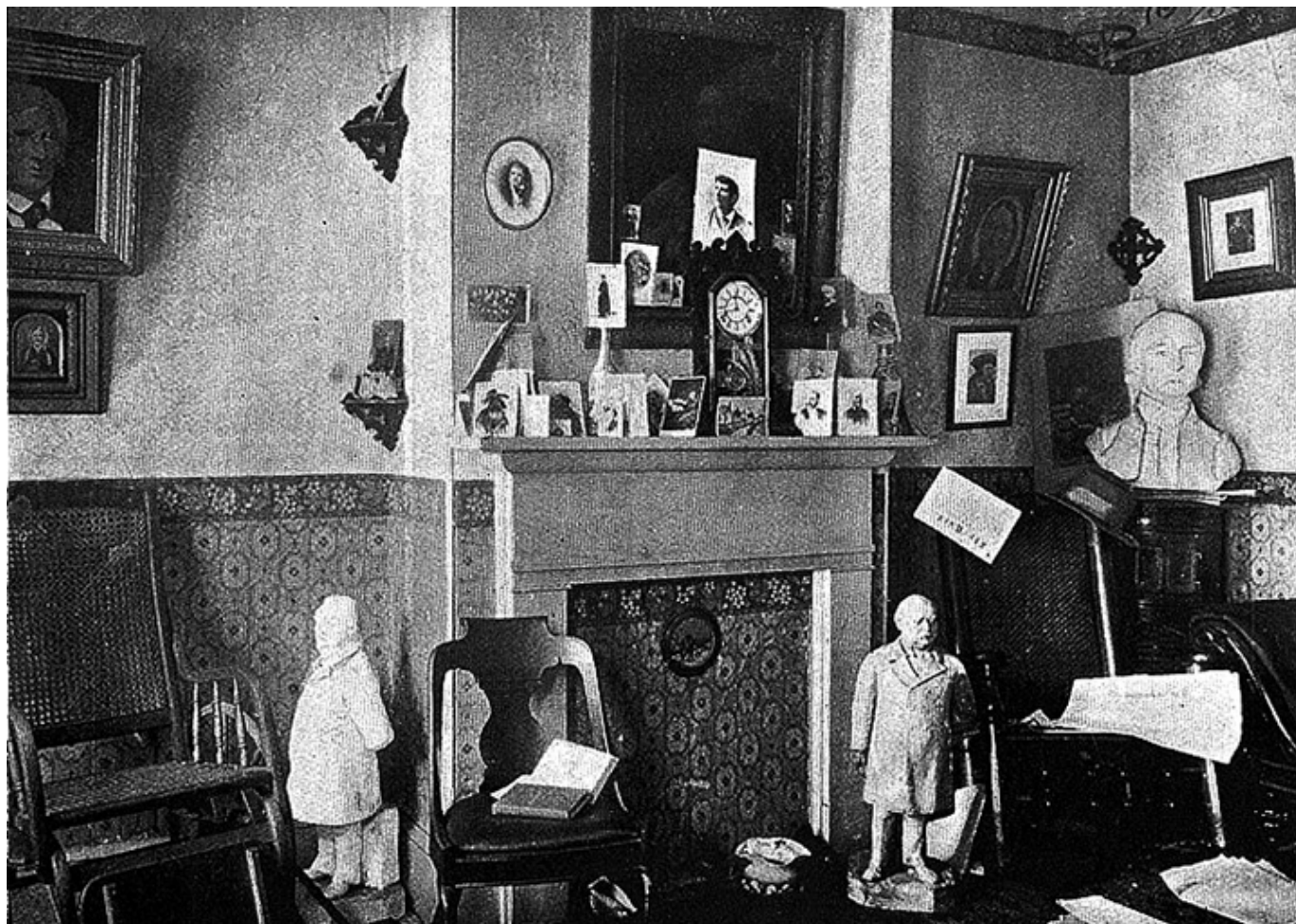
Wnętrze domu Walta Whitmana w Camden, New Jersey