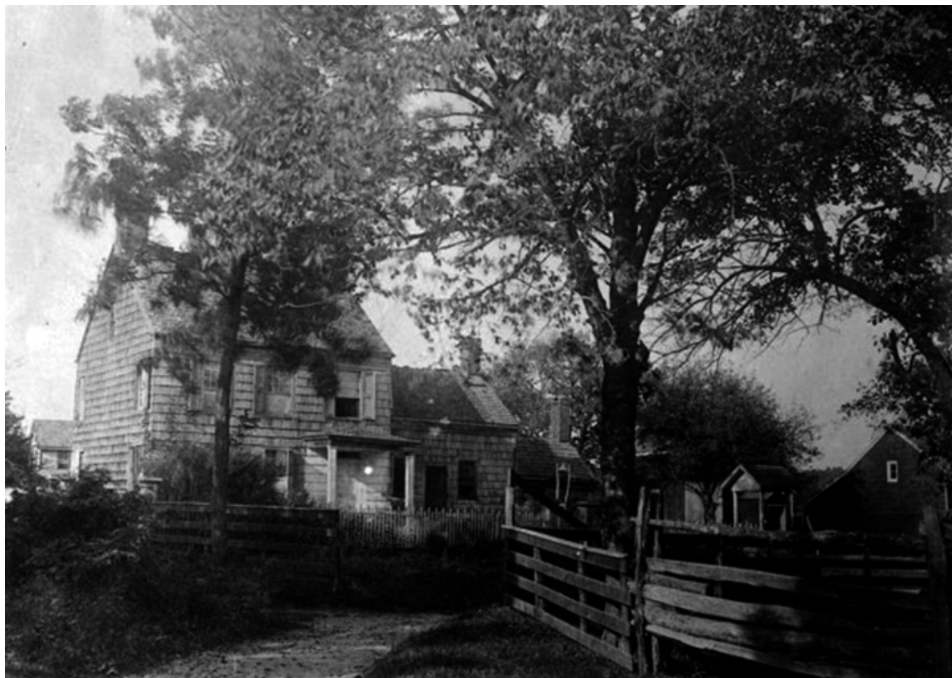
Miejsce urodzenia Walta Whitmana, Amityville Road (State Route 110), West Hills, Suffolk County, NY, fot. Library of Congress Prints and Photographs Division Washington, D.C. 20540 USA, wikimedia commons