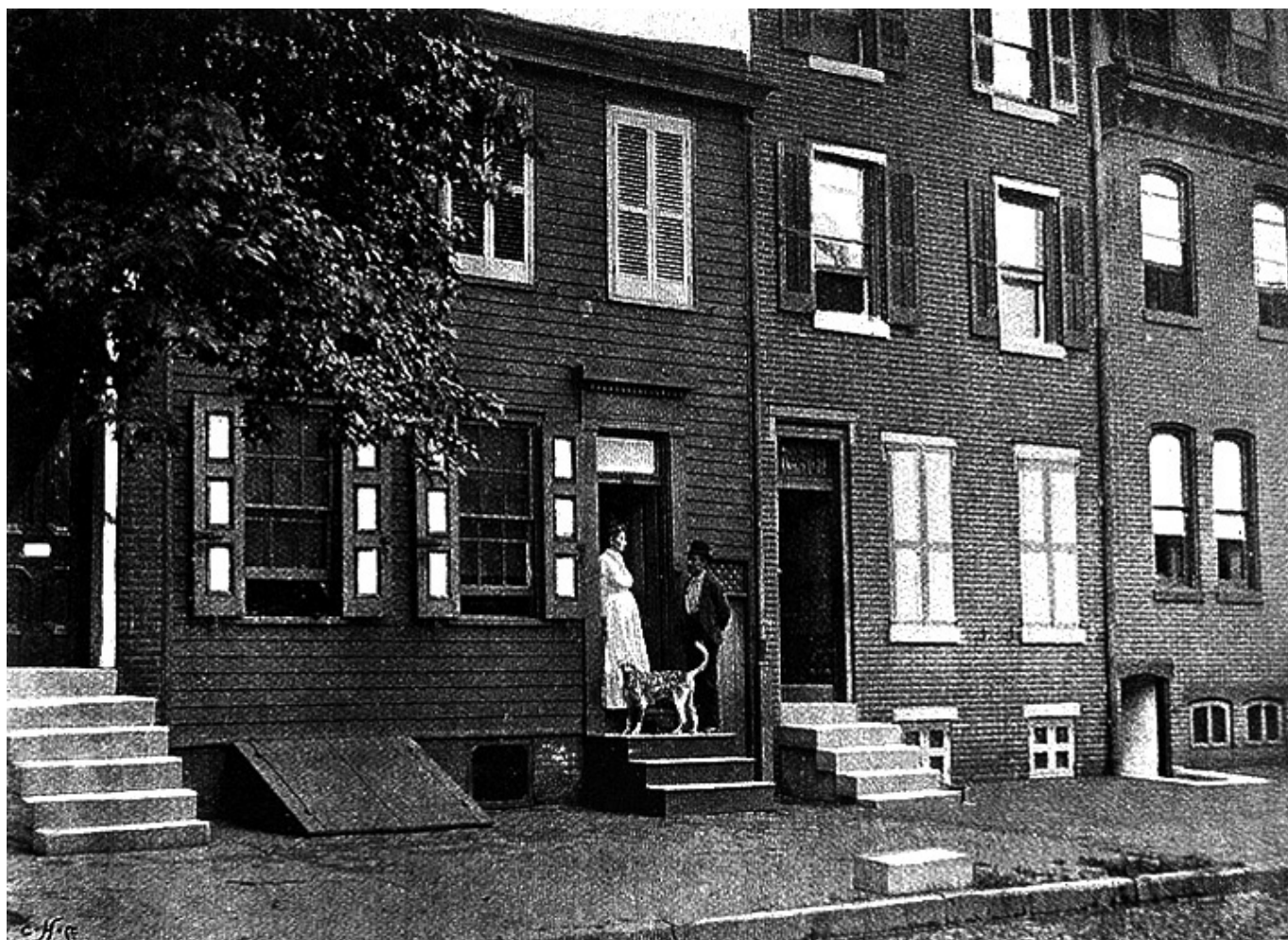
Dom Walta Whitmana w Camden, New Jersey, fot. wikimedia commons

muzyka burzy celebrytuje wszystkie namiętne pieśni życia.