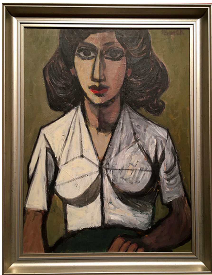
Żydówka, I poł. lat 50. XX w., olej na płótnie, 61×45,5 cm

Tak właśnie wyglądali wychudzeni wieśniacy we wczesnych obrazach Van Gogha. Dalej na tej samej ścianie zawieszono nieduży portret „Żydówki” (wczesne lata 1950-te), piękny, trafny, kubizujący. Nie sposób jest opisać wszystkie obrazy wstępnej sali. Poczulem już wtedy, że wystawa wprowadziła mnie we wzruszenie, zadumę, podziw i uznanie.