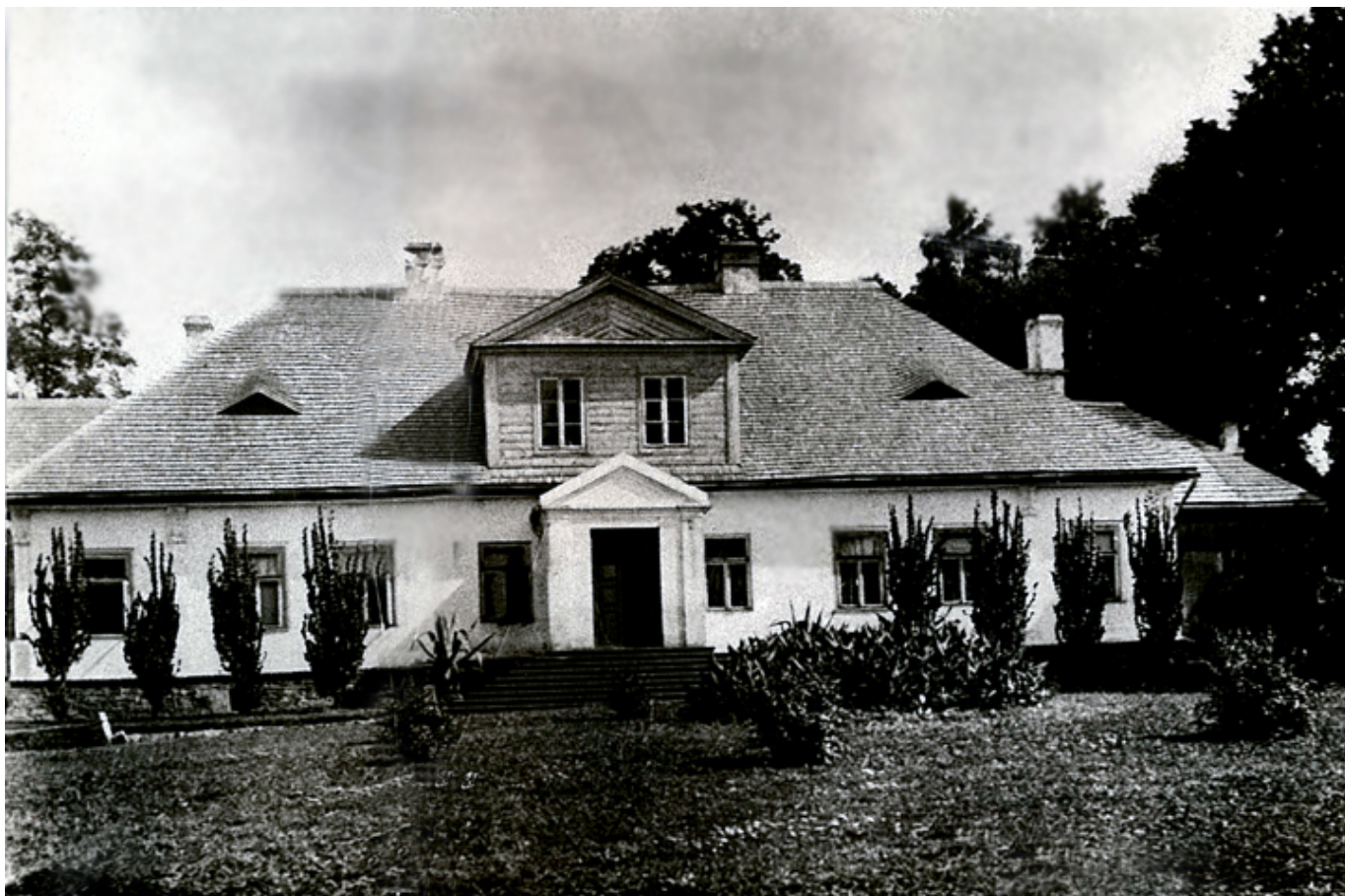
Dwór w Mirogonowicach, lata trzydzieste XX w., fot. arch. Zofii Reklewskiej-Braun.

Ukryty w dużej kępie drzew i zieleni, na niewielkim wzniesieniu ponad dwoma stawami, rozdzielonymi szeroką groblą, po której przemykała wąska droga dojazdowa - „stał dwór szlachecki, z drzewa, lecz podmurowany, świeciły się z daleka pobielane ściany...”.