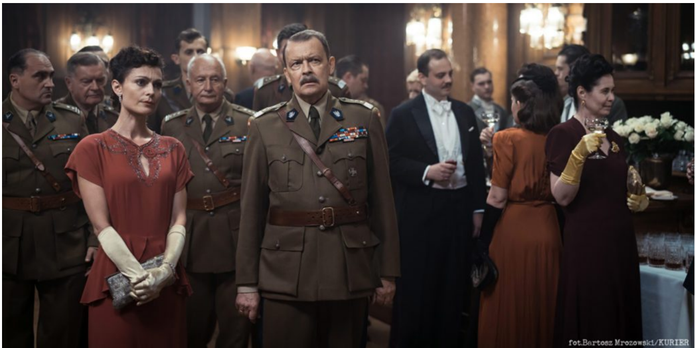
Kadr z filmu „Kurier”, To bardzo dojrzała wypowiedź.

W pewnym sensie. Główny bohater dostaje rozkaz, z którym się nie zgadza. Kreuje sobie antytezę i dąży do celu, żeby realizować ten drugi scenariusz. Ta sytuacja pokazuje zresztą, jak skłócona była wtedy władza. Później, kiedy Nowak-Jeziorański spotyka młodych ludzi już uzbrojonych i orientuje się, że powstania nie da się zatrzymać, dochodzi do wniosku, że trzeba się poddać losowi i na spotkaniu z dowódcami AK wypowiada opinię, która tak naprawdę zgadza się z tym pierwszym rozkazem. Ta opinia jest „post-powstańcza”, to znaczy ten dialog nie miał historycznie nigdy miejsca w takiej formie, to już jest powiedziane z perspektywy. Ale merytorycznie wszystko się zgadza.