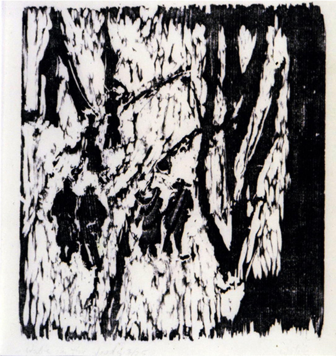
Spacer w lesie