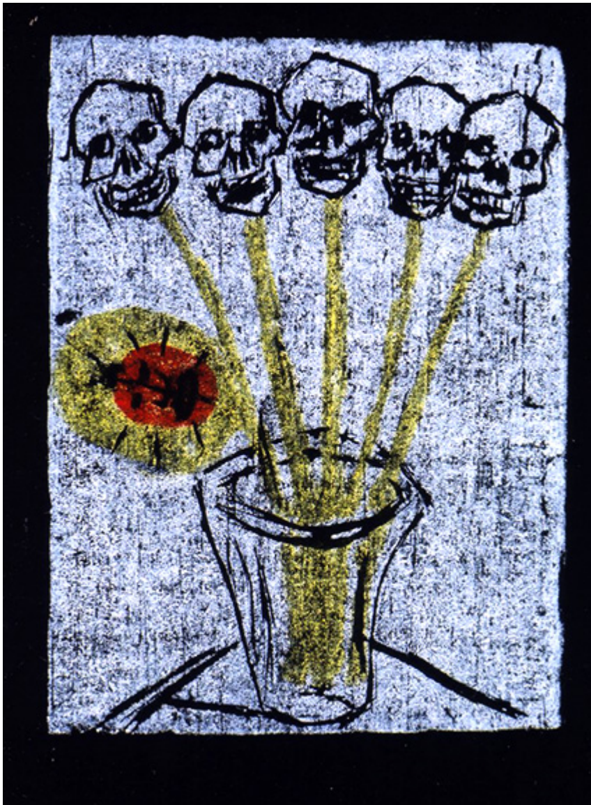
Życie po śmierci - bukiet