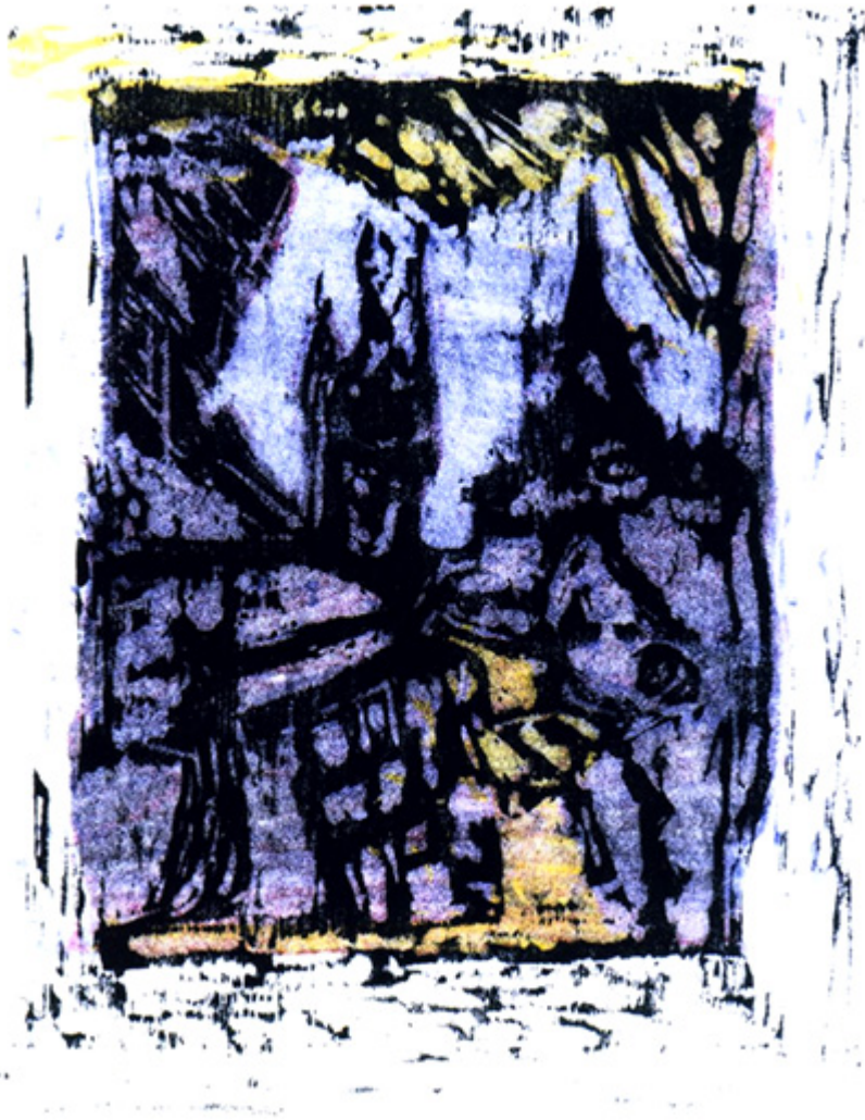
Dieppe (port na wybrzeżu francuskim nad kanałem La Manche w Normandii)