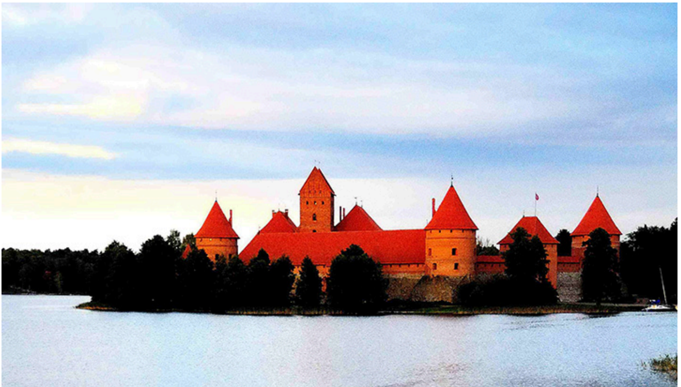
Troki, Litwa, fot. Tadeusz Szostak.