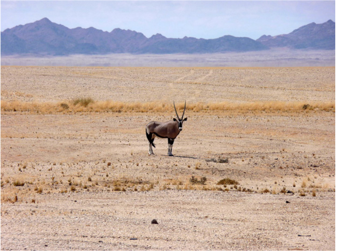
Antylopa oryks, fot. Wojciech Rogala.

Wojciech Rogala fascynująco opisuje tę wielką odyseję, podczas której ludzie kroczyli potężną karawaną przez pustynię, niczym biblijni Żydzi, nękani przez pragnienie, skwar i malarię. Owe wędrówki trwały z przerwami wiele lat. Ostatnia wyprawa miała miejsce w 1905 roku, kiedy to Burowie, którzy nie chcieli żyć pod panowaniem Brytyjczyków, osiadli w Humpacie, gdzie nie tylko uprawiali ziemię, ale również polowali na słonie, walczyli z oddziałami Owampo i zapuszczali się na tereny administrowane przez Niemców. Po I wojnie zaczęli osiedlać się w Afryce Południowo-Zachodniej, gdzie stworzono osadnikom bardzo