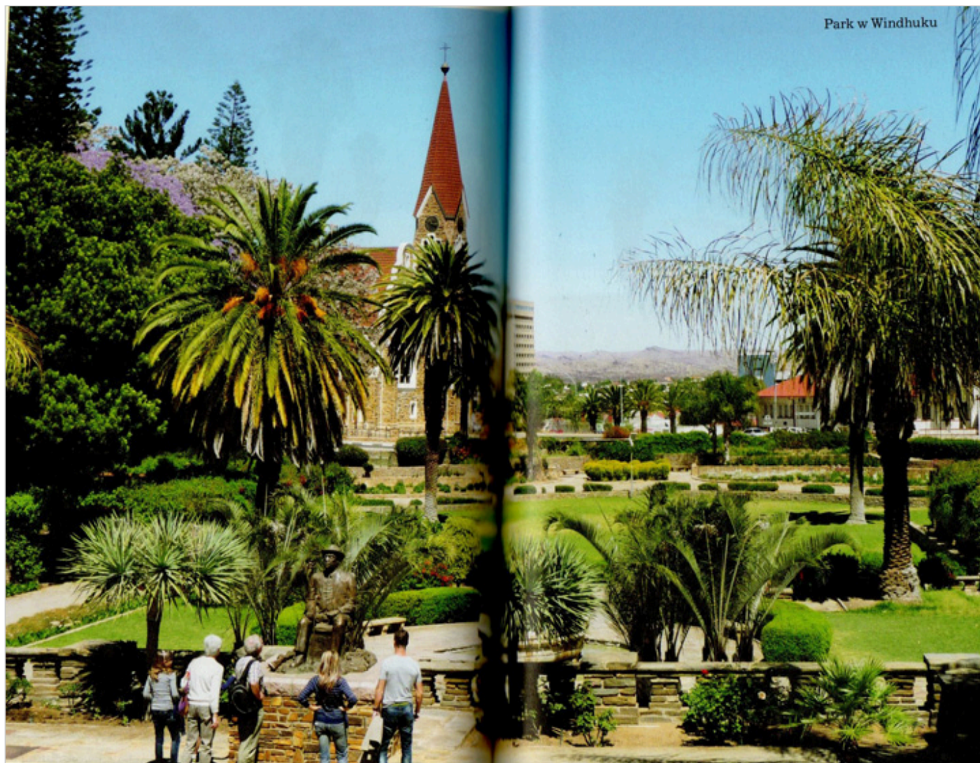
Park Windhuku, skan książki.

wtajemnicza nas w jej historię i terażniejszość. Skwapliwie i z ochotą podąża się za takim przewodnikiem, który snuje swą opowieść, nie szczędząc nam niczego, co pozwoliłoby uruchomić wyobraźnię, refleksję i – koniec końców – tęsknotę, aby tam pojechać i doświadczyć.