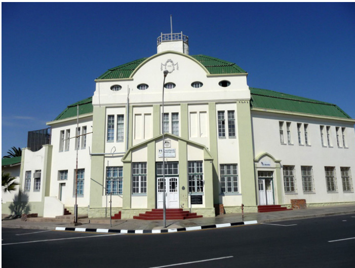
Zabytkowy budynek dworca kolejowego w Luderitz, fot. Wojciech Rogala.