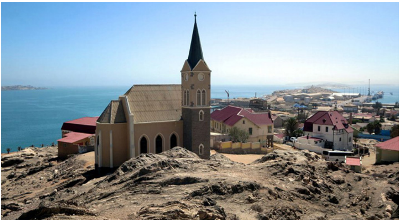
Felsenkirche (1912), kościół na skałach w namibijskim mieście Luderitz, fot. David Stanley.

Pierwszy taki obraz, który zapamiętałam, to scena z namibijskiego kurortu – Swakopmundu. Reporter obserwuje wiekową białą kobietę, która porusza się za pomocą „balkoniku”, asekurowana przez czarnoskórą opiekunkę. Potem starsza pani, już w kostiumie kąpielowym, zmierza z wielkim trudem, już bez niczyjej pomocy, w kierunku oceanu. Po chwili zanurza się w lodowatej wodzie, która sprawia, że jej ciało staje się na ten czas sprawne jak niegdyś.