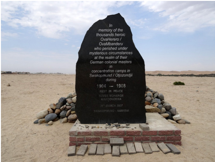
Pomnik na terenie dawnego obozu koncentracyjnego w Swakop, fot. Wojciech Rogala.

Autor nie tylko opisuje wydarzenia, snuje także refleksje, inspirując czytelników do tego samego. Intryguje go, jak ludzie charakteryzujący się taką pracowitością i samozaparciem, dzięki którym wznieśli piękne miasto na skraju pustyni, byli jednocześnie wierzący i ślepi moralnie, skoro nie odczuwali żalu ni skruchy z powodu tego, co się wydarzyło.