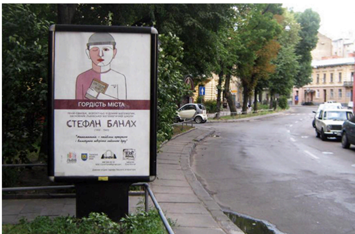
Stefan Banach na plakacie we Lwowie