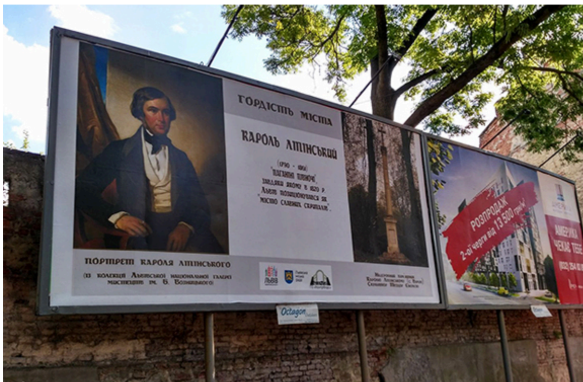
Karol Lipiński na plakacie we Lwowie