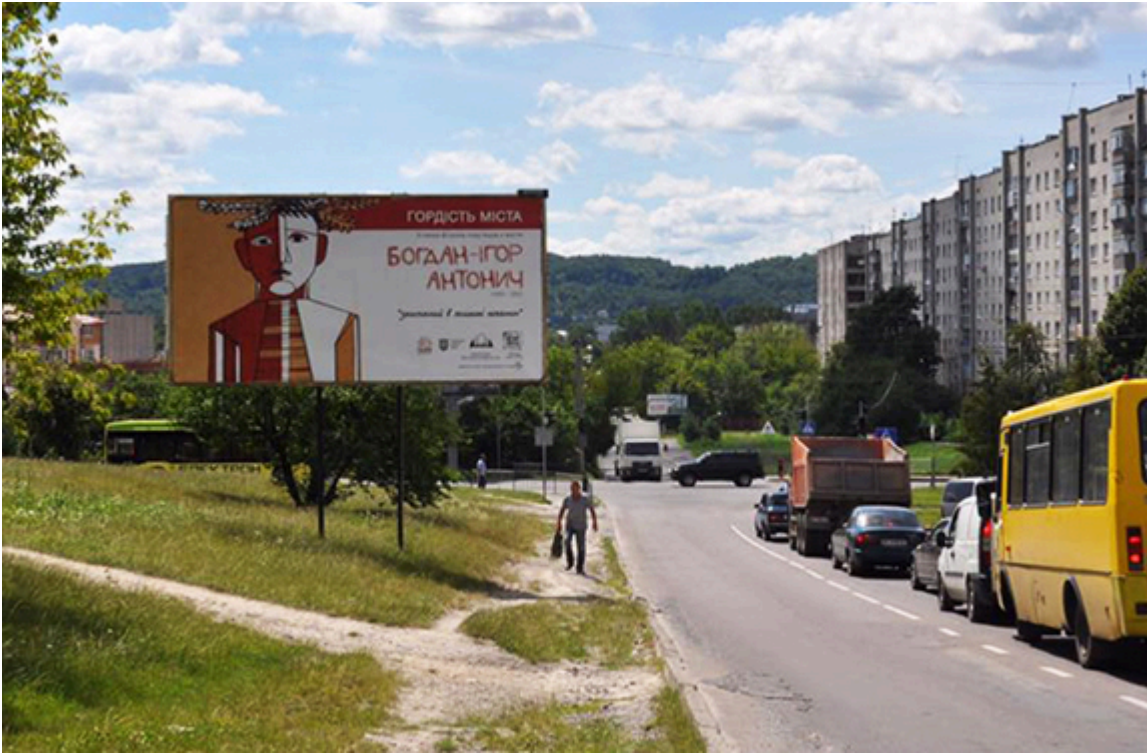
Bohdan Ihor Antonych na plakatach we Lwowie, fot. archiwum organizacji społecznej „ContrForce”, Eugeniusz Sało.