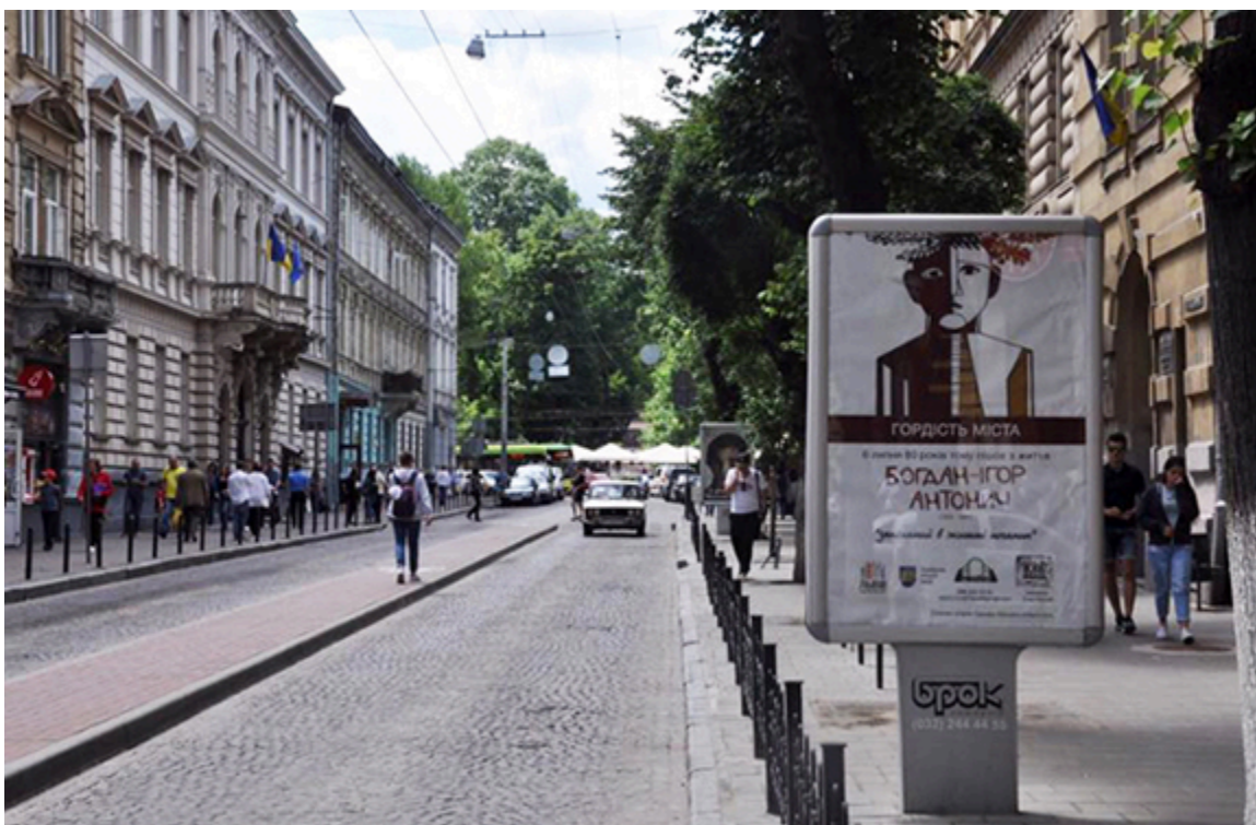
Bohdan Ihor Antonycz na plakatach we Lwowie, fot. archiwum organizacji społecznej „ContrForce”, Eugeniusz Sało.

W lipcu pojawiły się billboardy w nowym designie młodej artystki-