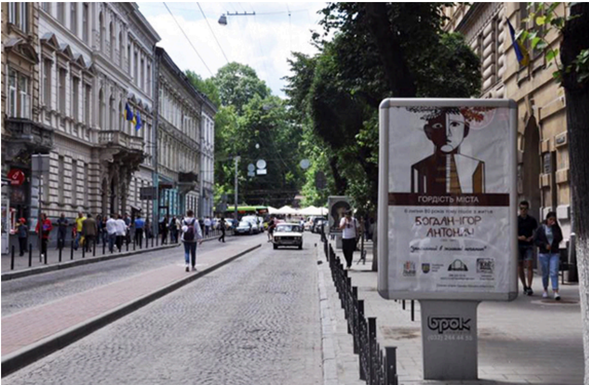
Bohdan Ihor Antonych na plakatach we Lwowie, fot. archiwum organizacji społecznej „ContrForce”, Eugeniusz Sało.

W lipcu pojawiły się billboardy w nowym designie młodej artystki-grafik ze Lwowa