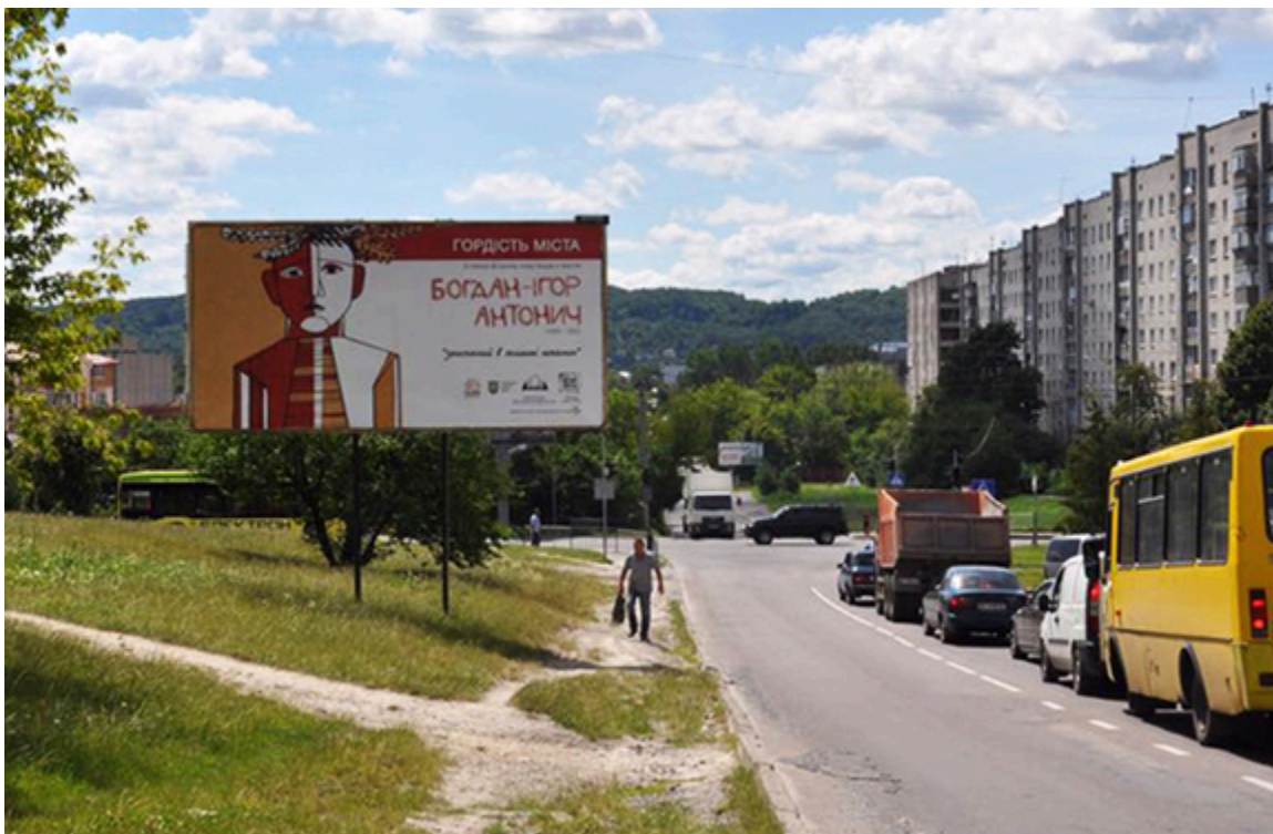
Bohdan Ihor Antonycz na plakatach we Lwowie, fot. archiwum organizacji społecznej „ContrForce”, Eugeniusz Sało.