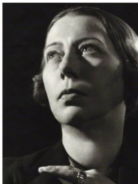
Bronisława Niżyńska, 1937 r.

JSG: Bronisława Niżyńska oprócz współpracy z Diaghilevem, miała własny zespół baletowy w Kijowie, była baletmistrem i choreografem Polskiego Baletu Reprezentacyjnego, założyła szkołę baletową w Los Angeles, współpracowała z American Ballet Theatre, kierowała też Buffalo Ballet Theater. Czy można powiedzieć, że artystka odniosła światowy sukces?