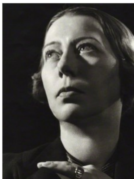
Bronisława Niżyńska, 1937 r.

JSG: Bronisława Niżyńska oprócz współpracy z Diaghilevem, miała własny zespół baletowy w Kijowie, była baletmistrem i choreografem Polskiego Baletu Reprezentacyjnego, założyła szkołę baletową w Los Angeles, współpracowała z American Ballet Theatre, kierowała też Buffalo Ballet Theater. Czy można powiedzieć, że artystka odniosła światowy sukces?