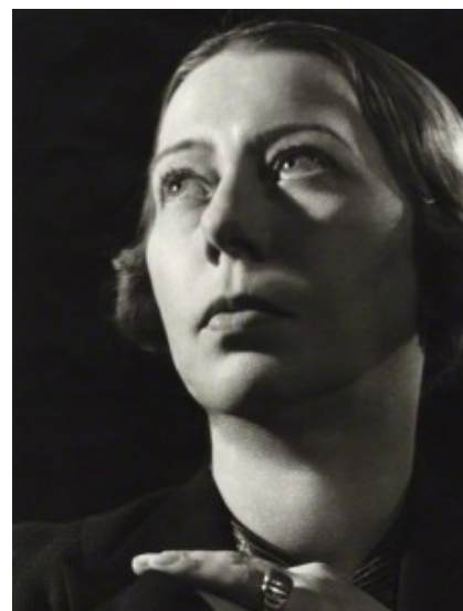
Bronisława Niżyńska, 1937 r.

JSG: Bronisława Niżyńska oprócz współpracy z Diaghilevem, miała własny zespół baletowy w Kijowie, była baletmistrem i choreografem Polskiego Baletu Reprezentacyjnego, założyła szkołę baletową w Los Angeles, współpracowała z American Ballet Theatre, kierowała też Buffalo Ballet Theater. Czy można powiedzieć, że artystka odniosła światowy sukces?