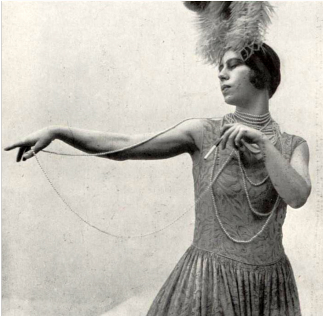
Bronisława Niżyńska w balecie „Les biches”, 1924 r.

JSG: Do jakich miejsc związanych z Bronisławą Niżyńską dotarła Pani zbierając materiały do książki?