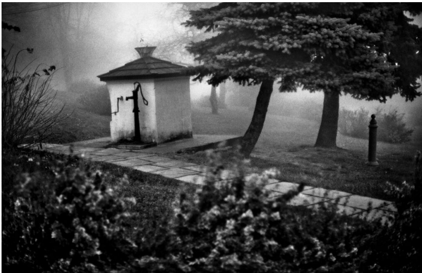
Zdjęcie z albumu „Lanckorona”

Z Bogdanem Frymorgenem, na stałe zamieszkałym w Londynie dziennikarzem i fotografem, o sztuce, muzyce i innych fascynacjach - rozmawia Bożena U. Zaremba ( Floryda ).