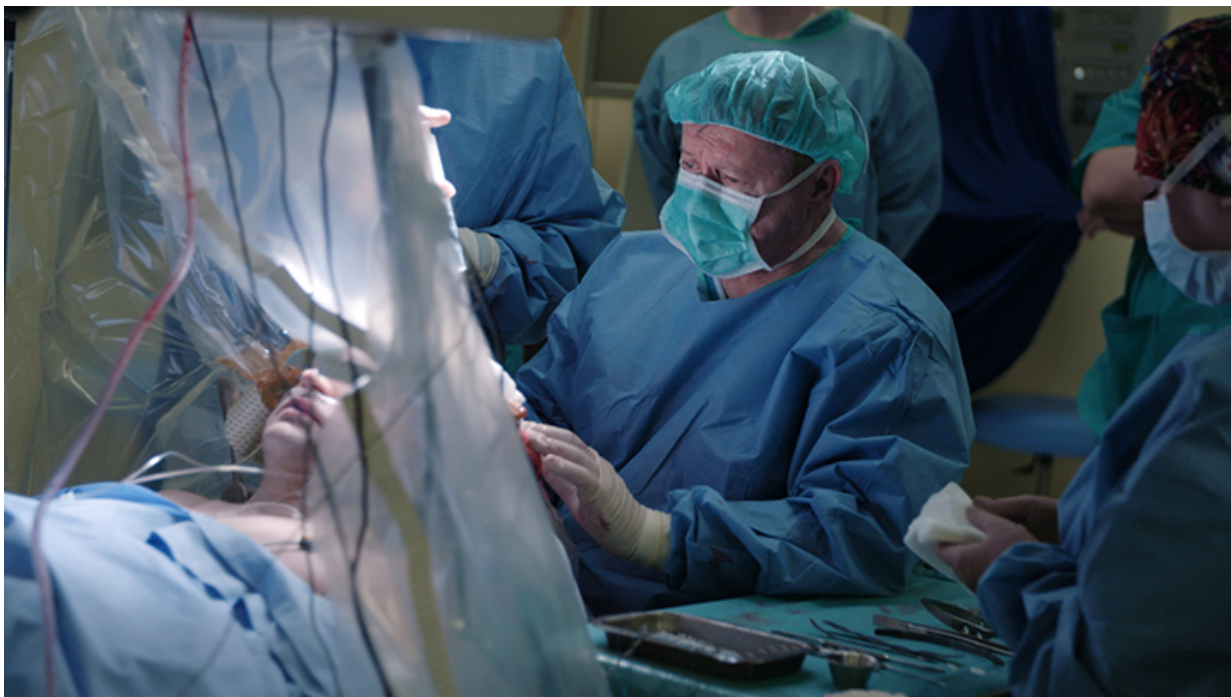
Kadr z filmu „Neurochirurg”

drzewa, czytać książki. Od 2005 roku związana z telewizją TVN. Autorka reportaży Uwagi TVN i Superwizjera TVN. Dwukrotnie nominowana do nagrody Grand Press.