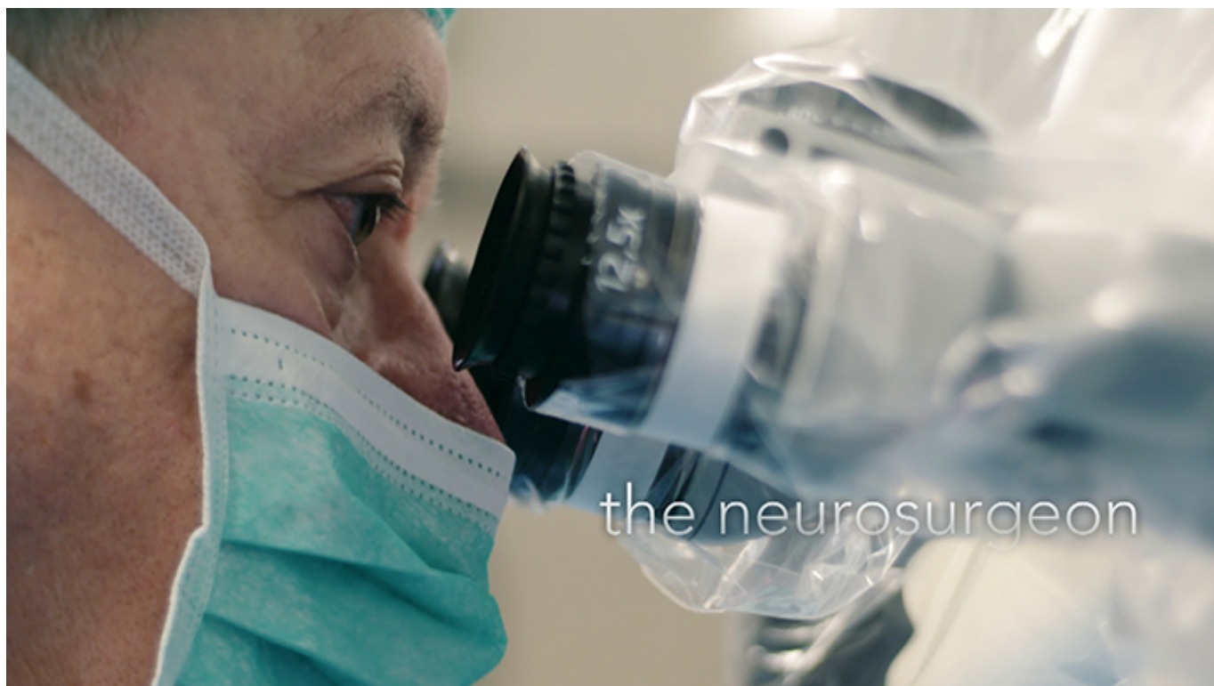
Kadr z filmu „Neurochirurg”

Polski reżyser filmowy i telewizyjny, scenarzysta, autor słuchowisk radiowych. W swojej twórczości koncentruje się na wydarzeniach historycznych oraz związanych z nimi dylematach egzystencjalnych i moralnych jednostki. Chętnie sięga po konwencję dramatu psychologicznego i thrillera. Urodzony w 1966 roku w Warszawie, absolwent historii KUL i łódzkiej Filmówki. Był nauczycielem historii oraz wykładowcą w Wyższej Szkole Dziennikarskiej im. Melchiora Wańkowicza.