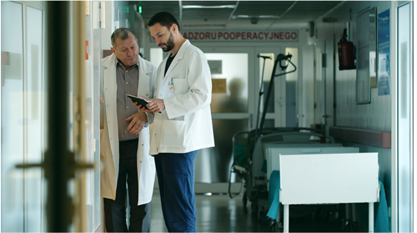
Kadr z filmu „Neurochirurg”

obecnie dwa wiodące ośrodki na świecie przeprowadzające operacje genowe.