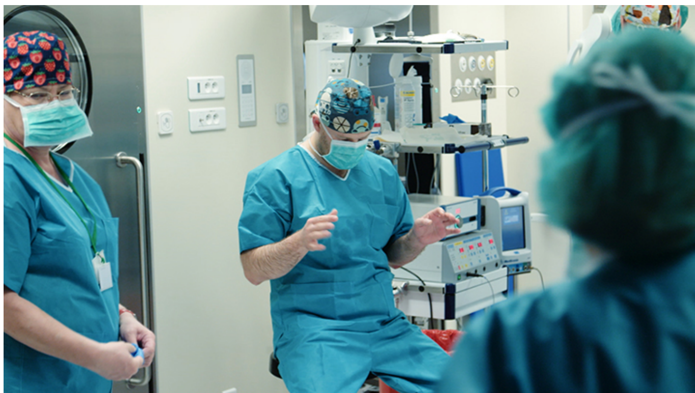
Kadr z filmu „Neurochirurg”