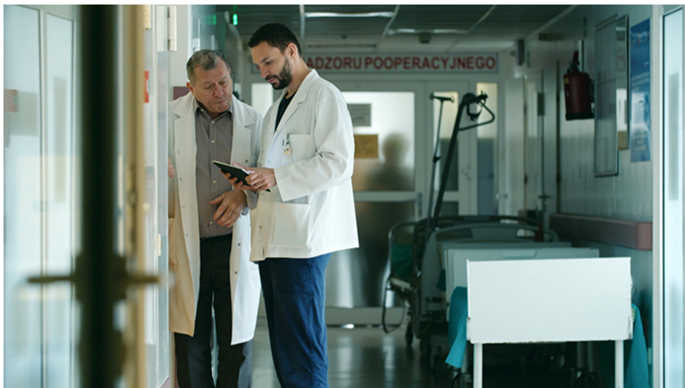
Kadr z filmu „Neurochirurg”