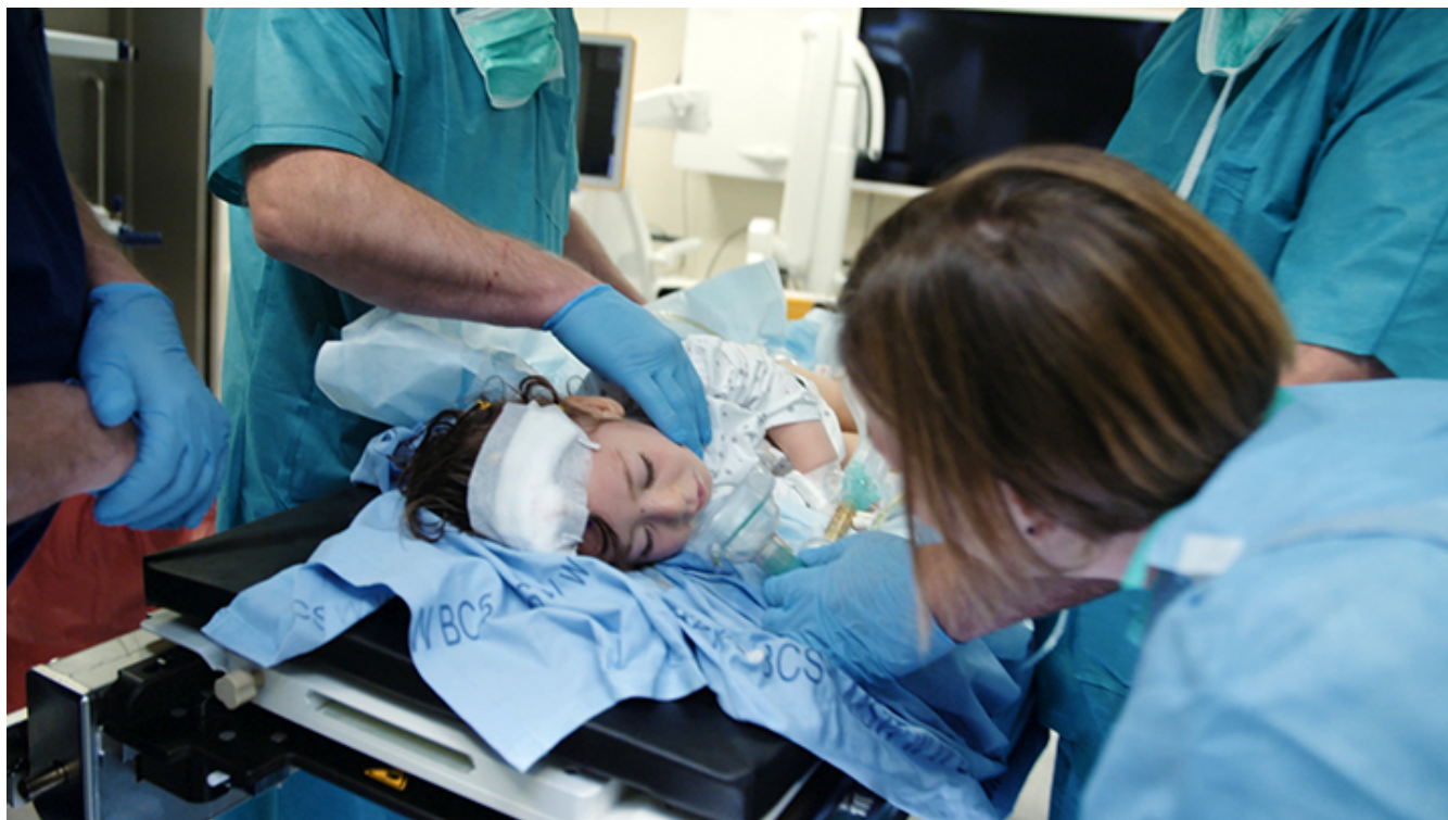
Kadr z filmu „Neurochirurg”