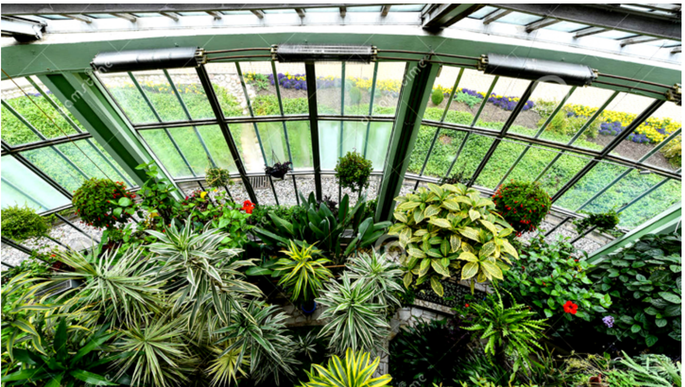
Ogród Zimowy przy pałacu Tyszkiewiczów w Kretyndze.

„Święcone” trwało dwa tygodnie. Przez pierwsze dwa dni świąt nie podawano na gorąco rosółu, potem można już było jeść wszystko. Szyunki, pieczeń cielęca, głowizna, młode prosiaki, drób, ryby w galarecie, rosyjskie paschy, wspaniałe do tego sosy w wielkim wyborze. Największą atrakcją były jednak ciasta. Olbrzymi „baumkuchen” miał metr wysokości. Do tego dwanaście ogromnych mazurków, pomarańczowy, kawowy, czekoladowy, daktyłowy, migdałowy, bakaliowy, królewski itd. Ponieważ kucharze w Kretyndze głównie pochodzili z kresów, więc wyspecjalizowani byli w świątecznych babkach. Na stole musiało być co najmniej dziesięć gatunków: chlebowa, petynetowa, kawowa, szafranowa... Kucharze coraz to donosili świeże potrawy, uzupełniali znikające. Przez pierwszych kilka dni jedzenie może i było atrakcją, bo takiej obfitości różnych specjałów na co dzień nie jadano, ale po dwóch tygodniach to i najbardziej wykwintna potrawa, podana w nadmiarze mogła się przejeść.