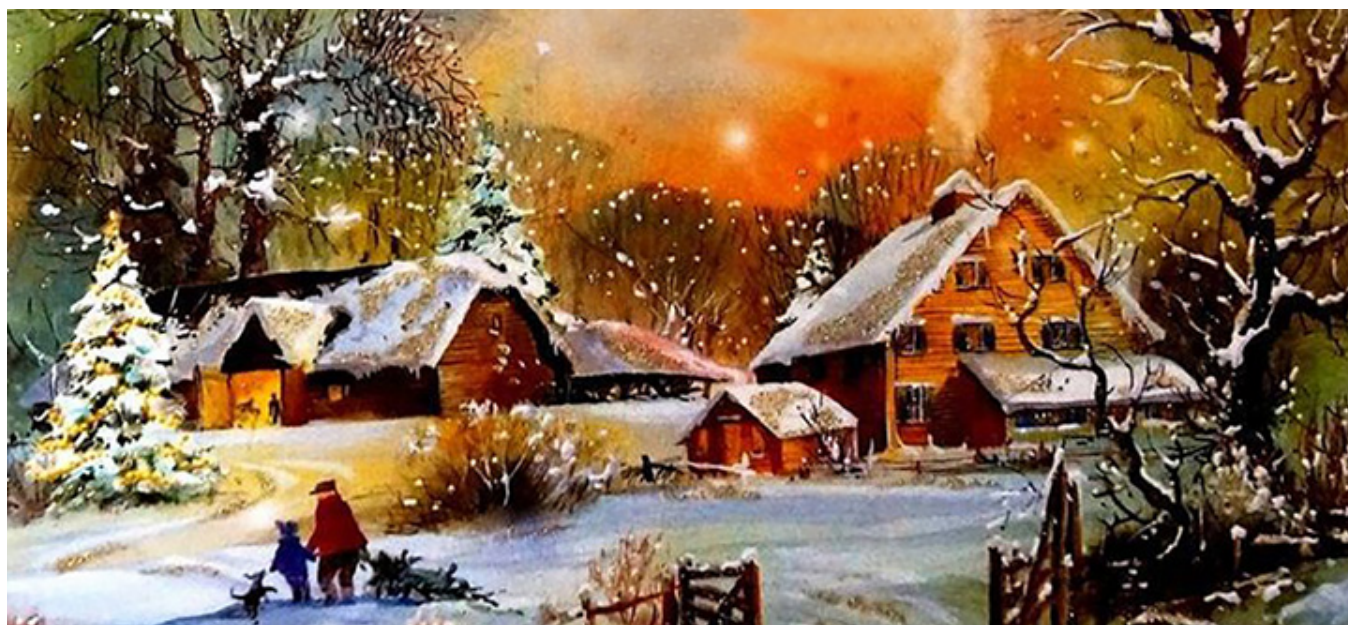
Boże Narodzenie na pocztówce