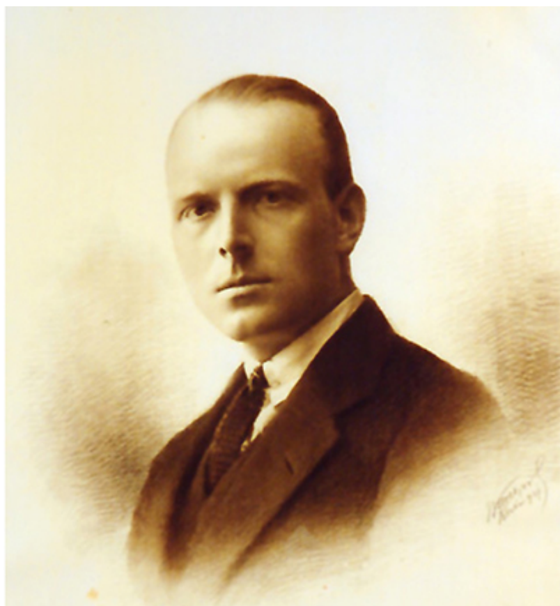
Alfred Potocki, IV ordynat (1886-1958)

Gośćmi ordynata Potockiego byli prezydent Mościcki, minister Beck, królowa Rumunii, księstwo Kentu. Wizyty te hrabia Alfred starannie opisywał: