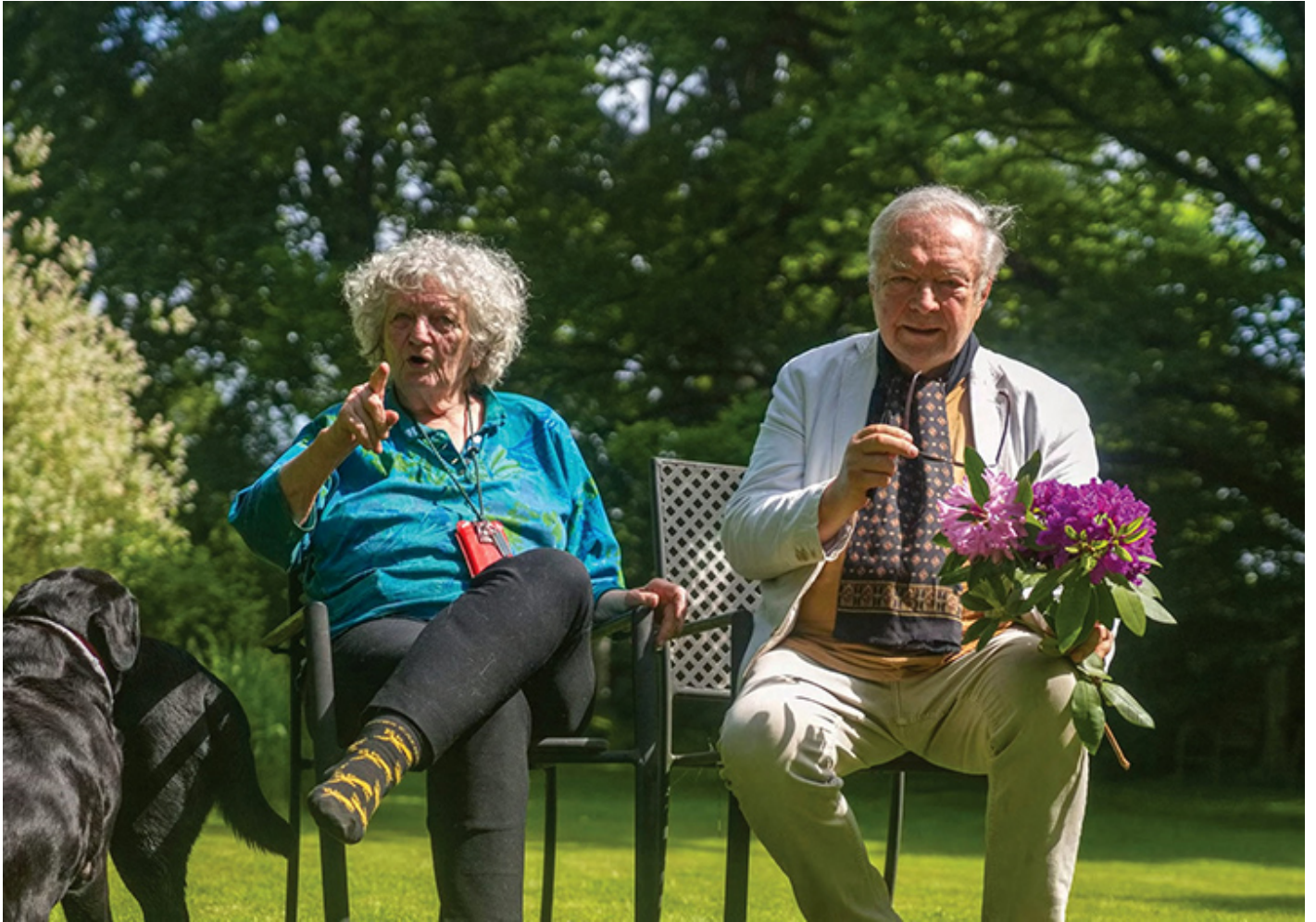
Elżbieta i Krzysztof Zanussi